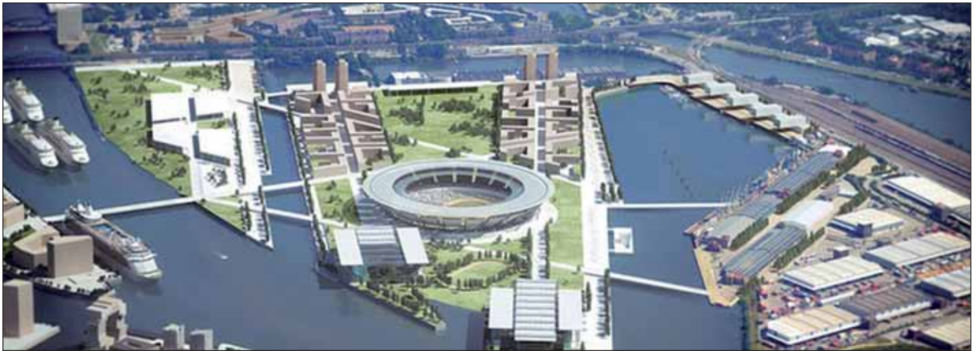
Kleiner Grasbrook in der Zukunftsvision

Wie würde der Olympia-Zuschlag Hamburg sozial und städtebaulich verändern? Das waren die beiden Fragen, die die Gewerkschaftslinker bei einem Jour-Fixe am 1. Juli aufgeworfen hatte. Lassen wir uns einmal auf dieses kleine Gedankenexperiment ein, denn noch ist ja alles offen mit der hamburgischen Olympia-Bewerbung, die Entscheidung fällt schließlich erst per Referendum am 29. November 2015. Bis dahin gilt es die Mehrheit zu gewinnen, so hat es jedenfalls den Anschein, angesichts der uns geradezu überrollenden Kampagne von Senat, Abendblatt, HVV, Sportverbänden etc. Doch die Ablehnungsfront verbreitert sich und erstreckt sich mittlerweile von der zentralen NOlympia-Bewegung über DIE LINKE und den AStA bis hin zu den ersten Stadtteilinitiativen auf der Veddel und in St. Georg; zwei Demonstrationen in Wilhelmsburg und St. Georg haben stattgefunden, eine Volksinitiative ist auf den Weg gebracht.