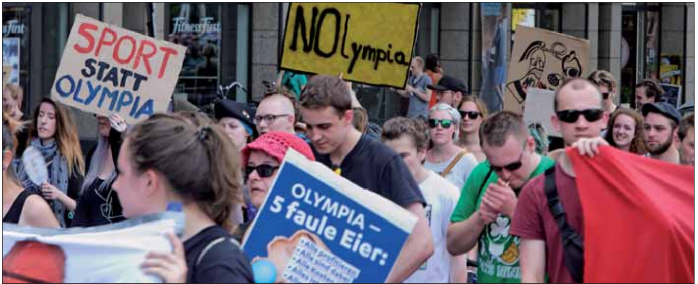
NOlympia-Demo am 4.7.2015