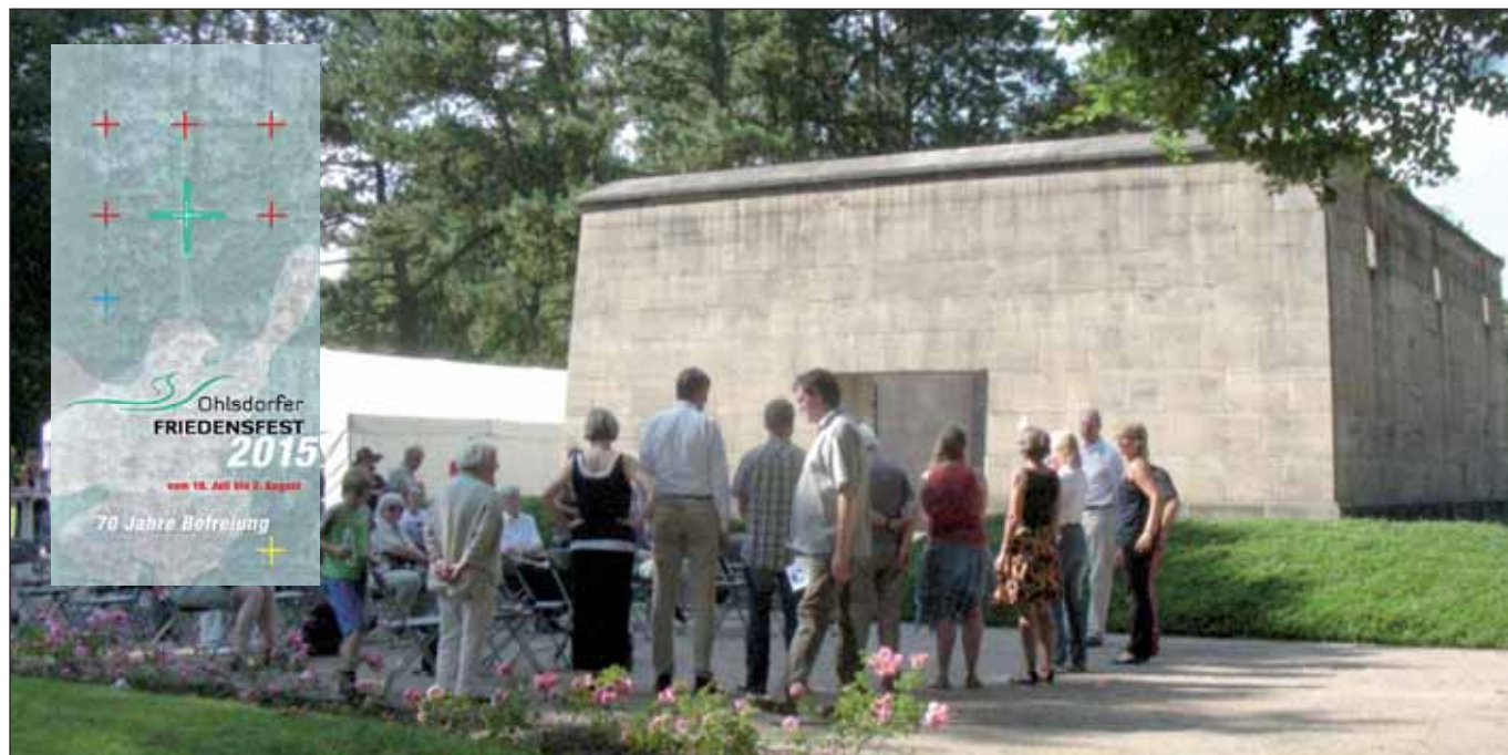
Friedensfest vor dem Mahnmal für die Bombenopfer, 2014

Zum siebten Mal finden in diesem Jahr, vom 18. Juli bis zum 2. August , auf dem Ohlsdorfer Friedhof zahlreiche öffentliche Veranstaltungen statt. Dass die Termine in den Sommerferien liegen, erklärt sich aus dem Gedenken an die Nächte des Hamburger Feuersturms vor 72 Jahren. Damals erlebte die Hamburger Bevölkerung eine unvorstellbare Kriegshölle. Um daran zu erinnern, dass diese für die Hansestadt bisher größte Katastrophe eine Folge der nationalsozialistischen Herrschaft war, und auch um die Befreiung vom Nationalsozialismus zu feiern, wird auf dem Ohlsdorfer Friedhof ein Friedensfest begangen. Gleichzeitig, so heißt es im Veranstaltungsfaltblatt, »werden dabei neue Formen des angemessenen Gedenkens gesucht und erprobt, denn die Spanne, in der Zeitzeugen und Zeitzeuginnen persönlich erzählen können, geht zu Ende« ( www.friedhof-hamburg.de/fileadmin/Dateien/bilder/veranstaltungen/pdf/Flyer_Friedensfest_2015.pdf ).