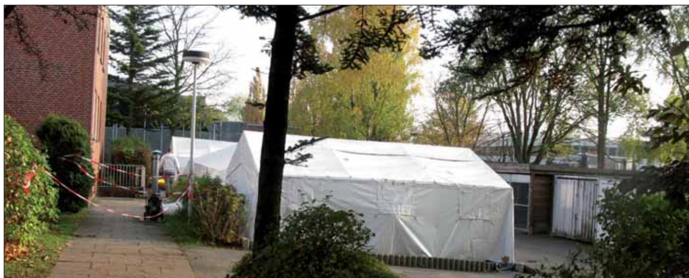
Unterkunft in der Drateinstraße