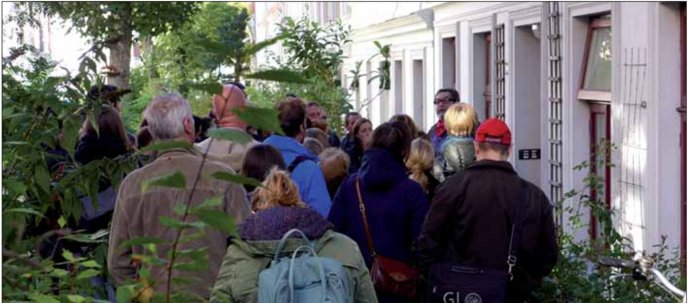
MietinteressentInnen im Falkenried, 2013

Auch wenn wir im »BrgerInnenbrief« wiederholt darauf hingewiesen haben, dass die in Hamburg mit Verzgerung zum 1. Juli 2015 in Kraft getretene Mietpreisbremse wohl eher ein Mietpreisbremschen ist, hat doch der massive Widerstand des Haus- und Grundeigentmerverbandes aufmerken lassen. Offenbar befrchtet dieses Grppchen eine Beschneidung ihrer in den letzten Jahren infolge der Wohnungsnot und des Mietwahnsinns reichlich eingefahrenen Extra-Profitte. Kaum hat dieser Verband grnes Licht gegeben – nicht ohne dem Senat eine baldige berprfung des neuen Gesetzes in Hamburg abzurufen –, wendet er sich gegen den Mieterverein zu Hamburg, der eine kluge und ffentlichkeitswirksame Idee platziert hat: die Online-berprfung der Miethhe. Wir danken dem Mieterverein fr die Erlaubnis, hier seine aktualisierte Pressemitteilung zum Thema aufzunehmen: