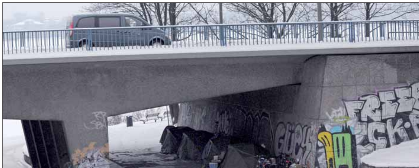
Obdachlose unter der Kennedybrücke, 28.12.2010