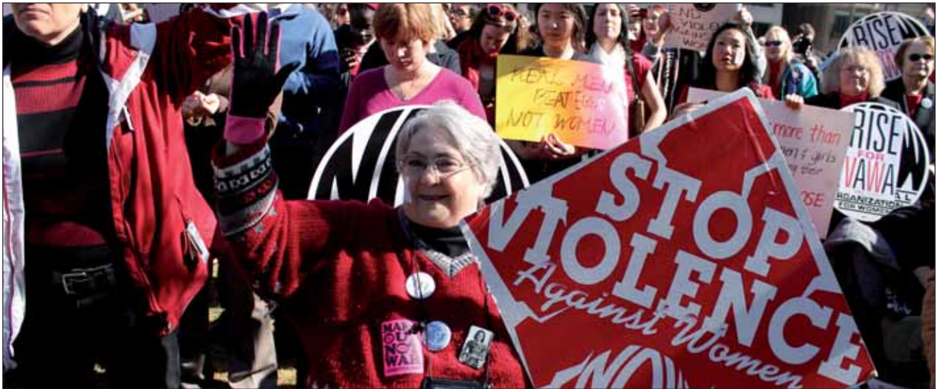
One Billion Rising, 2013, Washington D.C.

Wir nehmen hier ungekürzt den Aufruf »Gegen sexualisierte Gewalt und Rassismus. Immer. Überall. #ausnahmslos« auf, der mittlerweile von Tausenden Frauen und Männern unterzeichnet worden ist und der auch unseres Erachtens die Lage und die nötigen Forderungen gut auf den Punkt bringt. Das Dokument kann unter www.ausnahmslos.org unterzeichnet werden: