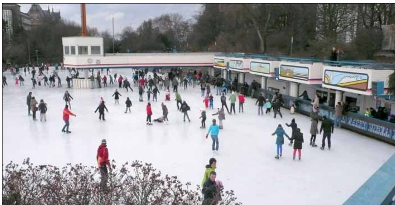
Schöne Seite des Winters – Eisbahn in den Wallanlagen