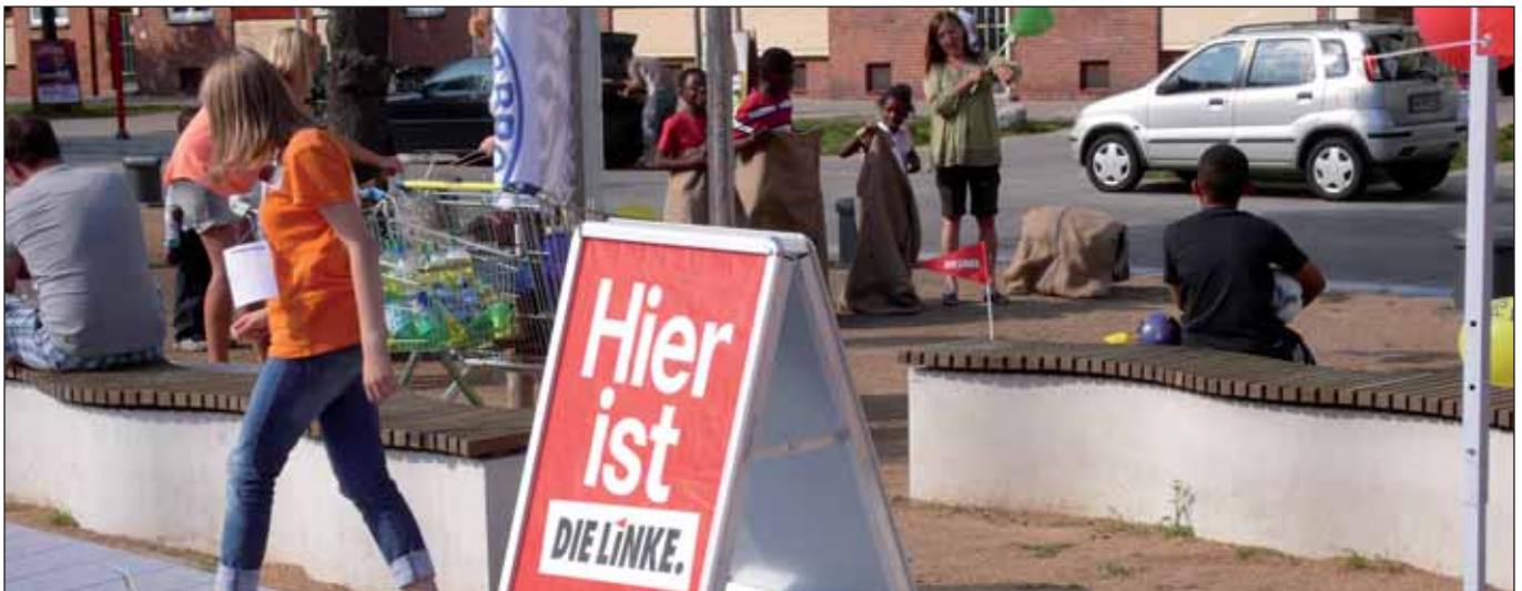
Osterbrookfest in Hamm, 7.9..2013

Der Mieterverein zu Hamburg und der Sozialverband Deutschland (SoVD) hatten im März 2015 auf die unerträglich hohe Kinderarmut in Hamburg hingewiesen. Mehr noch: In der Hansestadt sei ein »bedrohliches Anwachsen der Kinder- und Jugendarmut« festzustellen, 58.000 Kinder und Jugendliche unter 18 Jahren seien von Armut bedroht.