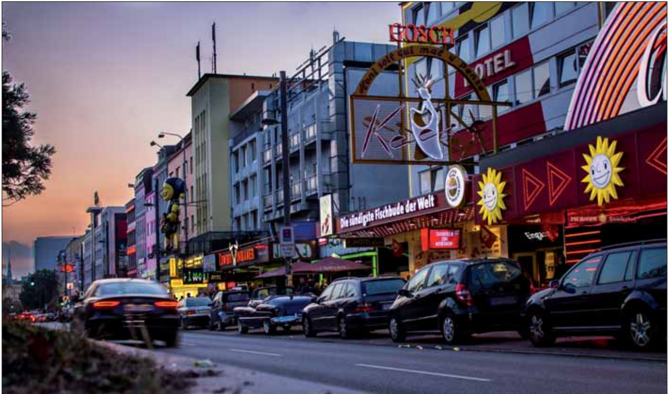
»Reeperbahn at dawn« von Florian Timm – https://flic.kr/p/pkF5D8

Die Übergriffe auf Mädchen und Frauen in der Silvesternacht in Köln, auf der Reeperbahn und am Jungfernstieg in Hamburg haben zu einer Riesendebatte in der Bundesrepublik ge-