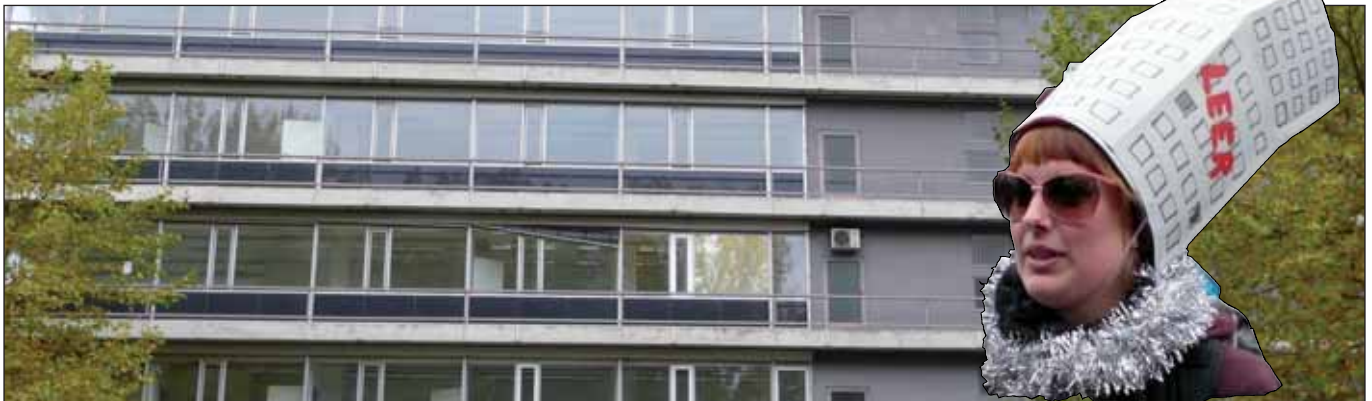
Leerstand City Nord + Mietendemo 2012

Durch die Geflüchteten, die in Hamburg Schutz suchen, wird nochmal extrem deutlich, dass es in Hamburg seit Jahren viel zu wenig günstige und Sozialwohnungen gibt. In dieser Situation ist es wichtig, auf alle Gruppen zu achten, die auf dem offiziellen Wohnungsmarkt Schwierigkeiten haben und die auf günstige Wohnungen angewiesen sind: Wohnungs- und Obdachlose, Menschen mit wenig Einkommen und die Geflüchteten. Ein gegeneinander Ausspielen dieser Gruppen hätte verheerende Folgen für das Zusammenleben in dieser Gesellschaft.