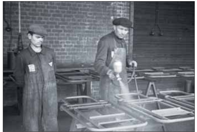
l.: Ausstellungsplakat, r.: Zwangsarbeiter bei der Firma Hans Still 1942

Die Ausstellung mit dem Titel »Zwangsarbeit. Die Deutschen, die Zwangsarbeiter und der Krieg« ist eine spannende Auseinandersetzung mit der systematischen Unterjochung und Ausbeutung von über 20 Mio. Menschen und gleichzeitig mit einem Teil des nationalsozialistischen Alltags. Männer, Frauen und Kinder aus fast allen Ländern Europas wurden als »Fremdarbeiter«, Kriegsgefangene oder KZ-Häftlinge in das nationalsozialistische Deutschland verschleppt oder mussten in den von der Wehrmacht besetzten Gebieten Zwangsarbeit leisten.