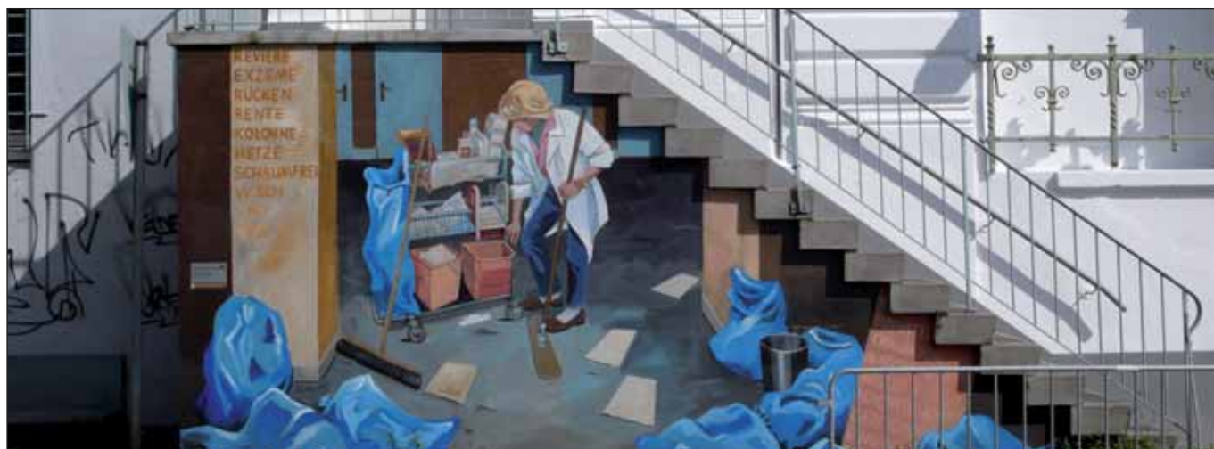
»Wisch und weg«, Wandbild von Hildegund Schuster, 1997, Große Elbstraße