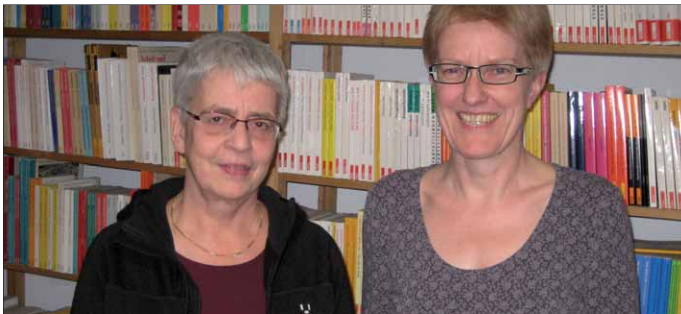
Die neuen HerausgeberInnen des BürgerInnenbriefs