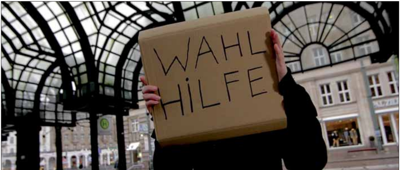
Immer nützlich... aus dem youtube-Wahlwerbespot der LINKEN

Der Versuch einer Erklärung von Heike Sudmann