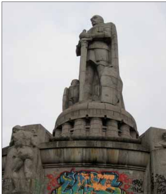
Bismarck und Rosa Luxemburg

Reichskanzler Otto von Bismarck (1815-1898) steht hoch im Kurs der Rechten. Ein Freund der Arbeiterbewegung ist er nie gewesen, doch er hatte ein Gespür dafür, dass zur Peitsche (des Sozialistengesetzes) bisweilen auch das Zuckerbrot (die Sozialgesetze) gehört, um sie im Zaum zu halten. Zu Hamburg hatte Bismarck immer ein gespaltenes Verhältnis: So galt ihm diese Stadt einerseits als Zentrale der Roten, insbesondere der bekämpften gewerkschaftlichen Arbeiterbewegung, andererseits aber ließ sich über den Hamburger Hafen auch die See- und Handelsmacht des Deutschen Reiches stärken. Die am 2. Juni 1906 eingeweihte, gut 34 Meter hohe Bismarck-Granitstatue – das größte Bismarck-Denkmal weltweit – steht für diesen Widerspruch: Nicht zufällig schaut der auf das Schwert gestützte Reichskanzler nicht auf die Stadt und das schon zu einem Drittel mit Sozialdemokraten besetzte Rathaus, sondern auf den Hafen. Eine Legende, die jede/r Stadtführer/in im Repertoire hat.