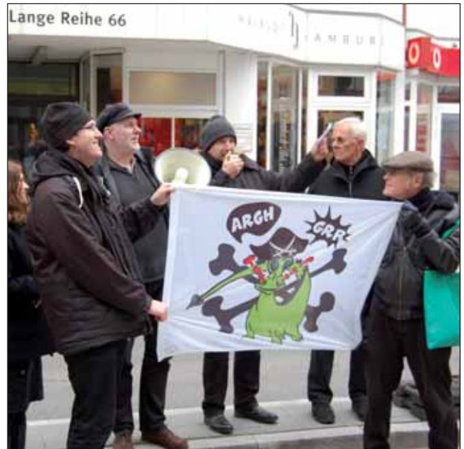
L.: Elisa stirbt (M. Joho), r.: Demo auf der Langen Reihe (D. Prösdorf)

Am Abend des Abrissbeginns fand noch einmal eine Kundgebung der Initiative vor dem Gebäude statt. Wut, Empörung