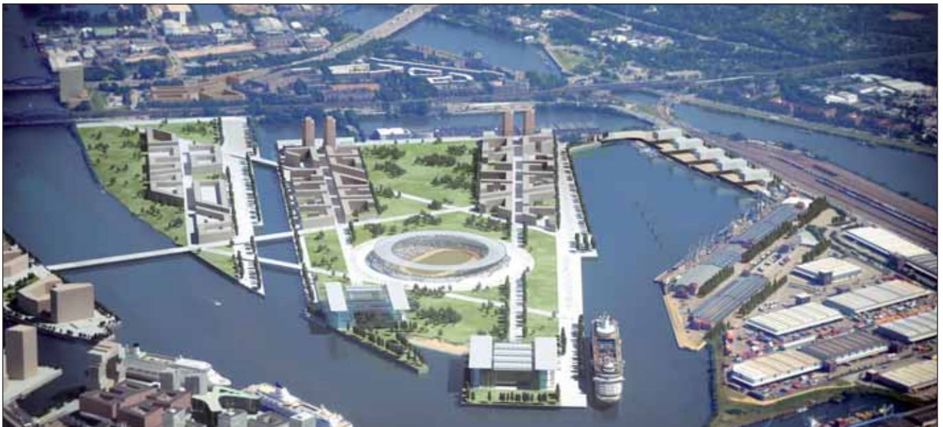
Schöne neue Olympia-Welt - von oben

... und vergeigt auf diese Weise schon einmal 50 Millionen Euro alleine für die Bewerbungskosten, von den Kosten in Milliardenhöhe - sollte Hamburg wider Erwarten den Zuschlag bekommen - ganz abgesehen.