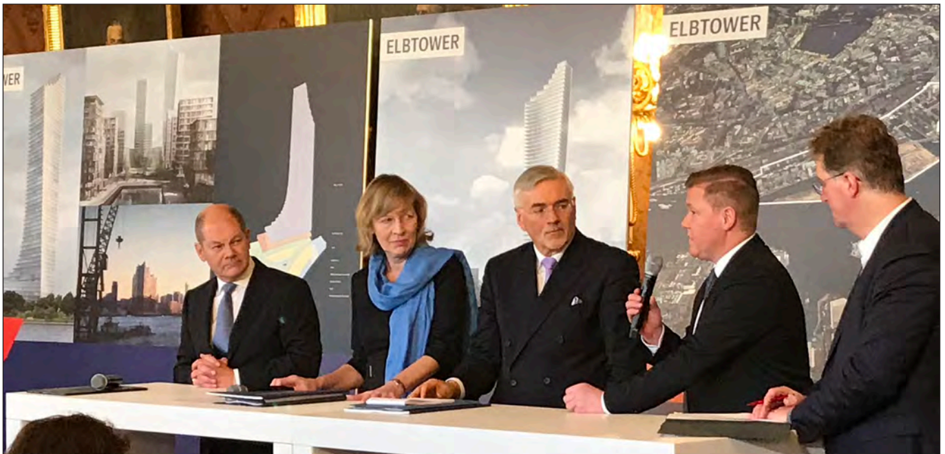
»Scholz und sein Denkmal«: Elbtower-Präsentation, 8.3.2018

Hamburgs bisheriger Finanzsenator Peter Tschentscher soll Olaf Scholz nachfolgen. Bürgermeisterin Katharina Fegebank von den GRÜNEN behauptet: »Natürlich bedeutet der Weggang von Olaf Scholz auch eine Chance, die Karten an der einen oder anderen Stelle neu zu mischen.« Ein neues Mischen ist zum Machterhalt unverzichtbar, denn die SPD kommt in Hamburg laut aktueller Umfrage nur noch auf 28%, das heißt, Rot-Grün hat keine Mehrheit mehr. Wahlentscheidend wird sein, wie der künftige Bürgermeister seine neue Rolle ausfüllt. Angesagt ist die Fortsetzung der politischen Philosophie unter Scholz: »Ordentliches Regieren«. Entscheidend ist, ob die hanseatische SPD damit den Vertrauensverlust wettmachen kann und wieder Wahlen gewinnt.