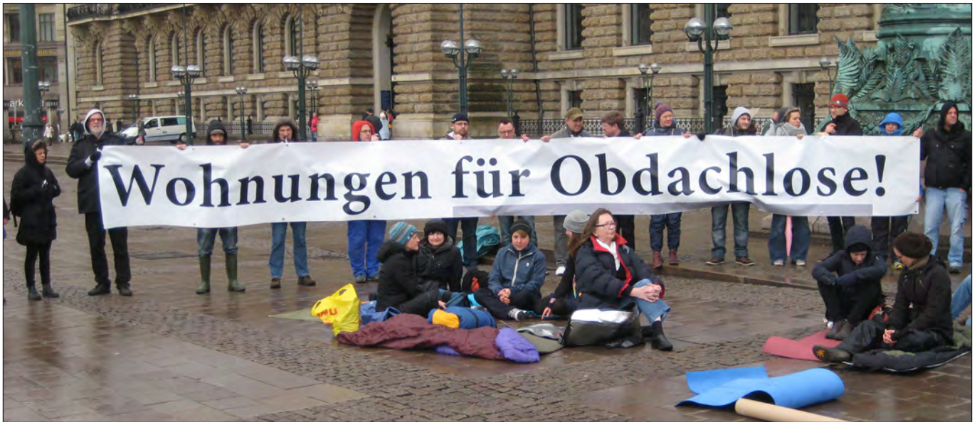
Aktionsbündnis gegen Wohnungsnot auf dem Rathausmarkt 2015