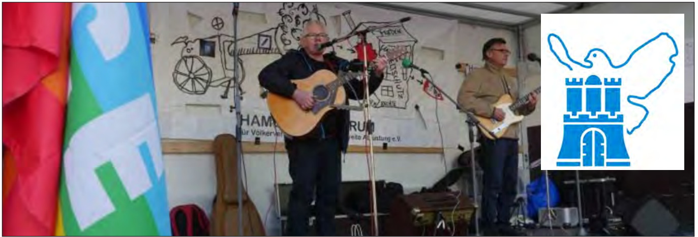
Die Gruppe »Gutzeit« beim Ostermarsch 2017 (Hamburger Forum)

Wie schon in den Vorjahren rufen wir auf zur Beteiligung am Ostermarsch, der traditionellen und einmal mehr (über) lebensnotwendigen Manifestation für Frieden, Entspannung und Abrüstung. Er findet am Ostermontag, den 2. April, statt. Um 11.30 Uhr gibt es zunächst eine Osterandacht in der am Hauptbahnhof gelegenen Dreieinigkeitskirche, um 12.00 Uhr startet auf dem St. Georgs Kirchhof die Demonstration, die Abschlusskundgebung samt Friedensfest steigt gegen 13.30 Uhr auf dem Carl-von-Ossietzky-Platz.