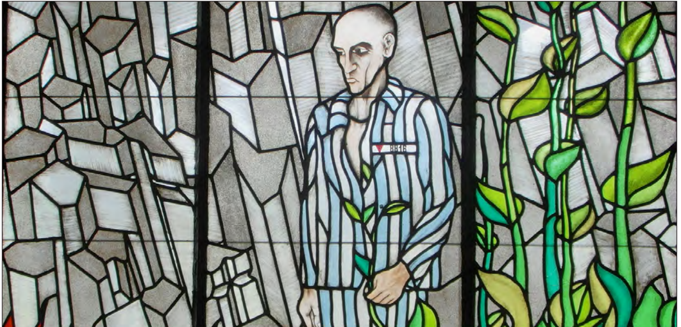
Erinnerung an das Leiden und die Befreiung der KZ-Gefangenen, hier im ehemaligen KZ Groß-Rosen bei Breslau/Wroclaw