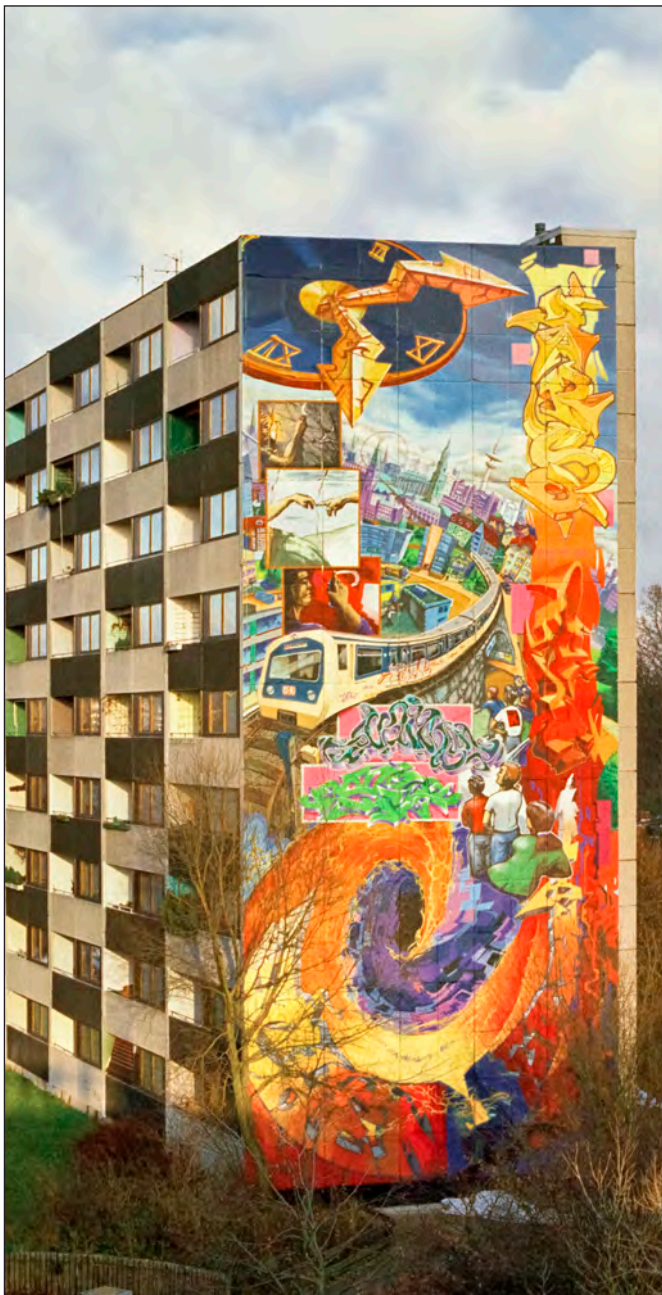
Otto-Schumann-Weg, Hamburg-Lohbrügge, 1996

Soziale Politik wird auch in den kommenden vier Jahren in der Opposition gemacht. Gemeinsam mit den Mieterinnen und Mietern wird sich DIE LINKE dem neoliberalen Weiter-so in der Wohnungspolitik entgegenstellen – in den Parlamenten und auf der Straße!