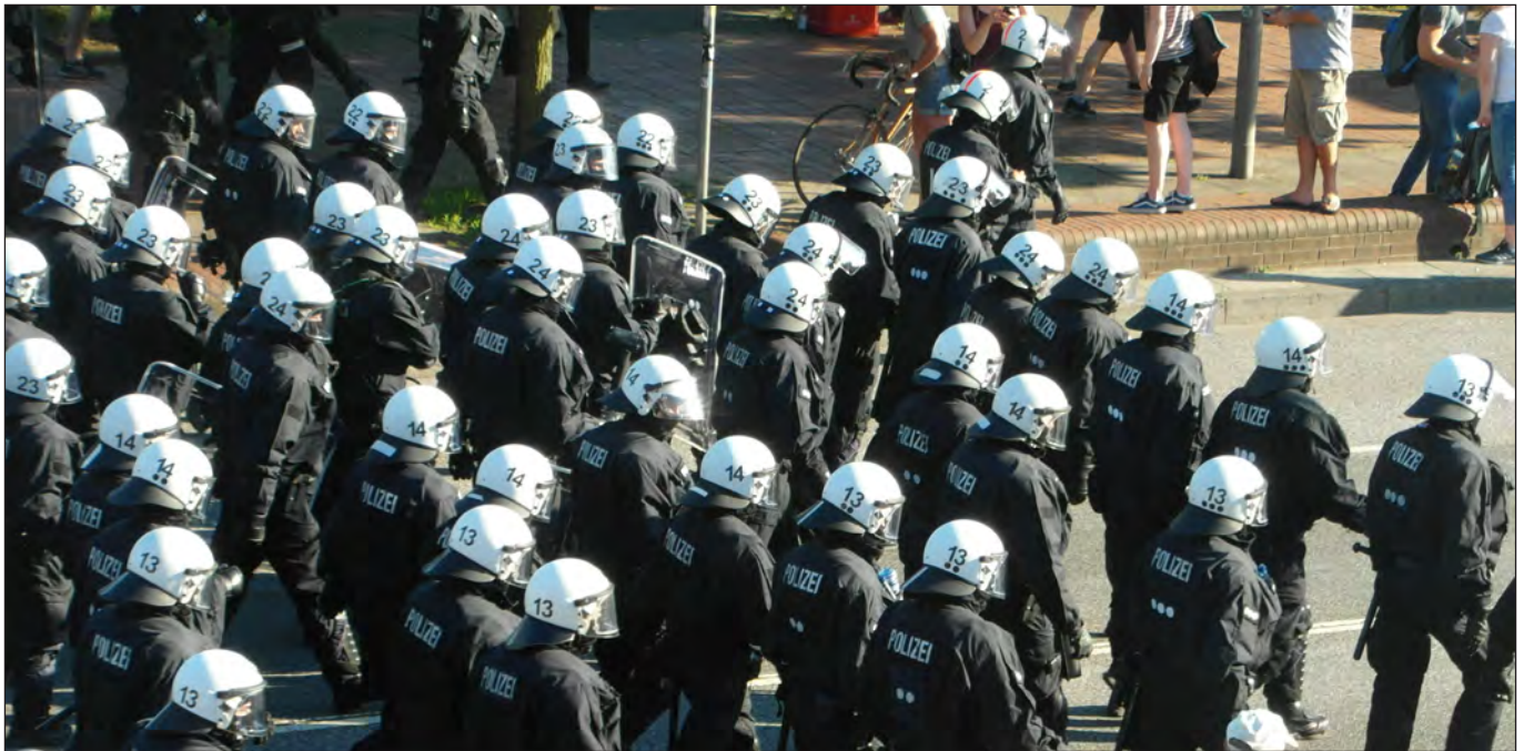
Tja, wer war's denn nun?

Nathalie Meyer zur Kennzeichnungspflicht für Polizeibedienstete