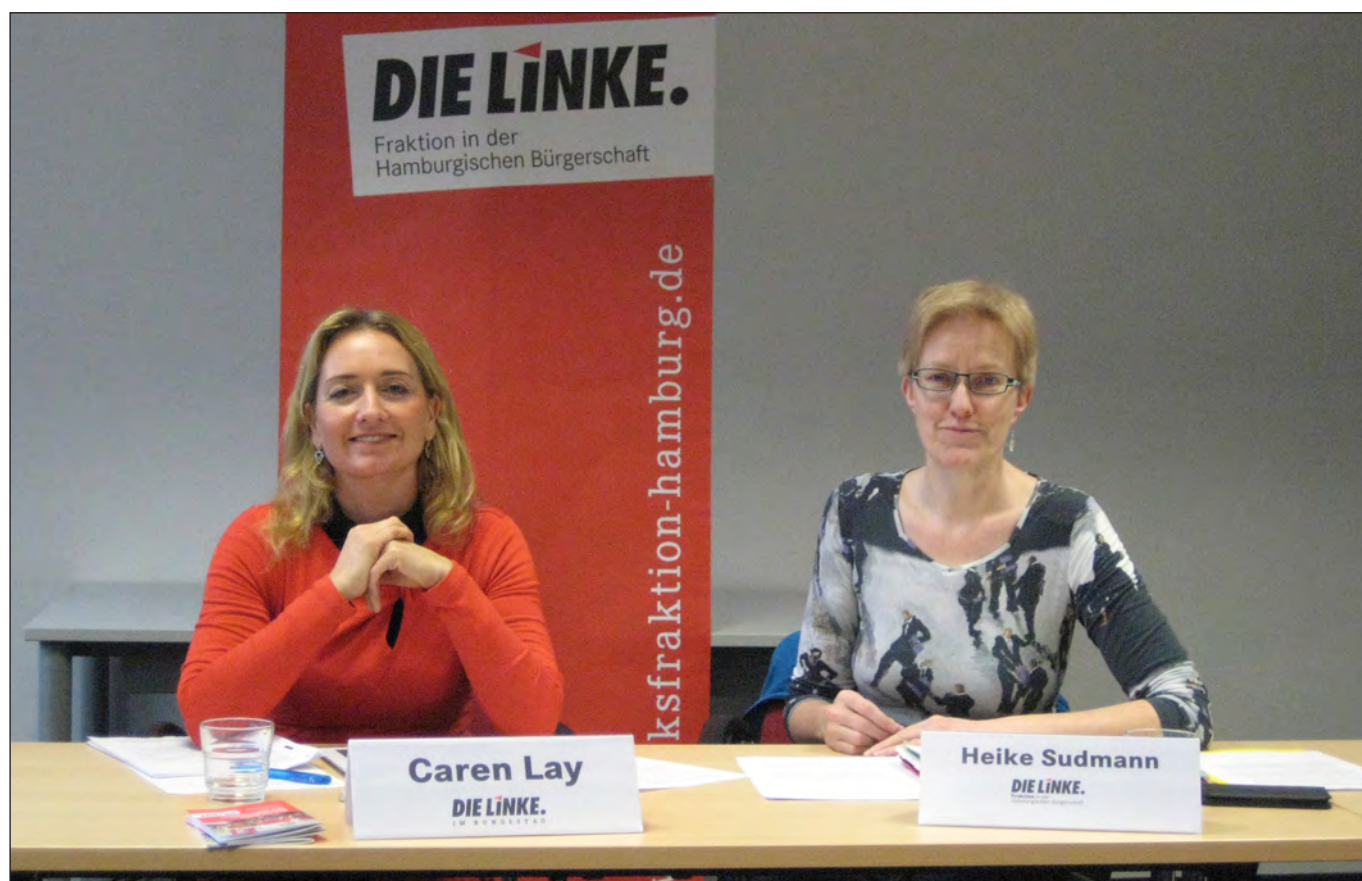
Auf einer wohnungspolitischen Veranstaltung in Steilshoop 2015

Caren Lay über die zynische Wohnungspolitik der Groko 3.0