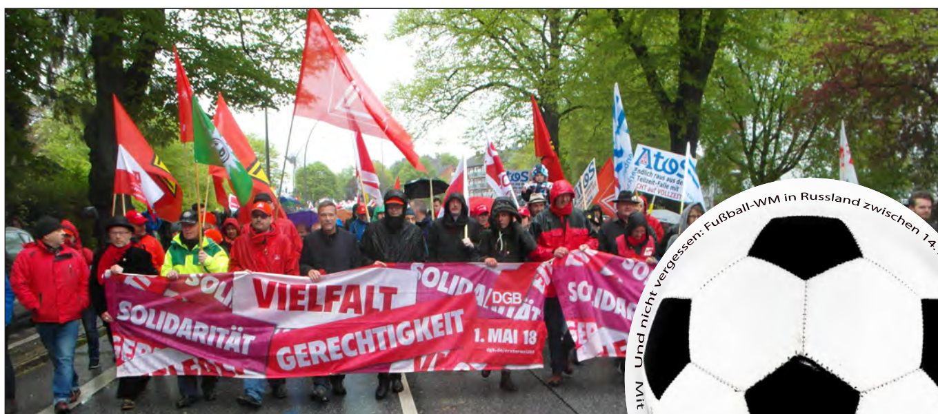
DGB-Demo am 1. Mai 2018

den heißen Tagen im Mai folgen in den kommenden Wochen und Monaten gleich mehrere heiße Aktionen, der Sommer soll zeigen, was Hamburgs alternative und linke Szene zu bieten hat. Am Samstag, den 2. Juni , wird der Reigen mit einem großen MIETENmove! eröffnet. Tausende HamburgerInnen werden sich um 13.00 Uhr auf dem Spielbudenplatz treffen, um »Gemeinsam für eine andere Wohnraumpolitik« zu demonstrieren. Ein Jahr nach dem famosen G20-Gipfel in Hamburg wird es verschiedene Veranstaltungen und andere Initiativen geben, darunter vom 5. bis 8. Juli ein Festival der grenzenlosen Solidarität , mit Workshops, Aktionen, einem Rave und einer Demonstration. Und am Samstag, den 29. September , wird Hamburg zum Schauplatz einer bundesweiten antirassistischen Parade unter der Parole United Against Racism .