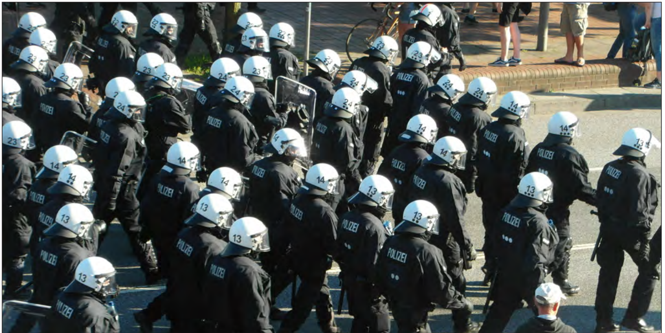
Erst vermurmt und dann eine fragwürdige Massenfahndung