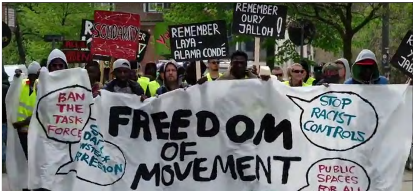
Demo gegen auf St. Pauli am 28.4.2018