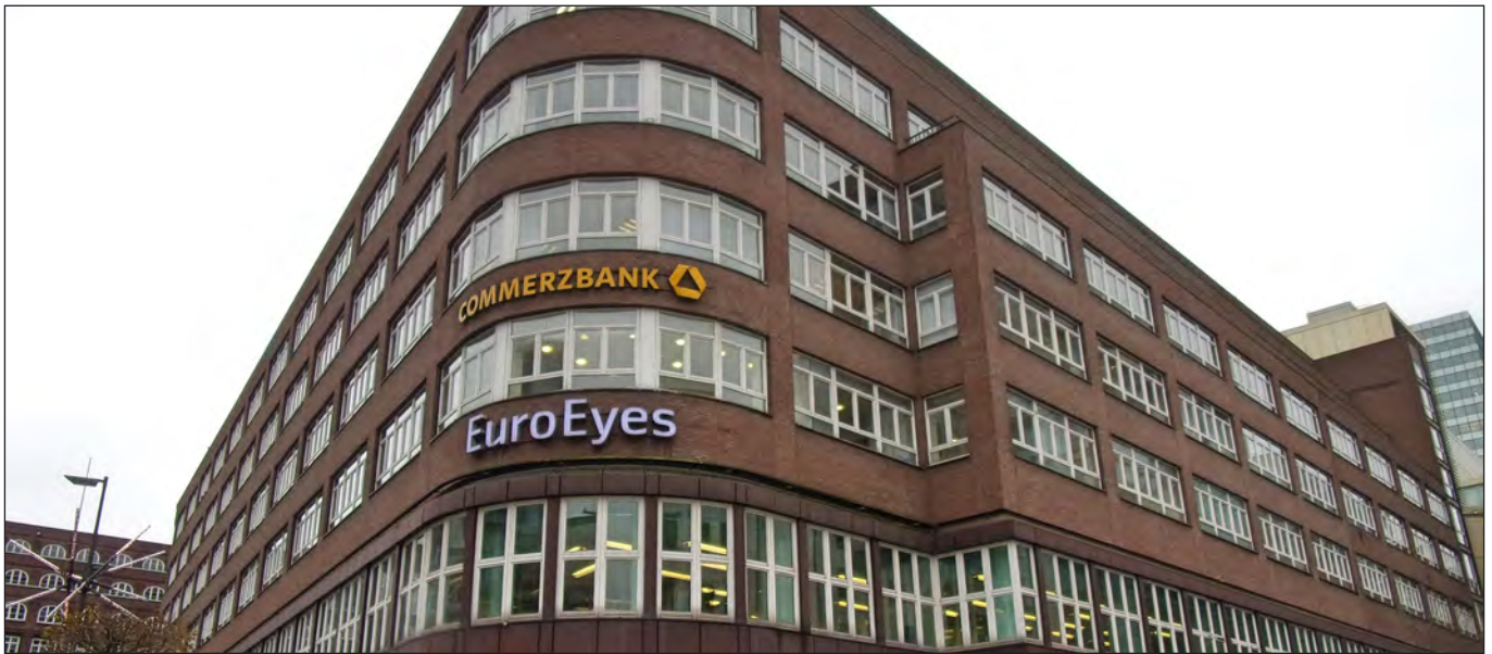
Deutschlandhaus von Drehbahn/Dammtonstraße aus