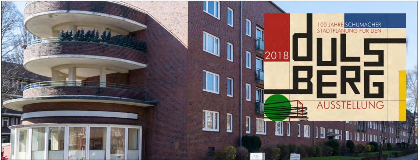
Foto: Laubenganghaus Oberschlesische Straße 11

»Dunkelroter Backstein, Reformwohnungsbau, vielfältige Grün- und Freiraumstrukturen – als Stadterweiterungsgebiet der 1920er Jahre stellt die Hamburger Wohnsiedlung Dulsberg eine wichtige Zeitschicht der europäischen Stadt dar. Vorausgegangen war ein im Jahr 1918 nach modernsten Kriterien reformierter Bebauungsplan des damaligen Oberbaudirektors Fritz Schumacher« ( https://dulsberg-denkmalschutz.de/2018/05/17/der-stadtteil-dulsberg-feiert-100-jahre-schumacher-stadtplanung-fuer-den-dulsberg-in-jubilaeumswochen-vom-3-6-bis-1-9-2018/ ). Mit diesen Worten wird ein Stadtteil beschrieben, der in den kommenden Monaten verstärkt in der Öffentlichkeit wahrgenommen wird.