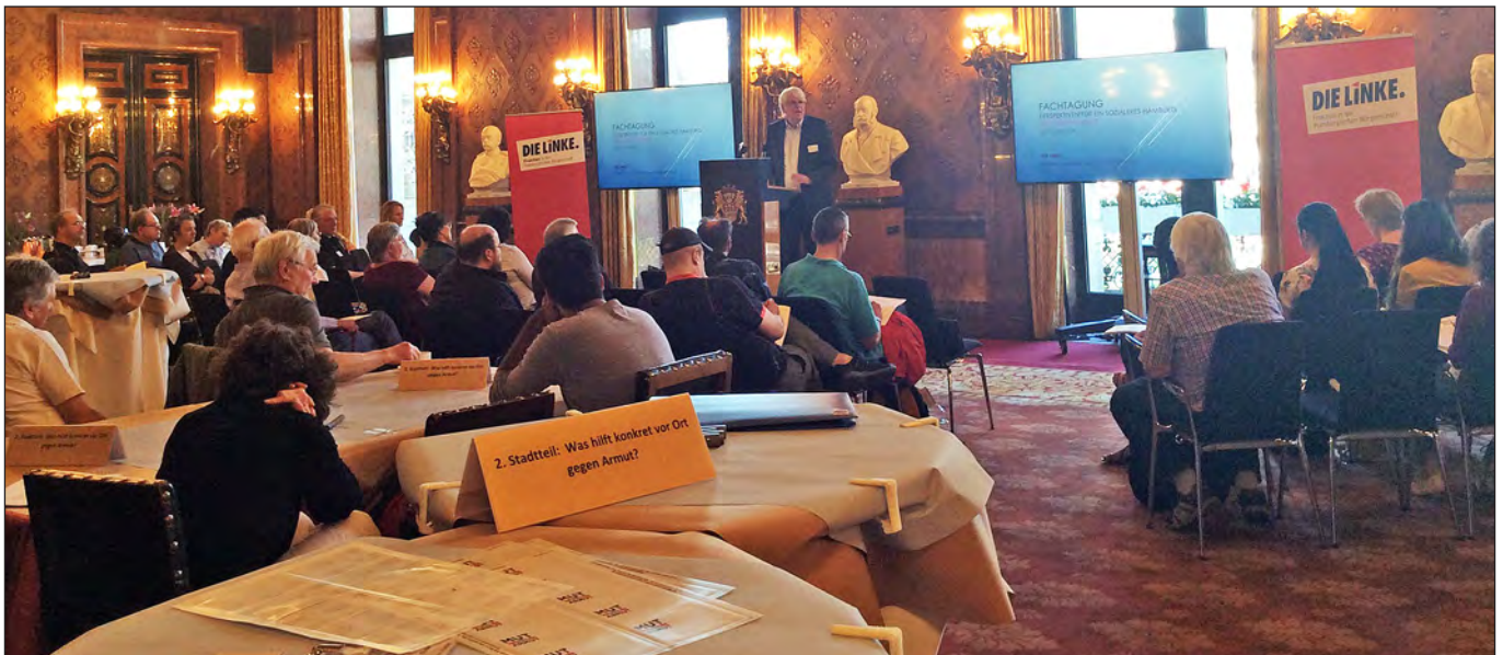
Fachtagung im Rathaus, 23.5.2018

So lautete die Überschrift für eine Veranstaltungsreihe, besser noch: für eine politische Akzentsetzung der Linksfraktion in den vergangenen Monaten. Auf einem Fachtag am 23. Mai im Rathaus wurde diese Kampagne in einer ersten Runde