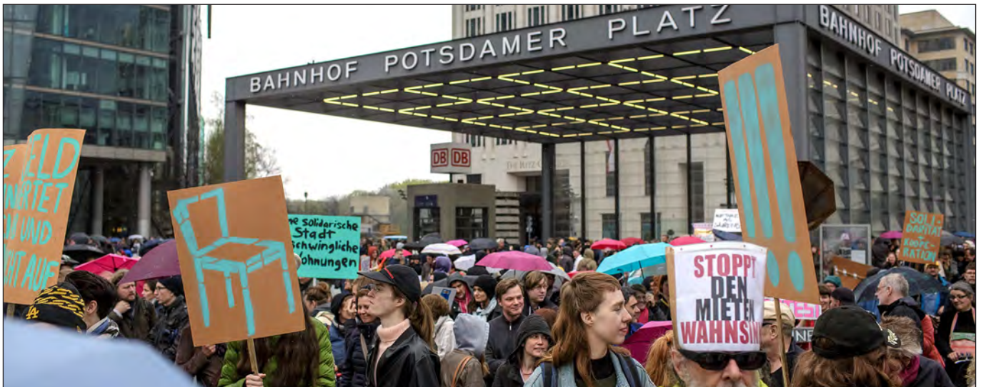
14.4.2018, Mietendemo in Berlin

Große Demonstrationen gegen die Wohnungsnot und die Mietenexplosion hat es in den letzten Wochen u.a. auch in Leipzig, Göttingen und am 14. April in Berlin gegeben. Rund 20.000 Menschen demonstrierten »gegen drastisch steigende Mieten, Verdrängung und knappen Wohnraum« (RBB 24, vom 14.4.2018).