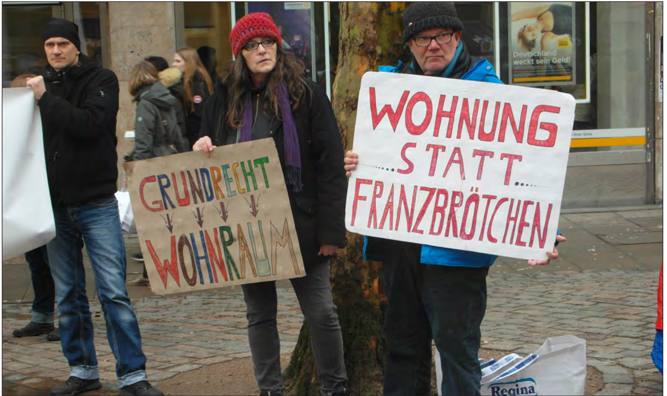
Aktion des Aktionsbündnisses gegen Wohnungsnot am 29.3.2018 auf der Mönckebergstraße