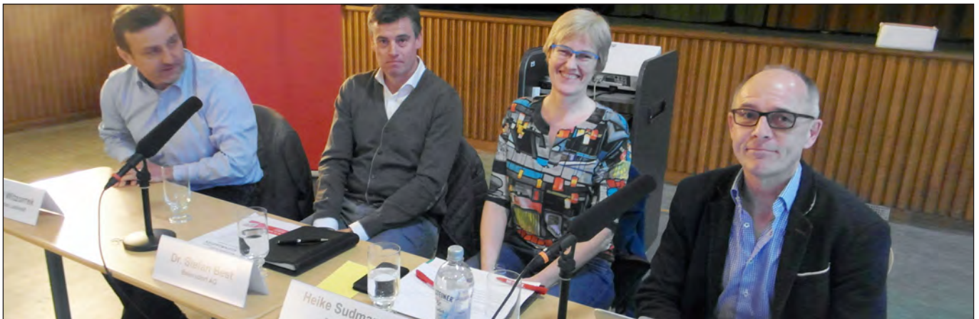
Auf der Beiersdorf-Veranstaltung der Linksfraktion in Lokstedt am 22.4.2018