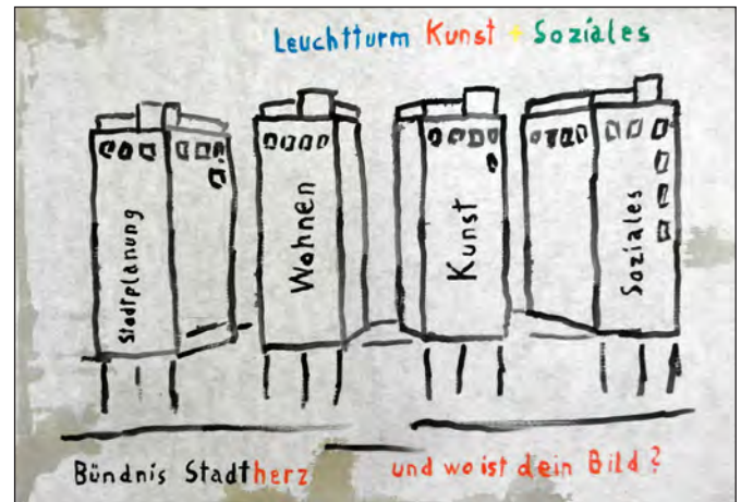
Stadtherz-Ideen zum Cityhof

Dass der Senat es nicht für notwendig gehalten hat, den HIA und die Stellungnahme von ICOMOS zu veröffentlichen,