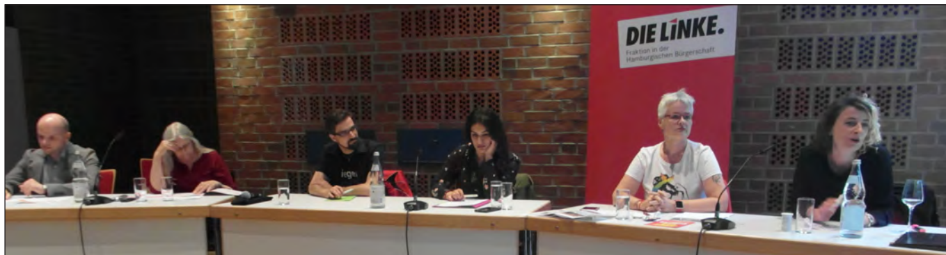
19.6.2018: Podiumsdiskussion zum Jubiläum