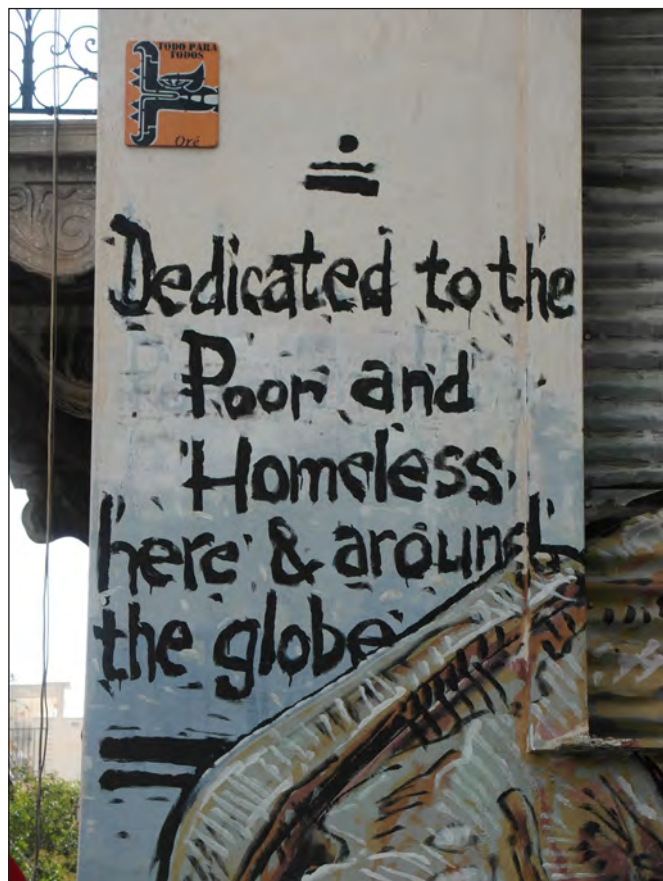
Bekennnis zur globalen Solidarität in Athen, 2017

Wir können nun nach der Vogel-Strauß-Methode den Kopf in den Sand stecken und so tun, als wäre das alles übertriebene Schwarzseherei. Allerdings müssen wir uns dann tagtäglich in die Tasche lügen, um unser Gewissen zu beruhigen. Die Alternative wäre, sich jetzt dafür einzusetzen, dass dieses System dorthin kommt, wo es hingehört: in den Mülleimer der Geschichte. Also sollten wir so schnell wie möglich über ein neues Gesellschaftsmodell diskutieren. Ein System, in dem das Allgemeinwohl zur obersten Handlungsmaxime erklärt wird und das vor allem auch darauf ausgerichtet ist, im Einklang mit der Natur zu stehen.