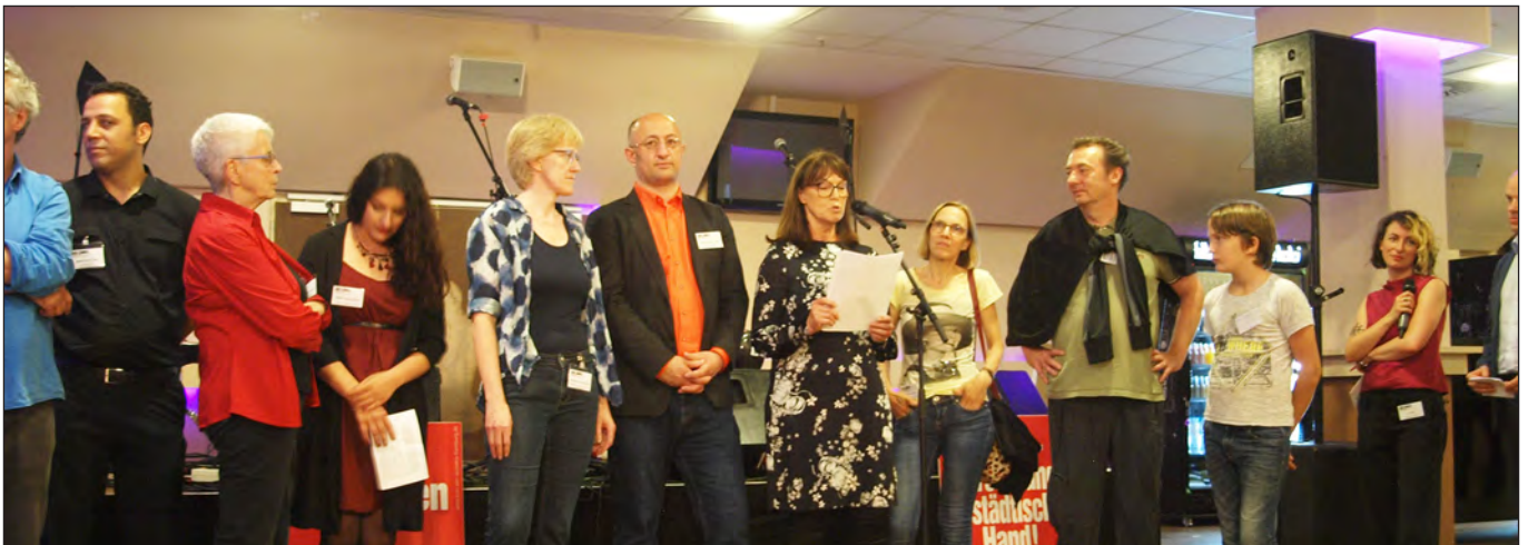
Feier am Millerntor, 2.6.2018

Genau 50.132 Stimmen konnte die am 24. Februar 2008 erstmals zu einer Bürgerschaftswahl in Hamburg angetretene Partei DIE LINKE. erringen. Das waren 6,4% der WählerInnen, die acht Abgeordneten den Sprung ins Parlament ermöglichten. Gebildet worden war DIE LINKE. erst kurz zuvor, nämlich durch den Zusammenschluss der »Linkspartei.PDS« (Partei des Demokratischen Sozialismus) und der WASG (Wahlalternative Arbeit und soziale Gerechtigkeit) am 16. Juni 2007.