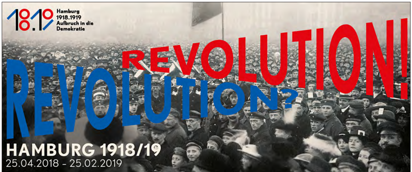
Abbildung: Museum für Hamburgische Geschichte