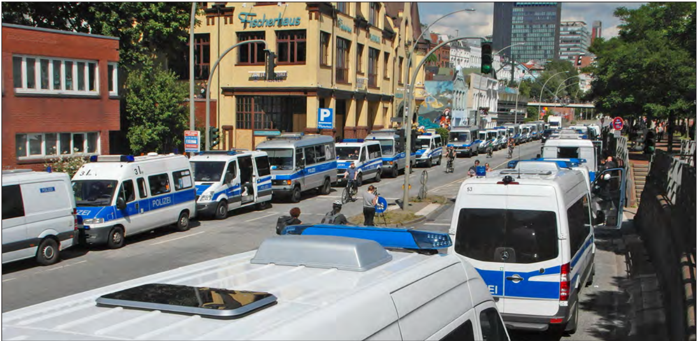
Polizeiwagen kurz vor dem G20-Demo-Einsatz

Nathalie Meyer über Polizeigewalt während des G20-Gipfels und deren Aufarbeitung