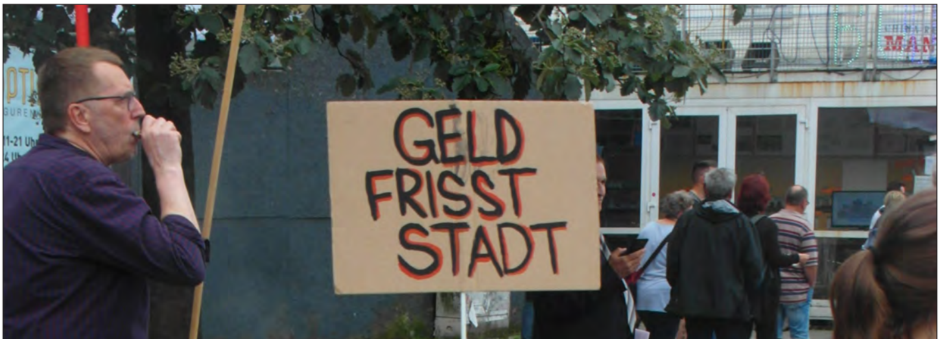
Und dagegen muss protestiert werden!

Heike Sudmann über die Pläne der CDU zum Zuballern der Binnenalster