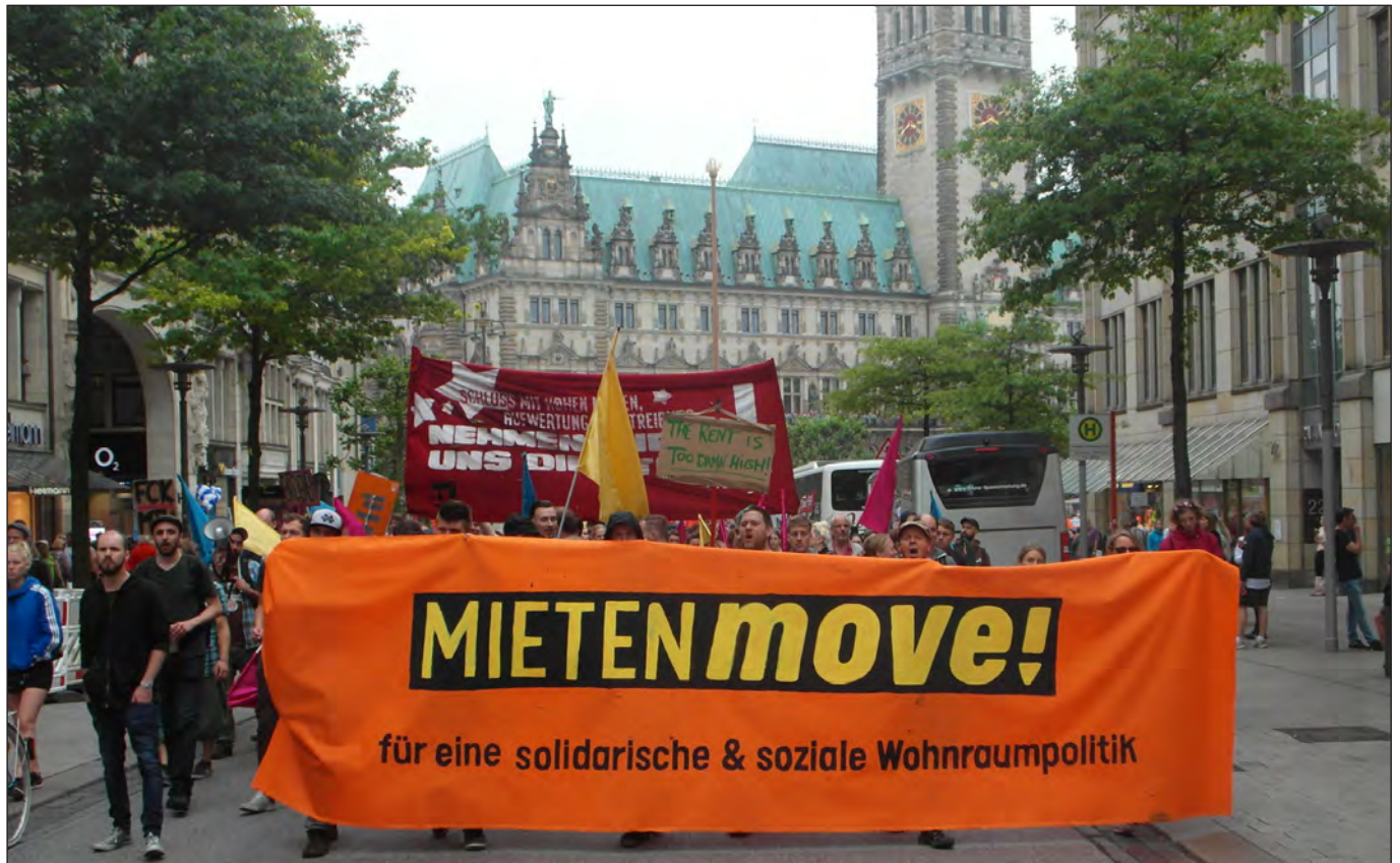
Auf der Mönckebergstraße, 2.6.2018

Es war eine bunte und machtvolle Demonstration, die sich am 2. Juni vom Spielbudenplatz durch die Hamburger City bis zum abrisgefährdeten City-Hof am Klosterwall hinzog.