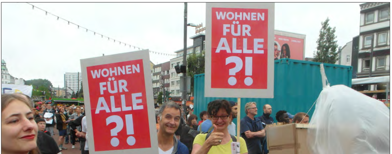
So sollte es sein! Mietenmove, 2.6.2018

Berlin macht's vor: Zu einer neuen wohnungspolitischen Initiative des Senats