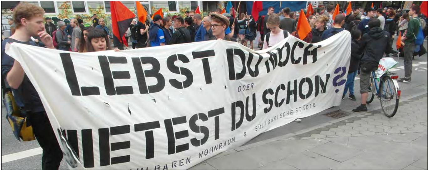
Wohl eher letzteres... Mietenmove, 2.6.2018

Die sogenannte Mietpreisbremse ist am 5. März 2015 im Deutschen Bundestag mit den Stimmen der Regierungskoalition (CDU/CSU, SPD) beschlossen worden und im gesamten Hamburger Stadtgebiet seit dem 1. Juli 2015 in Kraft, allerdings vorerst nur für fünf Jahre. Neumietverträge, die seitdem abgeschlossen wurden bzw. werden, müssen eine Mietobergrenze einhalten. Die zulässige Miete darf die ortsübliche Vergleichsmiete im jeweiligen Rasterfeld des aktuell gültigen Hamburger Mietenspiegels um maximal 10% übersteigen.