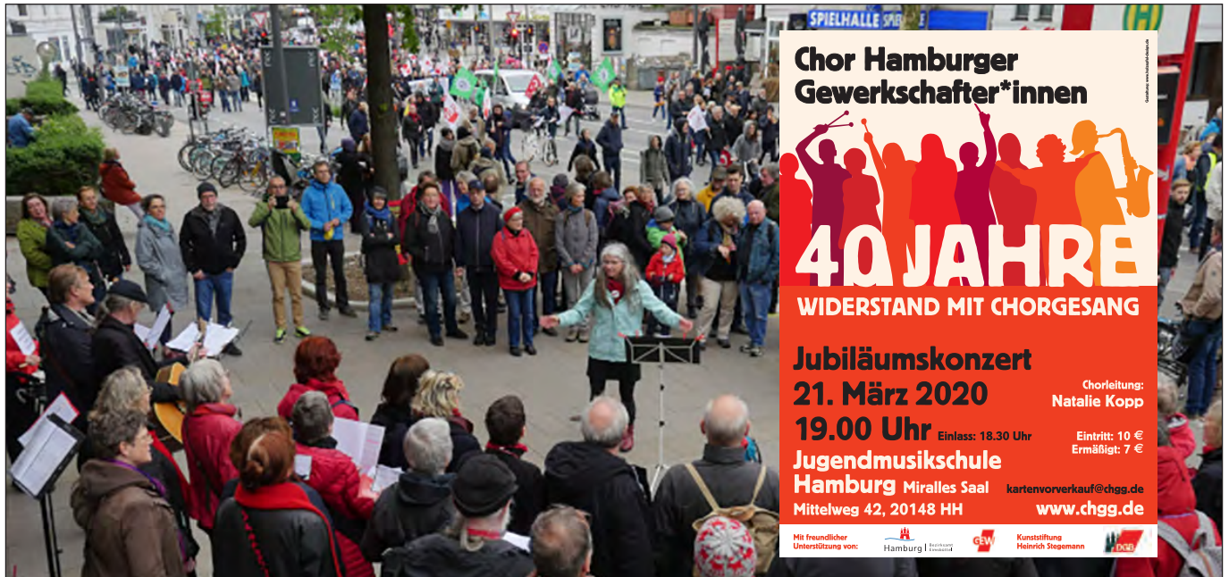
Auftritt am 1. Mai 2019, Eimsbüttel

Die älteste politische Gesangsgruppe ist sicherlich der Chor Hamburger Gewerkschafterinnen und Gewerkschafter. Vielen, sehr vielen LeserInnen des »BürgerInnenbriefes« dürfte er bekannt sein, von dieser oder jener Veranstaltung und insbesondere vom alljährlichen Mai-Umzug des DGB: Irrendwo steht das starke Ensemble am Straßenrand und erfreut die vorbeiziehenden DemonstrantInnen.