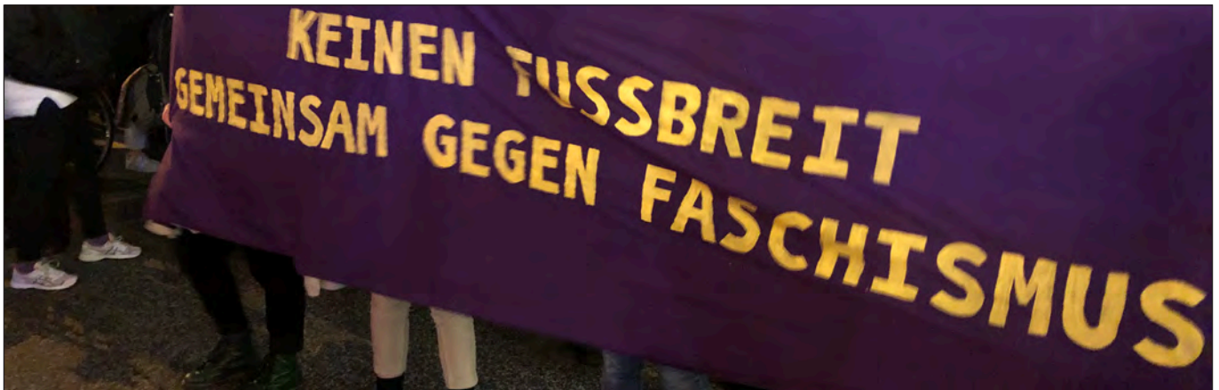
Demonstration nach Thüringen-Desaster, 7.2.2020, Hamburg (Christiane Schneider)

rere Polizeikräfte schwer verletzt worden. Die Einrichtung des Gefahrengebietes im Januar 2014 wurde durch die Polizei mit eben diesem Angriff gerechtfertigt. Der Haken an der Sache: Den Angriff auf die Davidwache hat es so nie gegeben. Mehrere ZeugInnen widerlegten die Version der Polizei, viele der Behauptungen der Polizei waren nicht belastbar. Selbst die Polizei sah sich später gezwungen, ihre Version zu revidieren, wenngleich sie weiterhin daran festhielt, dass es einen linksmotivierten Angriff gegeben habe. Aufgrund der massiven Proteste gegen das Gefahrengebiet wurde es schließlich nach knapp zwei Wochen wieder aufgehoben; das Ermittlungsverfahren wegen des »Angriffs auf die Davidwache« wurde ohne Ergebnis eingestellt.