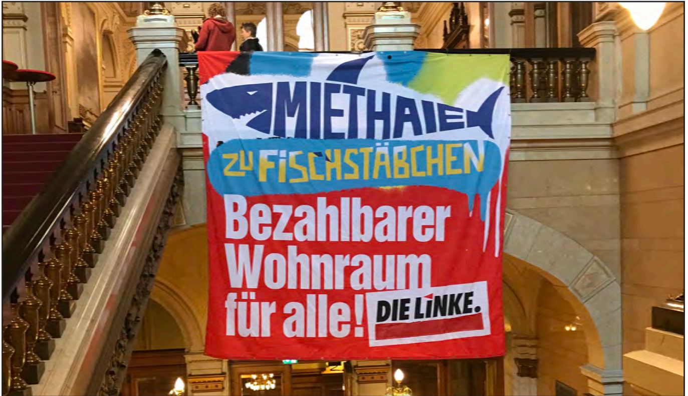
Im Hamburger Rathaus

Heike Sudmann über die prekäre Mieten- und Wohnungssituation in der Stadt