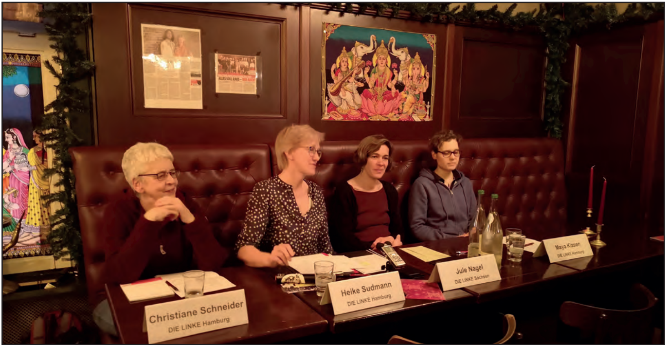
Diskussion über Polizei-Strategien, 5.2.2020