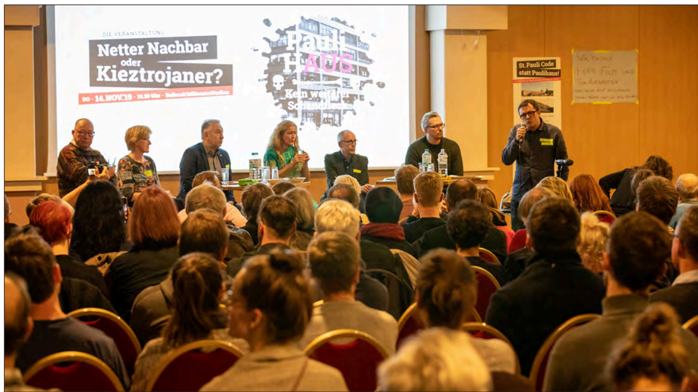
Infoveranstaltung im November 2019

Von der Initiative St. Pauli Code jetzt!