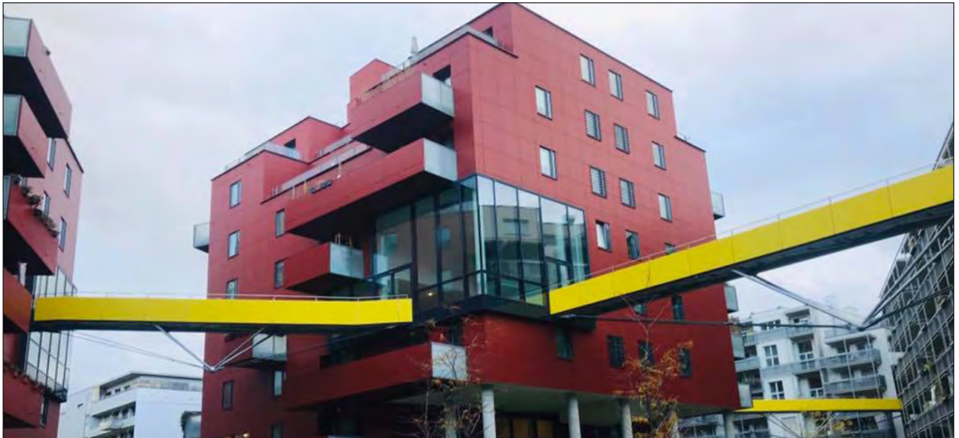
Gemeinde-Neubau in Wien

3. und letzter Teil der Serie, von Florian Kasiske, Mitarbeiter der Linksfraktion