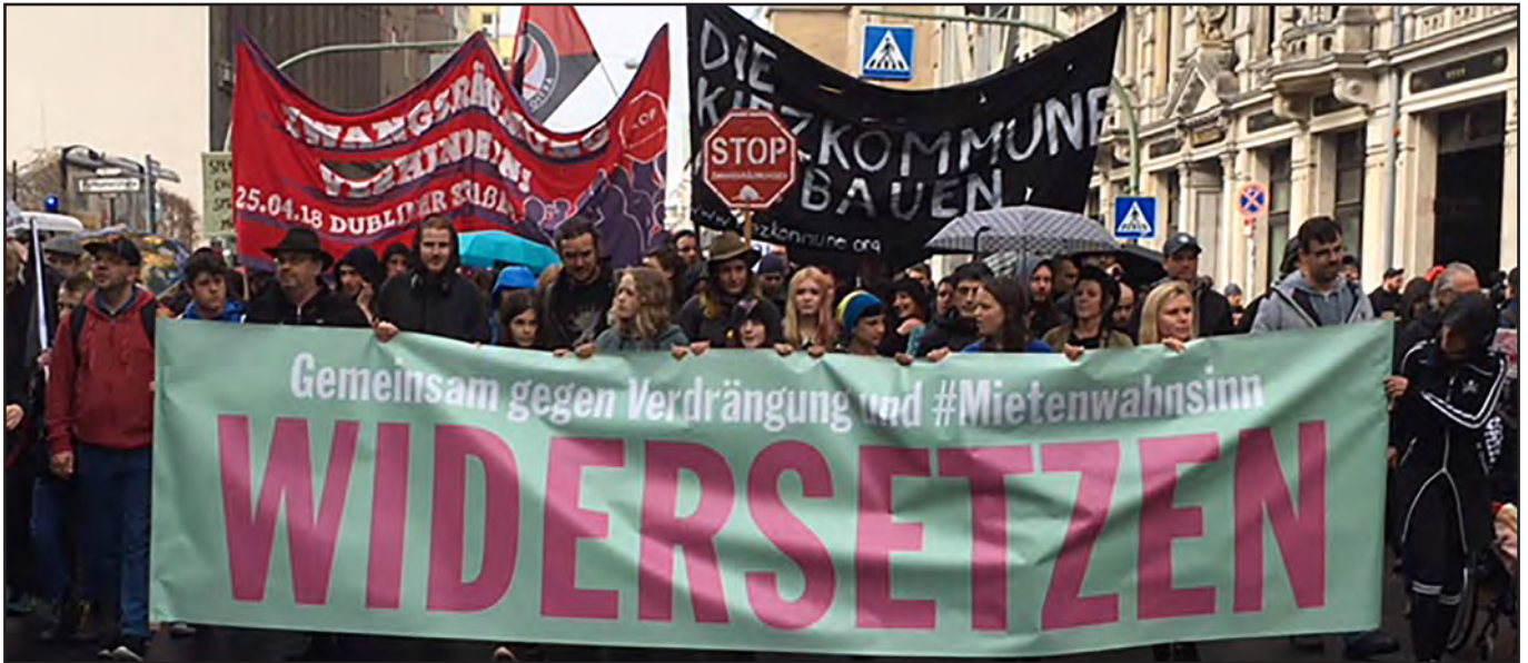
Große Mietendemo in Berlin, April 2018

Ab März 2020 gilt in Berlin der Mietendeckel. Per Gesetz sind Mietsteigerungen verboten. Es werden Obergrenzen für zulässige Miethöhen festgelegt und Modernisierungsumlagen auf einen Euro pro Quadratmeter begrenzt. Ab Jahresende können dann auch überhöhte Mieten im Bestand abgesenkt werden.