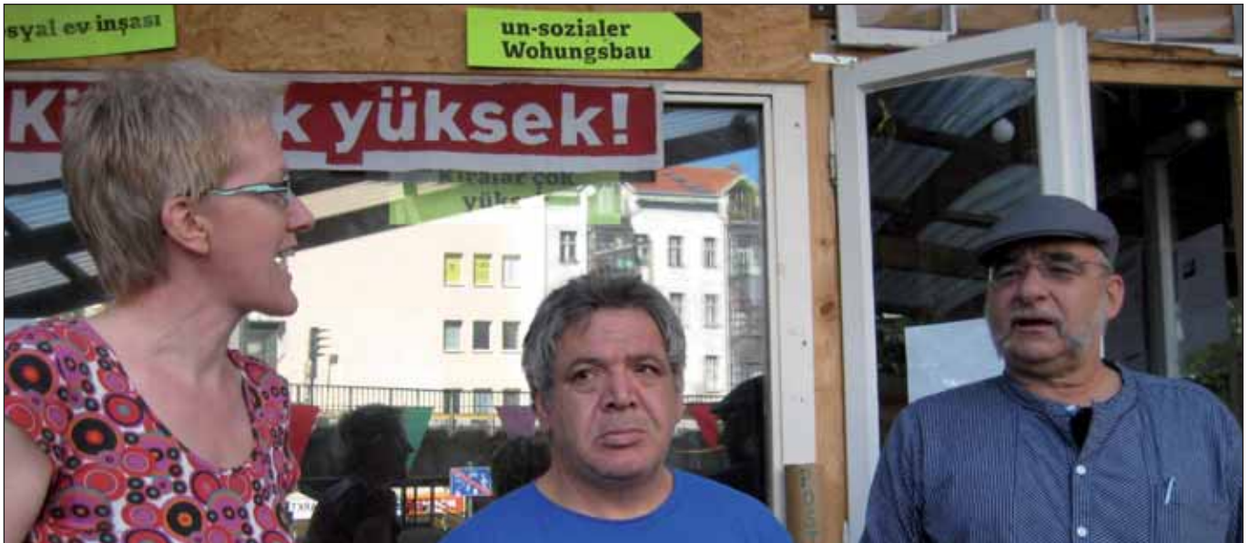
Im Gespräch mit Vertretern von KOTTI