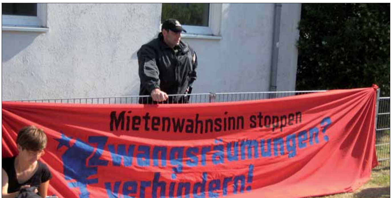
Protest gegen Zwangsräumung in Rönneburg (Michael Joto)

So titelte das »Neue Deutschland« in seiner Ausgabe am 12. Juni und meldete: »In Hamburg organisiert sich eine Protestbewegung gegen Zwangsräumungen«.