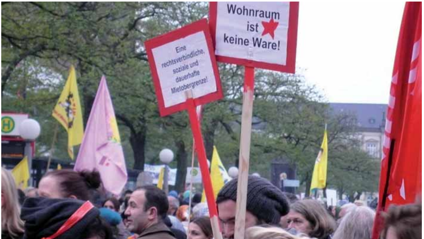
Demo gegen Mietenspiegel, 10.11.2012