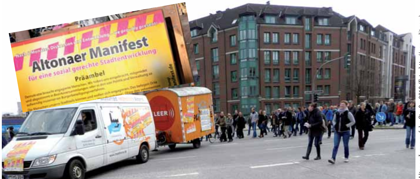
AltonaerInnen auf der Straße, 2013

So hieß es am 20. November, als nach mehrmonatiger Debatte eine Art Grundsatzdokument »Für eine sozial gerechte Stadtentwicklung« veröffentlicht wurde. Im BürgerInnenbrief vom 27. Juni 2013 haben wir schon einmal eine frühere Version aufgenommen, hier nun aber die endgültige und auch als Flyer zirkulierende Fassung. Das »Altonaer Manifest«, dessen zentrale Forderung lautet: »Bürgerwillen verbindlich machen«, ist mittlerweile von 28 Initiativen (darunter die Links-