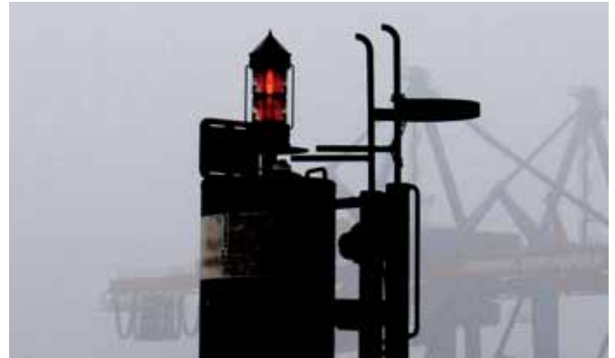
Fehlendes Highlight?