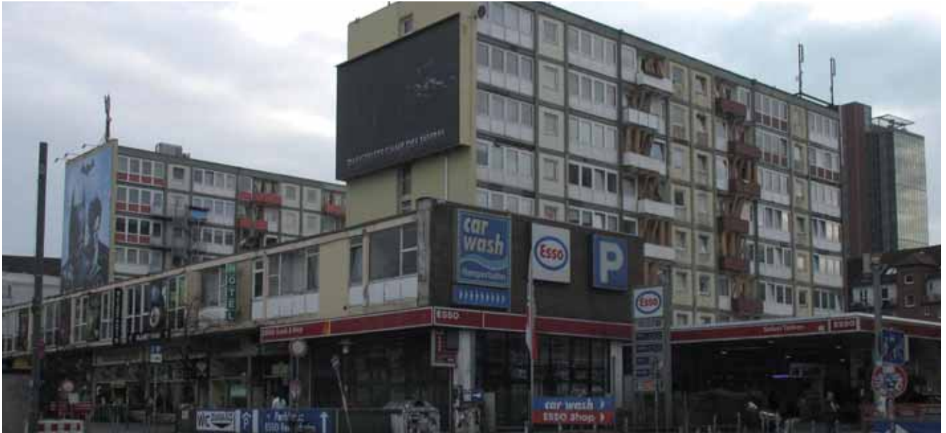
Die ESO-Häuser am Spielbudenplatz, November 2013

Am vergangenen Wochenende wurden die ESSO-Häuser geräumt, weil Erschütterungen in den Gebäuden gemeldet worden waren. Die MieterInnen mussten innerhalb kürzester Zeit die Gebäude verlassen und wurden in einer Turnhalle behelfsmäßig untergebracht. Mit dieser dramatischen Entwicklung hat die Geschichte um die ESSO-Häuser einen weiteren traurigen Höhepunkt erreicht. Die beiden VermieterInnen, erst die Familie Schütze, jetzt die Bayerische Hausbau, haben jahrzehntelang munter die Mieten kassiert, aber nichts für den Erhalt der Gebäude unternommen. In dieser attraktiven Ecke von St. Pauli ist es viel gewinnbringender, auf die Unbewohnbarkeit und den Abriss der Häuser zu spekulieren, als den MieterInnen ein sicheres Dach über den Kopf zu gewähren. Diese unverschämte Spekulation darf jetzt nicht mit einem lukrativen neuen Bebauungsplan für die Bayerische Hausbau belohnt werden.