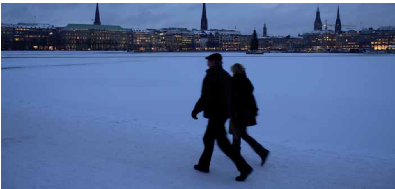
Übers Wasser gehen – auch 2014 mit links!

ein arbeitsreiches Jahr geht dem Ende entgegen, Anlass also, noch einmal kurz zurück, aber auch schon voranzuschauen.