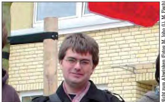
Nicht zum Abwinken

Geschafft – dieser Ausspruch gilt nach dem Wahlsonntag in jeder Hinsicht: