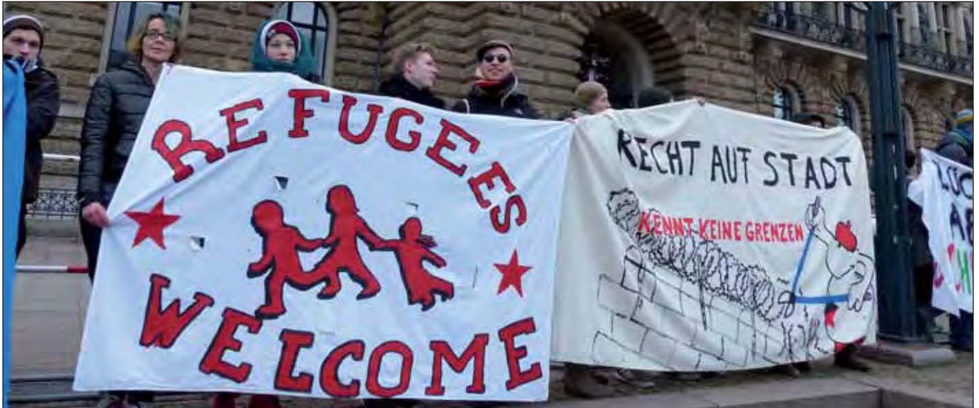
31.1.2015: Auf der Demo »Never mind the papers«

Wahlkampf ist anstrengend, vor allem im Winter. Wahlkampf ist aber vor allem auch eine Zeit, in der man in kürzester Zeit intensiv lernt. Durch den Kontakt zu vielen Bürgerinnen und Bürgern, eher flüchtig am Infostand, intensiver auf zahlreichen Veranstaltungen, und durch die Befassung mit vielen, oft ganz neuen Themen. Meinem Eindruck nach haben in diesem Wahlkampf besonders viele Einrichtungen, Institutionen, Vereine usw. zu Veranstaltungen eingeladen, in denen es oft um spezielle, aber in der Regel wichtige und spannende Probleme ging.