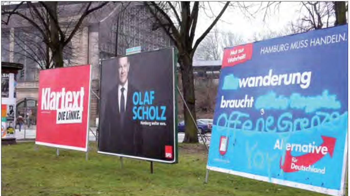
Am 13.2.2015 am Dammtor