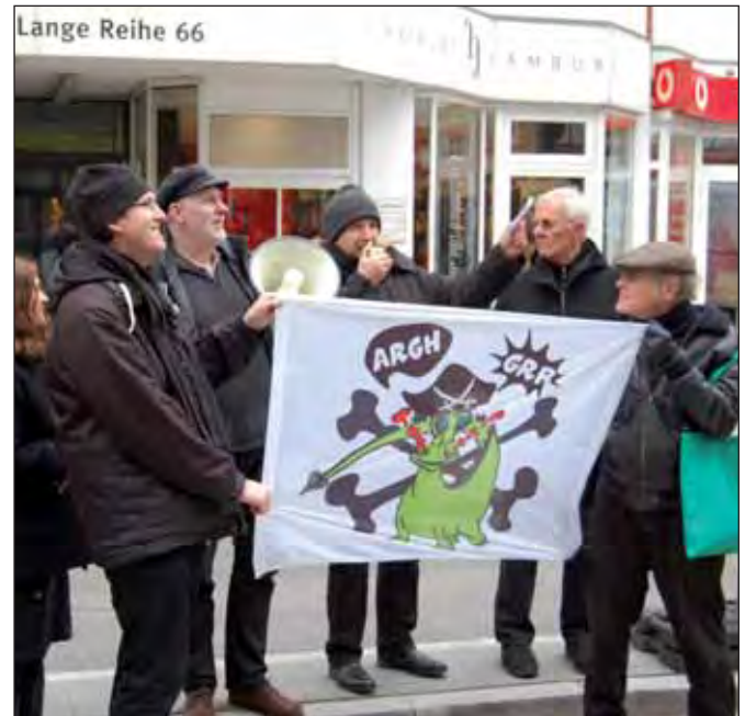
L.: Elisa stirbt (M. Joho), r.: Demo auf der Lange Reihe (D. Prösdorf)

Am Abend des Abrissbeginns fand noch einmal eine Kundgebung der Initiative vor dem Gebäude statt. Wut, Empörung