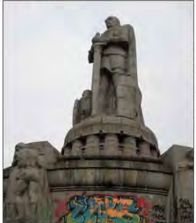
Bismarck und Rosa Luxemburg