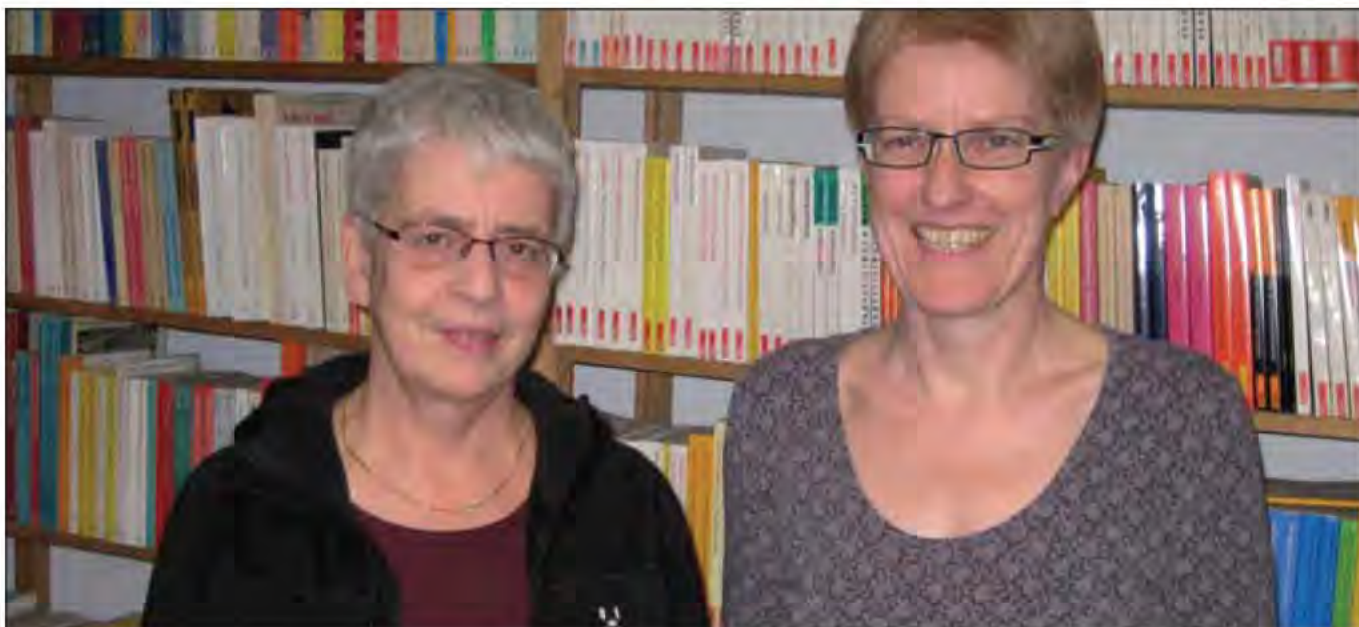
Die neuen Herausgeberinnen des BürgerInnenbriefs