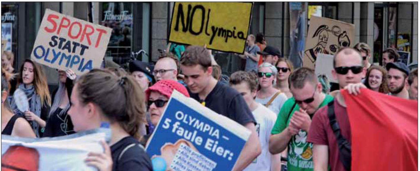
NOlympia-Demo am 4.7.2015