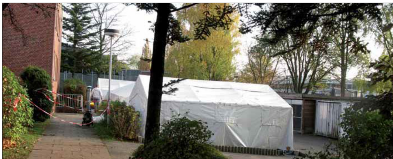
Unterkunft in der Drateinstraße