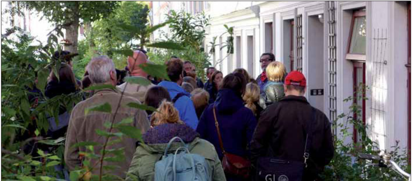
MietinteressentInnen im Falkenried, 2013

Auch wenn wir im »BrgerInnenbrief« wiederholt darauf hingewiesen haben, dass die in Hamburg mit Verzgerung zum 1. Juli 2015 in Kraft getretene Mietpreisbremse wohl eher ein Mietpreisbremschen ist, hat doch der massive Widerstand des Haus- und Grundeigentmerverbandes aufmerken lassen. Offenbar befrchtet dieses Grppchen eine Beschneidung ihrer in den letzten Jahren infolge der Wohnungsnot und des Mietwahnsinns reichlich eingefahrenen Extra-Profiten. Kaum hat dieser Verband grnes Licht gegeben – nicht ohne dem Senat eine baldige berprfung des neuen Gesetzes in Hamburg abzurufen –, wendet er sich gegen den Mieterverein zu Hamburg, der eine kluge und ffentlichkeitswirksame Idee platziert hat: die Online-berprfung der Miethhe. Wir danken dem Mieterverein fr die Erlaubnis, hier seine aktualisierte Pressemitteilung zum Thema aufzunehmen: