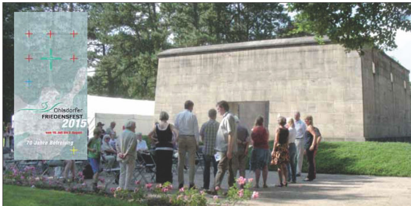
Friedensfest vor dem Mahnmal für die Bombenopfer, 2014 (René Senenko)

Zum siebten Mal finden in diesem Jahr, vom 18. Juli bis zum 2. August , auf dem Ohlsdorfer Friedhof zahlreiche öffentliche Veranstaltungen statt. Dass die Termine in den Sommerferien liegen, erklärt sich aus dem Gedenken an die Nächte des Hamburger Feuersturms vor 72 Jahren. Damals erlebte die Hamburger Bevölkerung eine unvorstellbare Kriegshölle. Um daran zu erinnern, dass diese für die Hansestadt bisher größte Katastrophe eine Folge der nationalsozialistischen Herrschaft war, und auch um die Befreiung vom Nationalsozialismus zu feiern, wird auf dem Ohlsdorfer Friedhof ein Friedensfest begangen. Gleichzeitig, so heißt es im Veranstaltungsfaltblatt, »werden dabei neue Formen des angemessenen Gedenkens gesucht und erprobt, denn die Spanne, in der Zeitzeugen und Zeitzeuginnen persönlich erzählen können, geht zu Ende« ( www.friedhof-hamburg.de/fileadmin/Dateien/bilder/veranstaltungen/pdf/Flyer_Friedensfest_2015.pdf ).