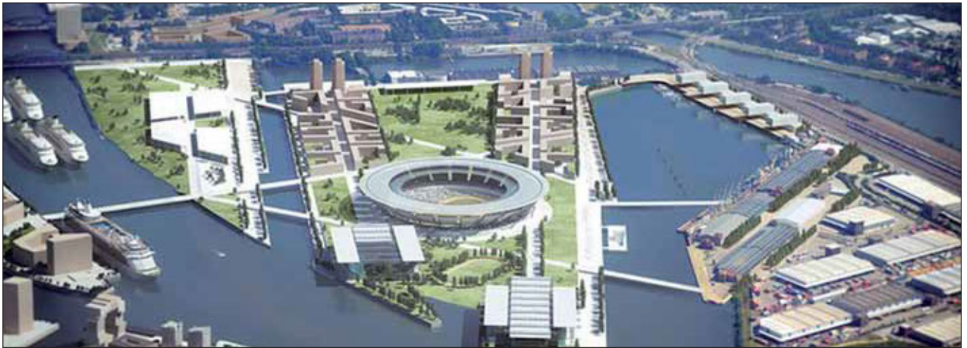
Kleiner Grasbrook in der Zukunftsvision

Wie würde der Olympia-Zuschlag Hamburg sozial und städtebaulich verändern? Das waren die beiden Fragen, die die Gewerkschaftslinker bei einem Jour-Fixe am 1. Juli aufgeworfen hatte. Lassen wir uns einmal auf dieses kleine Gedankenexperiment ein, denn noch ist ja alles offen mit der hamburgischen Olympia-Bewerbung, die Entscheidung fällt schließlich erst per Referendum am 29. November 2015. Bis dahin gilt es die Mehrheit zu gewinnen, so hat es jedenfalls den Anschein, angesichts der uns geradezu überrollenden Kampagne von Senat, Abendblatt, HVV, Sportverbänden etc. Doch die Ablehnungsfront verbreitert sich und erstreckt sich mittlerweile von der zentralen NOlympia-Bewegung über DIE LINKE und den AstA bis hin zu den ersten Stadtteilinitiativen auf der Veddel und in St. Georg; zwei Demonstrationen in Wilhelmsburg und St. Georg haben stattgefunden, eine Volksinitiative ist auf den Weg gebracht.