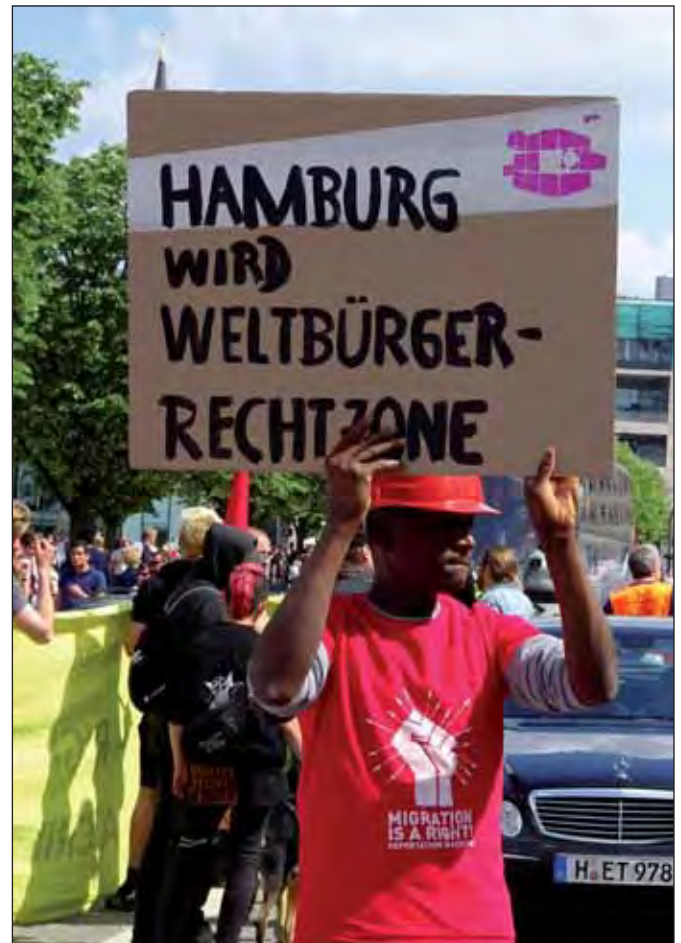
Auf der Parade am 28.5.2016

PRO ASYL, der Rat für Migration, die Diakonie, der Paritätische und über 100 WissenschaftlerInnen kritisierten das Integrationsgesetz in einem » Brandbrief an die Bundesregierung « massiv und bezeichneten es als integrationsverhindernd. Die Wohnraumzuweisung widerspreche den Erkenntnissen der Migrationsforschung, missachte das Frei-