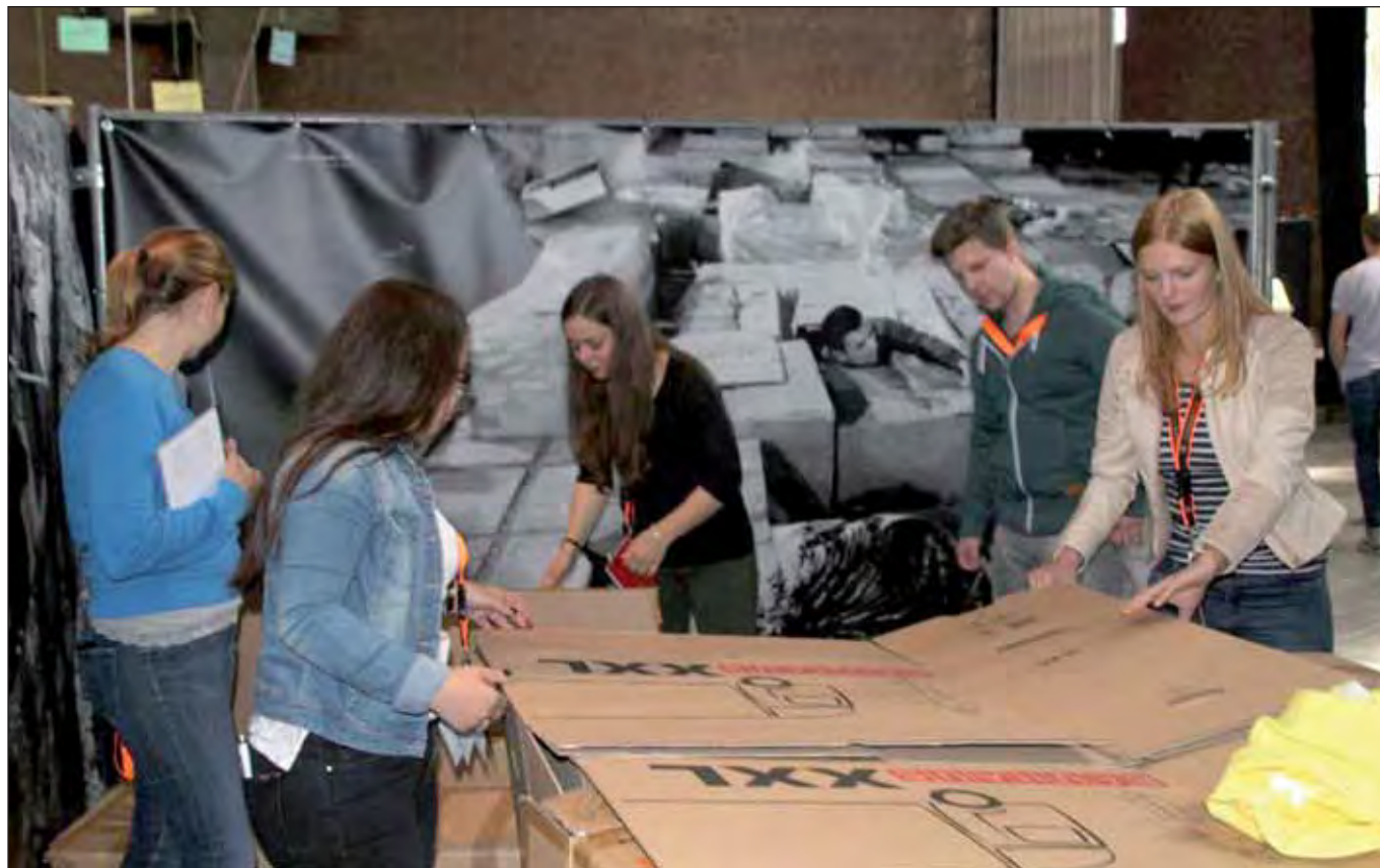
Ausstellungsbesucherinnen bauen eine Notunterkunft

Über Migration und Flucht, den Umstand, dass gegenwärtig 60 Millionen Menschen ihre Heimat verlassen haben, um an anderem Orte überleben zu können und eine Zukunftschance zu erheischen, darüber sprechen wir in den letzten Monaten allerorten. Manchmal erreichen einen dann die Bilder von einzelnen Menschen, von Opfern, wie dem kleinen Jungen, der tot an den Mittelmeer-Strand gespült wurde. Um diese individuellen Beweggründe und Biografien, um die Empathie für menschliches Leid und das Ringen um Würde geht es in einer interaktiven Ausstellung, die im Leo-Lippmann-Saal der Finanzbehörde (Gänsemarkt 36) vom 27. Juni bis zum 14. Juli zu sehen ist.