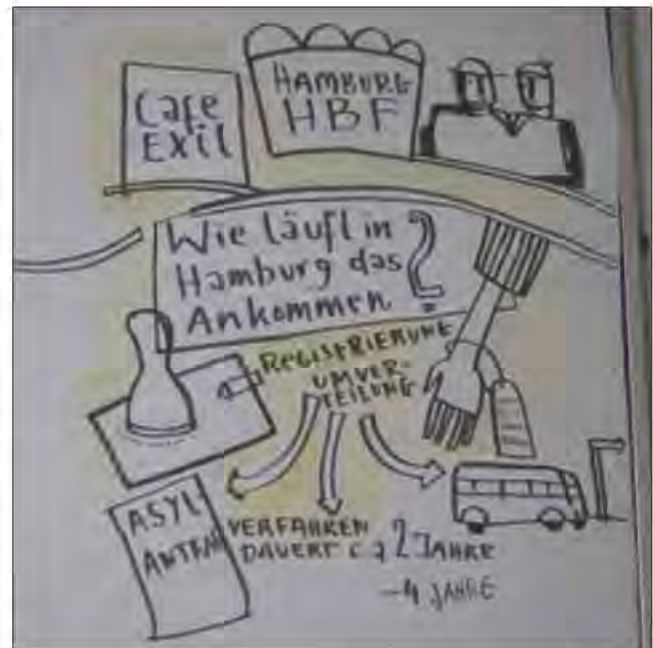
Grafik von E. Ehniger, Ankommenstadt-Tagung, Dezember 2015

Wir rufen die Hamburger Stadtteil- und Flüchtlingsinitiativen auf, sich unserer Bewegung anzuschließen und unsere gemeinsame Stimme in Hamburg unüberhörbar zu machen.