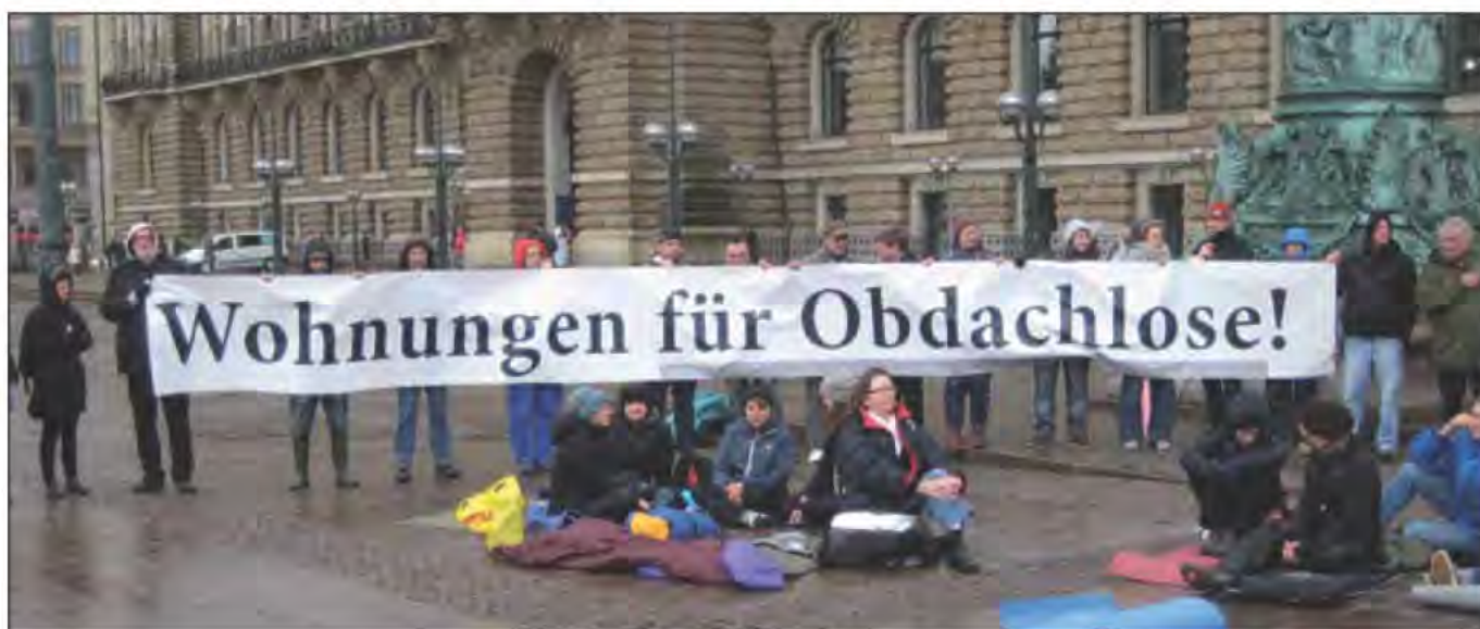
Für soziale Stadtentwicklung

Am 20. Mai stellte die Linksfraktion ein Sofortprogramm vor, das es vom Grundgedanken wie auch von den einzelnen Posten her wert wäre, stärker in der Öffentlichkeit diskutiert zu werden. Hintergrund ist der Umstand, dass Hamburg in diesem Jahr mit zusätzlichen Steuereinnahmen von ca. 478 Mio. Euro rechnen kann, die vergleichsweise gute Wirtschaftsentwicklung in Deutschland macht's möglich. 160 Mio. Euro will der Senat für die Unterbringung und Integration der Flüchtlinge investieren, ein Vorhaben, das die LINKE selbstverständlich unterstützt.