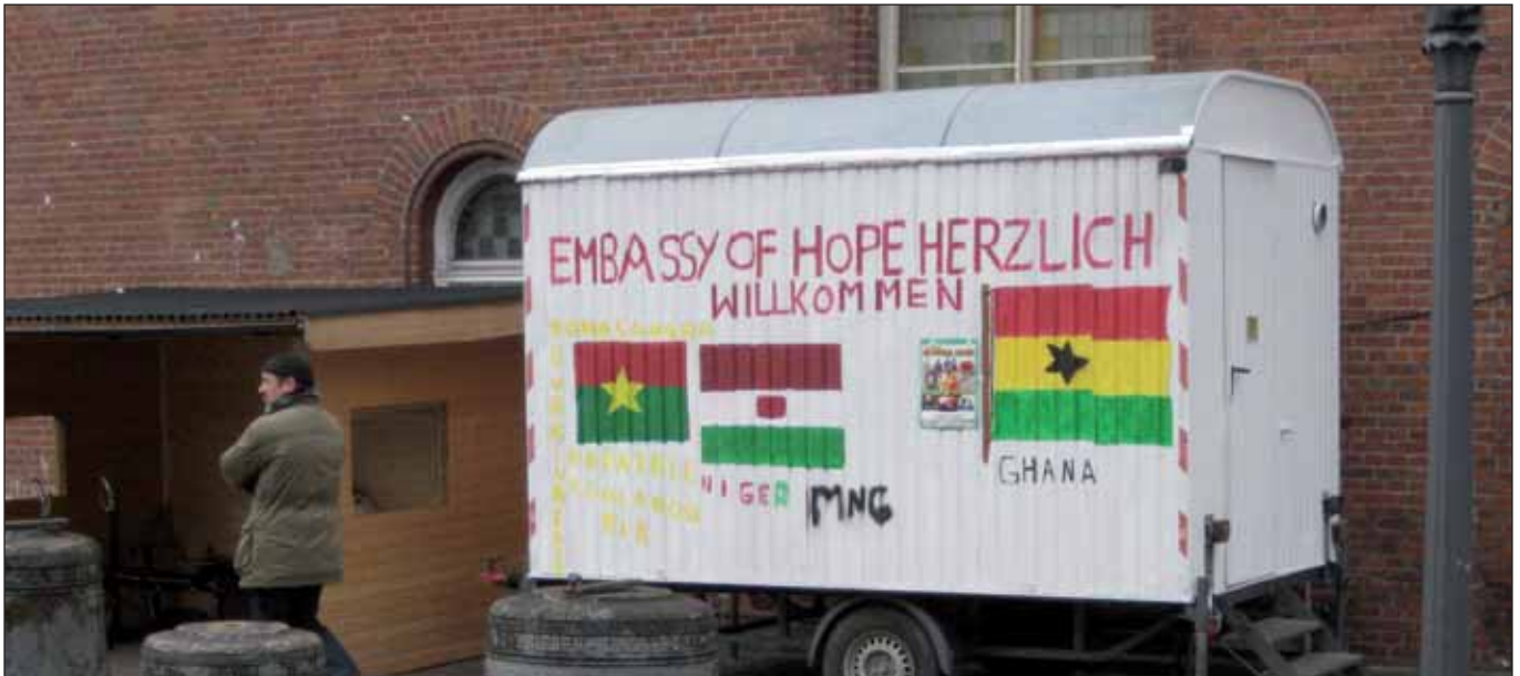
Beim Park Fiction

Tausende Hamburger FlüchtlingshelferInnen übernahmen im Sommer 2015 das Ruder, um die wachsende Zahl der in Hamburg ankommenden Flüchtlinge zu begrüßen, zu begleiten und mit dem Notwendigsten auszustatten. Die Stadt war nicht nur überfordert, sie verschloss die Augen auch vor den so genannten Durchreisenden, die sich in Dänemark oder Schweden mehr Perspektiven des Verbleibens erhofften. Durchreisende, so die Argumentation des Senats über viele Wochen, seien eben auch nur Reisende, und für die trage die Deutsche Bahn die Verantwortung, mit dem Ergebnis, dass unterm Strich für diesen Personenkreis gar nichts passierte.