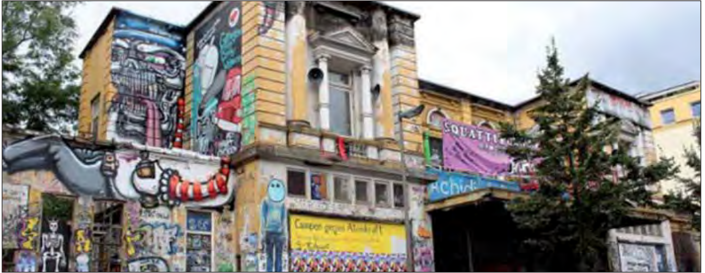
Rote Flora vor der Renovierung