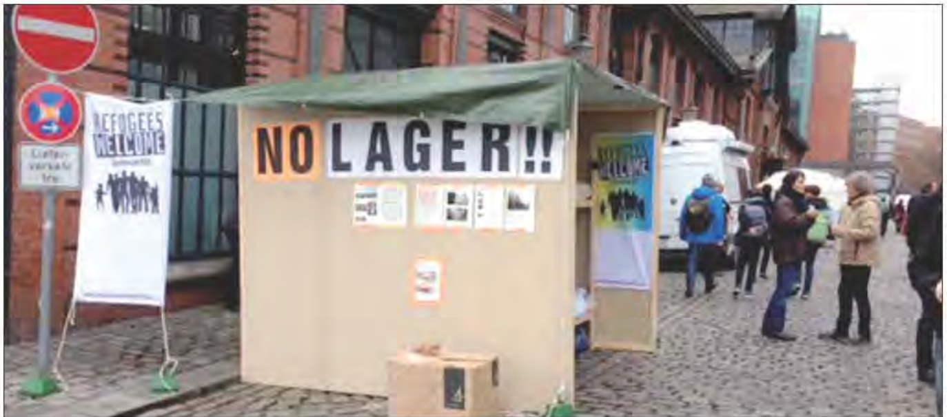
Am Tag der Parade, 28.5.2016

raum nutzbar zu machen? Es fehlt an Konzepten für nachhaltiges, bezahlbares Bauen, an Ideen, mitten in der Stadt gemeinsam das Zusammenleben zu planen. So wurde ein Vorschlag der Architektenkammer, die Messe an den Stadtrand zu verlegen und auf dem Areal Wohnen und Leben neu zu planen, begeistert aufgenommen.