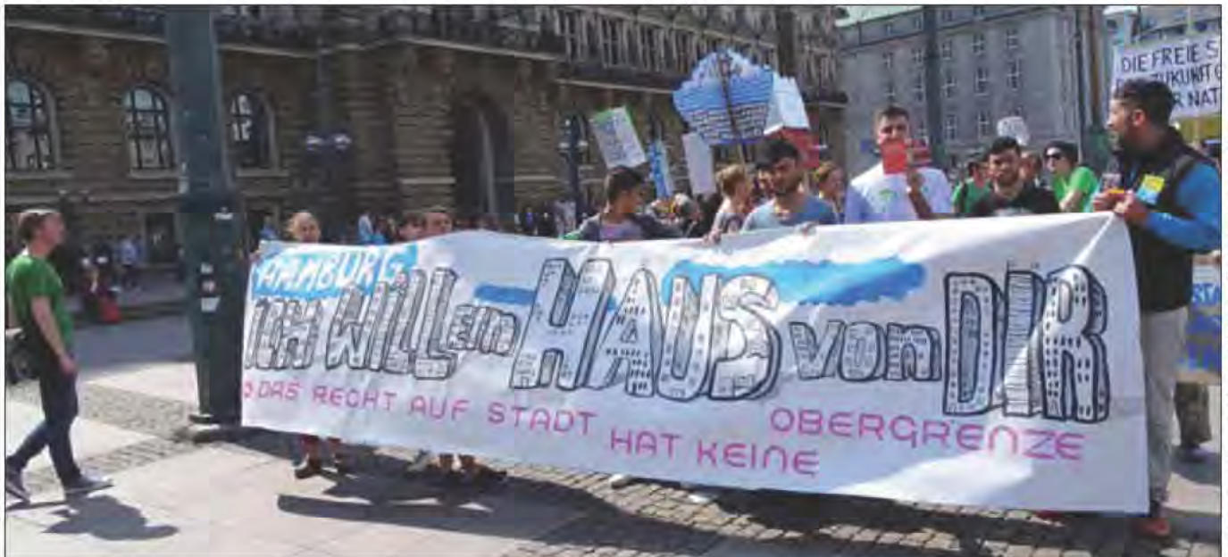
Auf der Parade am 28.5.2016