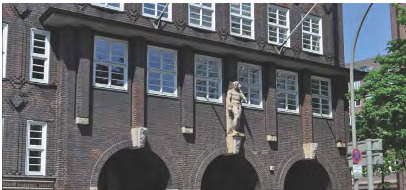
Hamburger Innenbehörde

Am 13. Juni veröffentlichte die Hamburgische Innenbehörde den Verfassungsschutzbericht 2015. Wer dieses Schauspiel seit Jahren verfolgt, ist geneigt zu sagen, dass es jedes Jahr wieder eine inhaltlich zähe, ritualisierte Prozedur ist, die dort aufgeführt wird. Aber einige wenige Nachrichten sind auch in diesem Jahr dabei, die es hervorzuheben gilt: