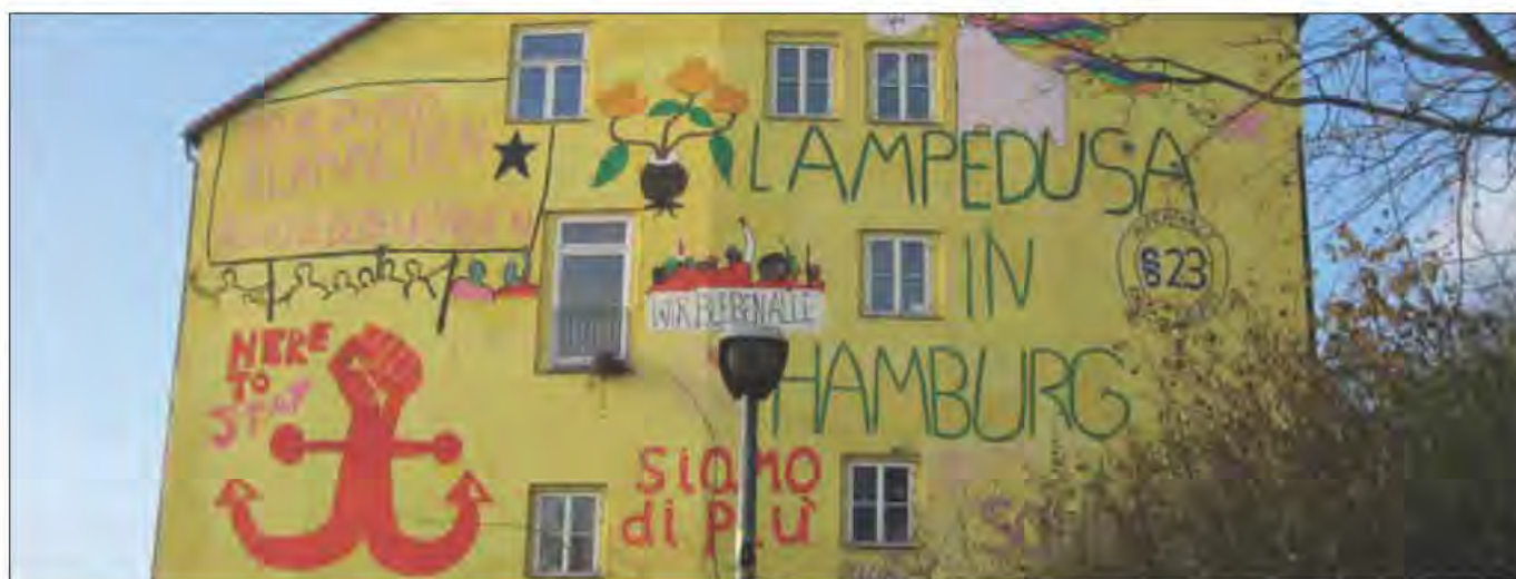
Hert to stay!

Surya Stülpe zum Integrationsgesetz als Integrationsverhinderung von oben