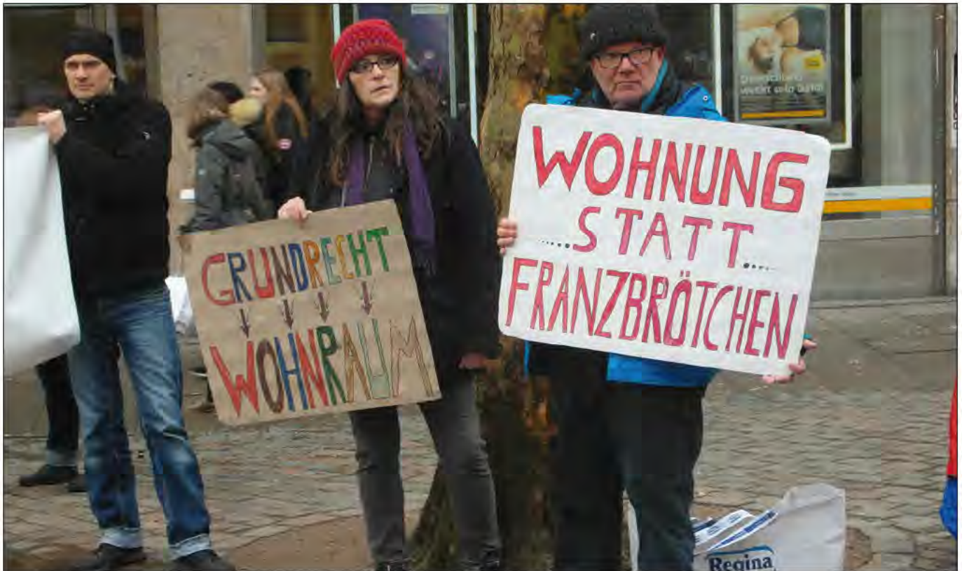
Aktion des Aktionsbündnisses gegen Wohnungsnot am 29.3.2018 auf der Mönckebergstraße