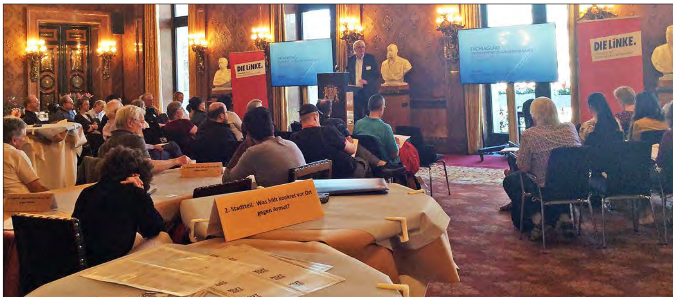
Fachtagung im Rathaus, 23.5.2018

So lautete die Überschrift für eine Veranstaltungsreihe, besser noch: für eine politische Akzentsetzung der Linksfraktion in den vergangenen Monaten. Auf einem Fachtag am 23. Mai im Rathaus wurde diese Kampagne in einer ersten Runde