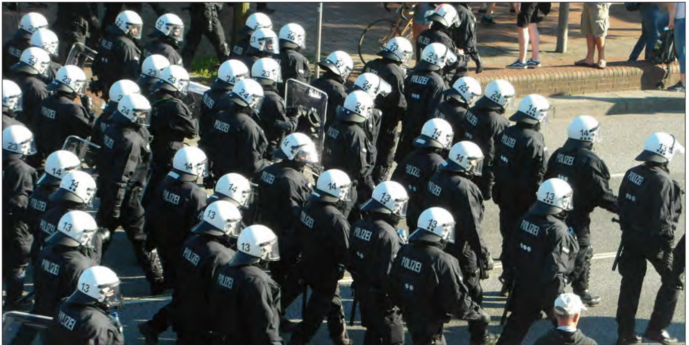
Erst vermurmt und dann eine fragwürdige Massenfahndung