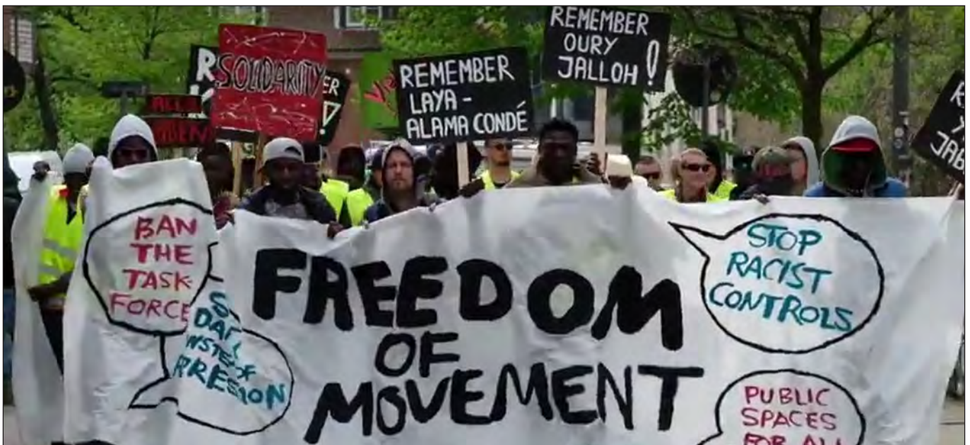
Demo gegen auf St. Pauli am 28.4.2018