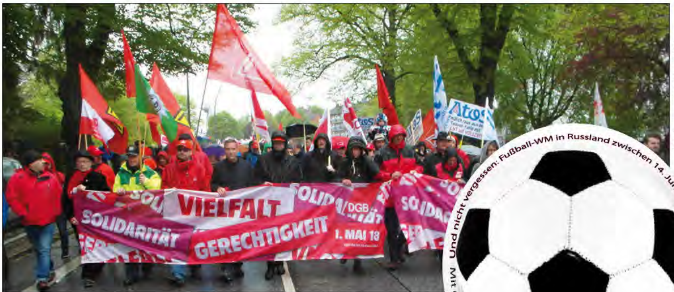
DCB-Demo am 1. Mai 2018

den heißen Tagen im Mai folgen in den kommenden Wochen und Monaten gleich mehrere heiße Aktionen, der Sommer soll zeigen, was Hamburgs alternative und linke Szene zu bieten hat. Am Samstag, den 2. Juni , wird der Reigen mit einem großen MIETENmove! eröffnet. Tausende HamburgerInnen werden sich um 13.00 Uhr auf dem Spielbudenplatz treffen, um »Gemeinsam für eine andere Wohnraumpolitik« zu demonstrieren. Ein Jahr nach dem famosen G20-Gipfel in Hamburg wird es verschiedene Veranstaltungen und andere Initiativen geben, darunter vom 5. bis 8. Juli ein Festival der grenzenlosen Solidarität , mit Workshops, Aktionen, einem Rave und einer Demonstration. Und am Samstag, den 29. September , wird Hamburg zum Schauplatz einer bundesweiten antirassistischen Parade unter der Parole United Against Racism .