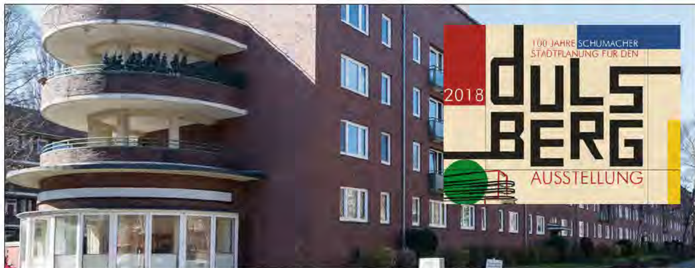
Foto: Laubergan ghaus Oberschlesische Straße 11

»Dunkelroter Backstein, Reformwohnungsbau, vielfältige Grün- und Freiraumstrukturen – als Stadterweiterungsgebiet der 1920er Jahre stellt die Hamburger Wohnsiedlung Dulsberg eine wichtige Zeitschicht der europäischen Stadt dar. Vorausgegangen war ein im Jahr 1918 nach modernsten Kriterien reformierter Bebauungsplan des damaligen Oberbaudirektors Fritz Schumacher« ( https://dulsberg-denkmalschutz.de/2018/05/17/der-stadtteil-dulsberg-feiert-100-jahre-schumacher-stadtplanung-fuer-den-dulsberg-in-jubilaeumswochen-vom-3-6-bis-1-9-2018/ ). Mit diesen Worten wird ein Stadtteil beschrieben, der in den kommenden Monaten verstärkt in der Öffentlichkeit wahrgenommen wird.