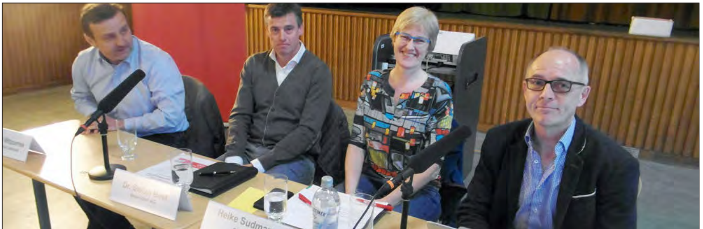
Auf der Beiersdorf-Veranstaltung der Linksfraktion in Lokstedt am 22.4.2018