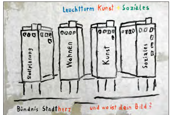
Stadtherz-Ideen zum Cityhof

Dass der Senat es nicht für notwendig gehalten hat, den HIA und die Stellungnahme von ICOMOS zu veröffentlichen,