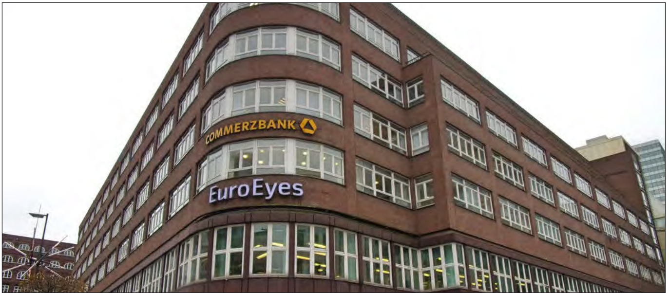
Deutschlandhaus von Drehbahn/Dammthorstraße aus