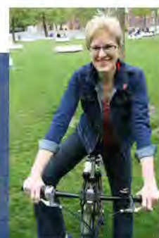
Hochhäuser am Petershof in Neugraben-Fischbek, 8.6.2013

Die Teilnahme ist kostenlos. Für Erfrischungen und Stärkung zwischendurch ist gesorgt.