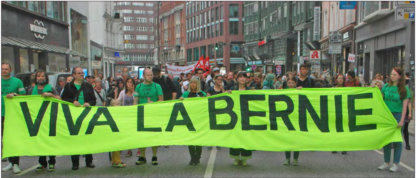
Die Ini in der Innenstadt, September 2018

Forderungen der Initiative rund um die Bernstorffstraße 117