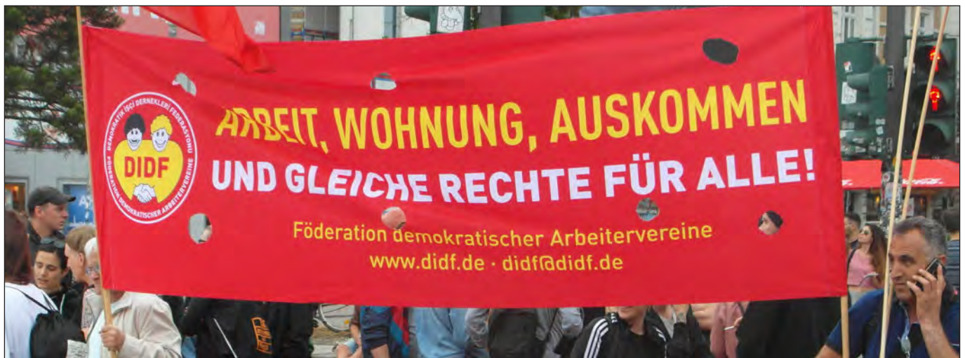
Mietenmove 2018