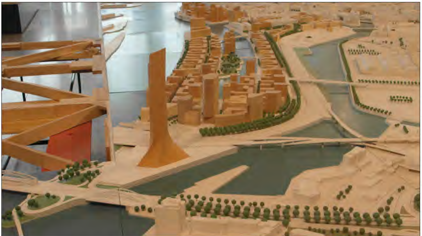
Hamburger Stadtentwicklungsmodell

Unter diesem Motto hat das JournalistInnenkollektiv Correctiv im vergangenen halben Jahr investigative Recherchen angestellt, um den Eigentumsverhältnissen hinsichtlich des Grund und Bodens und der Wohnhäuser in Hamburg auf die Spur zu kommen. Wie im Kapitalismus kaum anders zu erwarten, ist alles, was mit Eigentum zusammenhängt, wie unter einer Käseglocke verborgen. Es könnte sich ja ergeben, dass mit