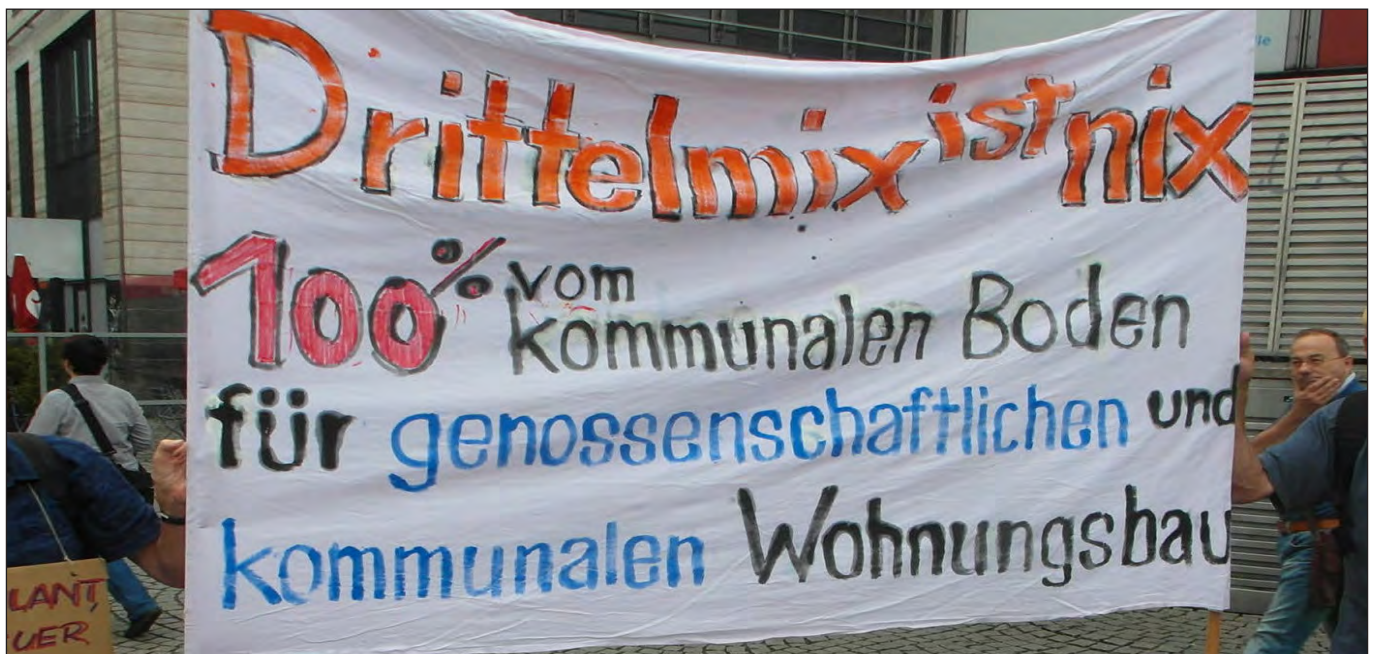
Mietenmove 2018

An ihren Taten sollt ihr sie messen, manchmal reicht es aber auch schon, einige Worte in Erinnerung zu rufen, um auf Lügen, Verdrehungen, Kaschierungen oder eben auf die wahren Verhältnisse aufmerksam zu machen. Wir erlauben uns daher, einige Zitate zusammenzustellen, die gleißende Lichter auf die Wohnungs- und Mietenpolitik in Hamburg werfen.