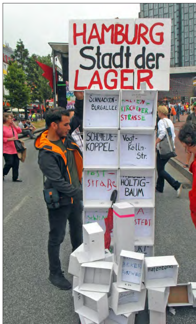
Mietenmove 2018

Anders als vom Bundesinnenminister Horst Seehofer für AnkER-Zentren (d.h. »Zentren für Ankunft, Entscheidung, Rückführung«) gefordert, sind in Hamburg nicht alle am Asylverfahren beteiligten Institutionen im Ankunftszentrum zentralisiert. Begriffliche Feinheiten können aber nicht darüber hinwegtäuschen, dass das hamburgische Ankunftszentrum die Funktion eines AnkER-Zentrums auf ganzer Linie erfüllt – Ankommen, Entscheiden, Rückführen. Die gesamte Umstrukturierung des Ankunftszentrums ist auf das Ziel ausgerichtet, bestimmte Personengruppen zur »freiwilligen« Ausreise zu bewegen oder sie ansonsten schnell und effizient abschieben zu können. Die Anforderungen an eine an den Bedürfnissen der Geflüchteten orientierte Unterbringung und eine humane und an den Menschenrechten ausgerichtete Migrationspolitik bleiben hingegen auf der Strecke. Die Politik des Hamburger Senates bettet sich damit nahtlos in den bundespolitischen Diskurs zur Verschärfung des Asyl- und Aufenthaltsrechts ein und trägt ihren Anteil zur menschenverachtenden Abschottungspolitik gegen Geflüchtete bei.