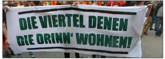
Mietenmove 2018