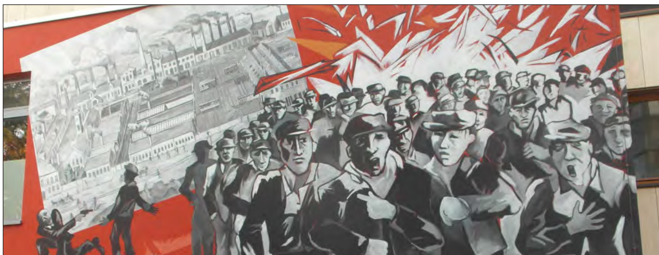
Erinnerung an den Arbeiterstreik bei den Lauensteinischen Waggonfabriken in Hammerbrook 1869

das Jahr neigt sich unwiderruflich dem Ende zu, Zeit also, Zwischenbilanz zu ziehen und einen Blick nach vorn zu wagen.