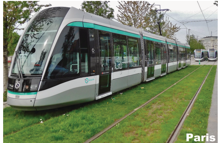
Paris macht es vor. So könnte auch die Hamburger Stadtbahn aussehen.

Mit 60 Tausend Fahrgästen täglich ist die Metro-Buslinie 5 an ihrer Kapazitätsgrenze. Eine moderne, innovative Stadtbahn befördert ein Vielfaches an Personen, ist mit wesentlich geringerem Aufwand und schneller gebaut als eine U-Bahn. Und sie kann mit Ökostrom betrieben werden. Die Stadtbahn ist der schnellste, wirtschaftlichste und umweltverträglichste Weg zu attraktiver Mobilität in Hamburg.