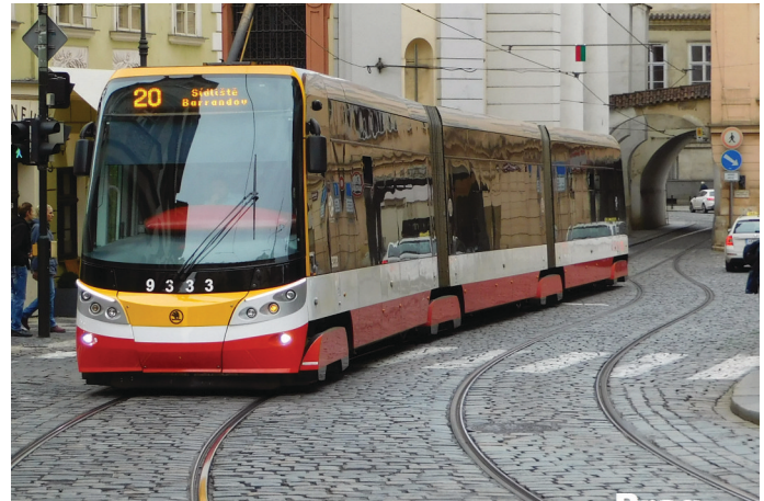
Prag macht es vor. Hamburg ist nicht "zu eng" (Bürgermeister Tschentscher) für die Stadtbahn.

Werden für die Stadtbahn schon vorhandene vierspurige Straßen genutzt, lassen sich neue Strecken deutlich schneller realisieren als mit der U-Bahn (Wahlprogramm DIE LINKE).