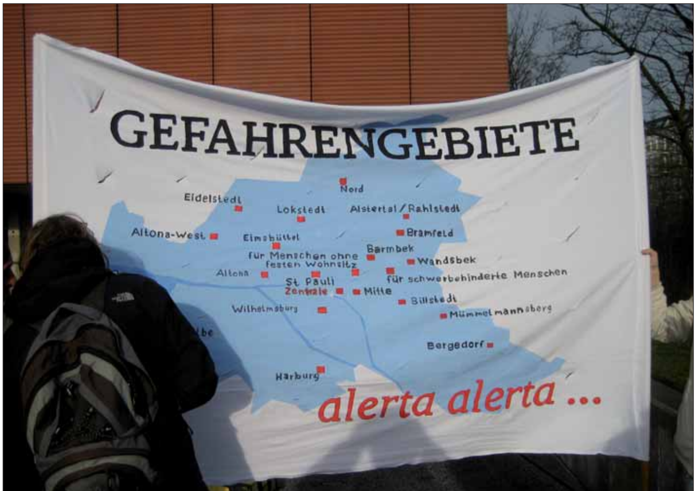
Demo gegen Gefahrengebiete Anfang 2014