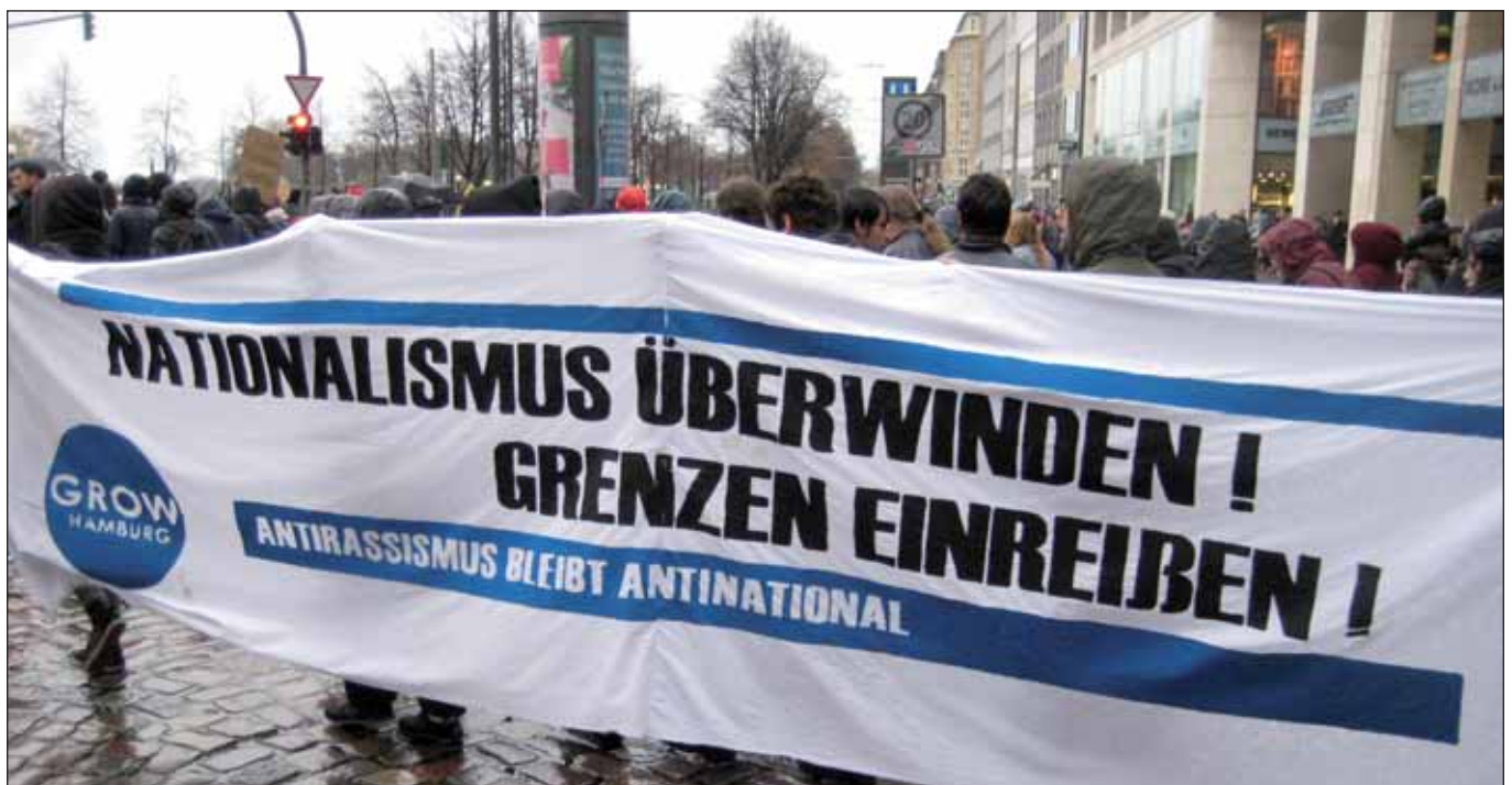
Refugee-Welcome-Demo am 14. November 2015