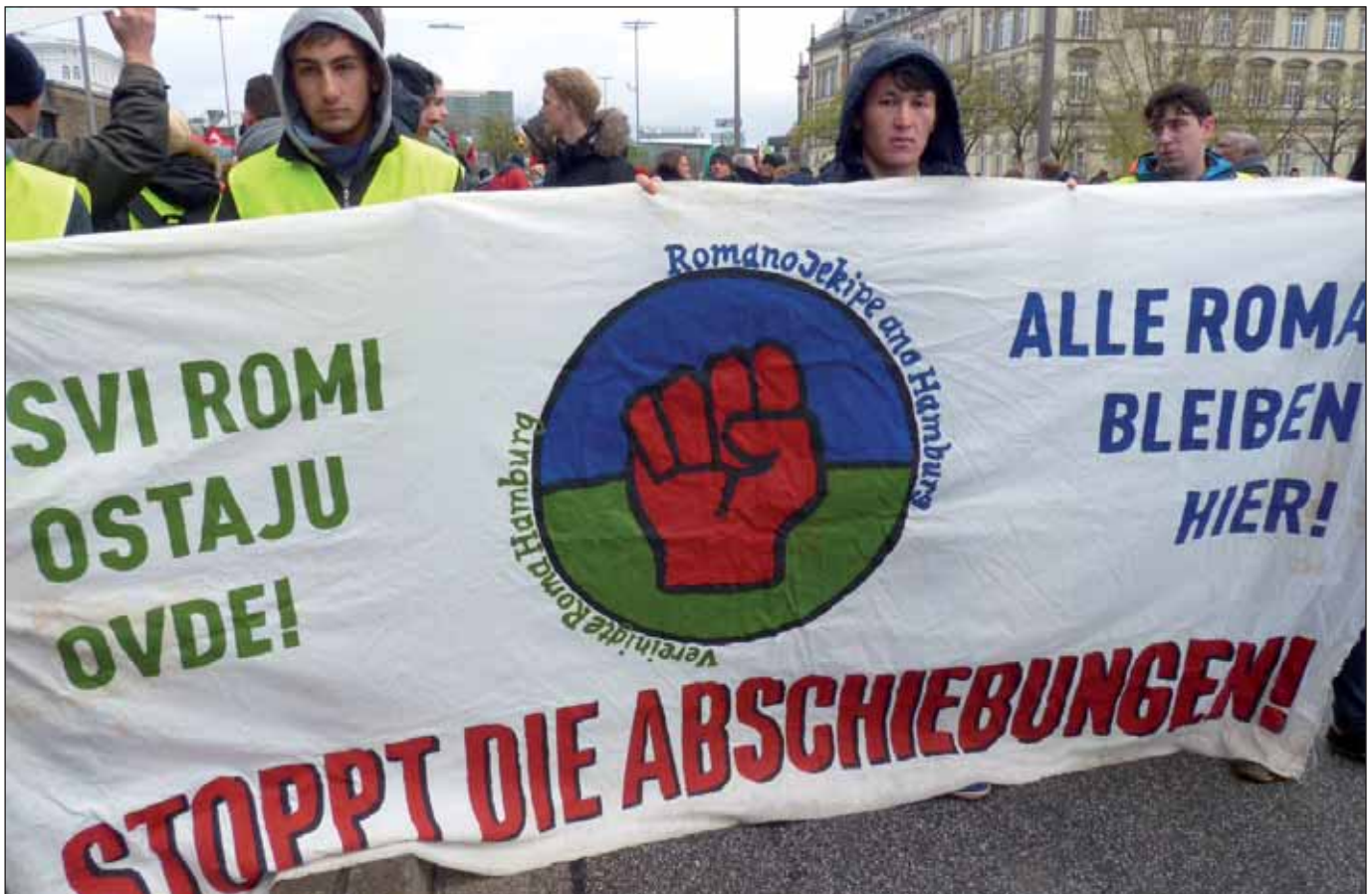
Transparent von Romano Jekipe auf der Demo am 14.11. in Hamburg

Schon bisher hatten Roma aus den Westbalkan-Staaten in Deutschland – anders als in skandinavischen Ländern z.B. – kaum die Chance, als Schutzsuchende anerkannt zu werden. Doch mit der gesetzlichen Festschreibung der Westbalkan-Staaten Serbien, Bosnien-Herzegowina, Montenegro, Kosovo, Mazedonien und Albanien als »sichere Herkunftsländer« hat sich ihre Situation noch einmal verschärft. Diese Festschreibung richtet sich vor allem gegen Roma. Sie verweigert ihnen faktisch das Recht, die Gründe, aus denen sie Schutz suchen, überhaupt angemessen darzulegen. Damit wird ihnen die Möglichkeit geraubt, einen solchen Status zu erhalten. Die Zahl der Abschiebungen steigt, Sammelabschiebungen sind inzwischen an der Tagesordnung.