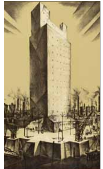
V.l.n.r.: Werke von P. Bialobrzeski, Max Gerntke, Karl Gröning

Politik, Kultur und Gesellschaft in der Metropole zu gestalten, setzt eine immer wiederkehrende, aber auch immer neu daher kommende Beschäftigung mit dem Thema Stadt voraus. »Stadtluft macht frei nach Jahr und Tag«, hieß es im Mittelalter, »Stadtluft macht krank« im 19. und vor allem im 20. Jahrhundert. Die Recht-auf-Stadt-Bewegung proklamiert das Recht und den Zugang für alle in der ganzen Stadt, vor allem auch zu den immer mehr auf Verdrängung und Segregation abzielenden Citys. »In was für einer Stadt wollen wir leben?« – wie viele Konferenzen und Debatten haben sich dieser Fragestellung schon gewidmet? Auch zwei zurzeit in Hamburg laufende, sehr unterschiedliche Ausstellungen sind der Stadt gewidmet – ihrer Ästhetik, aber auch dem Moloch.