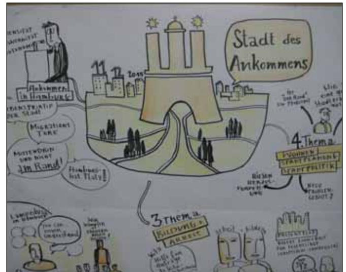
Visualisierung: Elke Ehninger

Für das sich an diesem Tag abzeichnende hamburgweite Willkommensbündnis fängt die Arbeit gerade erst an. Die auf der Tagung vorgelegte Erklärung soll dafür als Grundlage der weiteren Diskussion dienen, ebenso das von uns getroffene