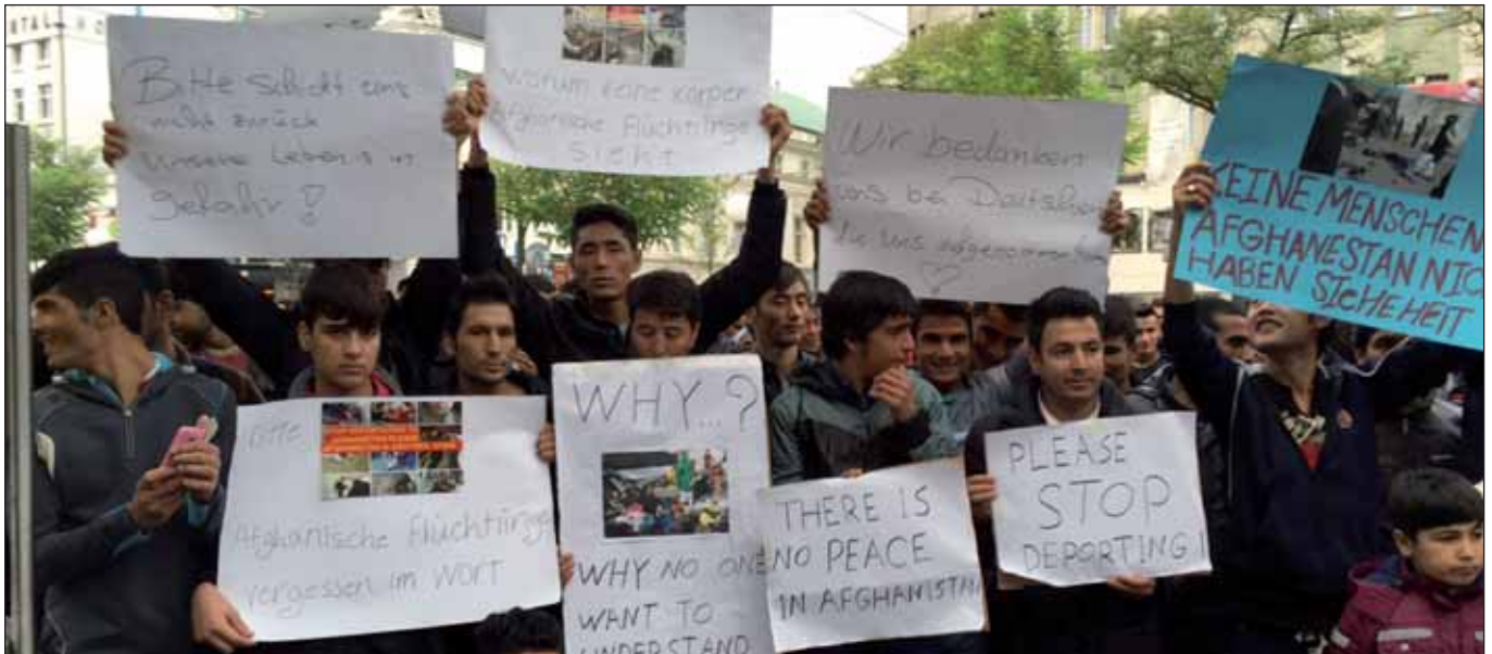
Am 7.11. vor dem Hauptbahnhof

Dass Anträge auf einen Winterabschiebestopp in Hamburg abgelehnt werden, hat schon eine lange Tradition. Dass die Aussichten auf Verabschiedung eines solchen Antrags nicht leichter werden, wenn die GRÜNEN Regierungsverantwortung tragen, war zu erwarten. Erschwerend kommt hinzu, dass die beiden Bundesländer, die im letzten Winter einen Abschiebestopp verhängt hatten, Schleswig-Holstein und Thüringen, in diesem Jahr davon Abstand genommen hatten. Soweit wir wissen, hatte sich die rot-rot-grüne Landesregierung in Thüringen nicht darauf verständigen können, weil es im Land eine starke rechte Mobilisierung und großen Druck aus den Landkreisen gibt, die ihre Wirkung auf einige an der Regierung Beteiligte nicht verfehlt hat. Das ist sehr bedauerlich, kann uns in Hamburg aber, da war sich die Fraktion einig, nicht binden und nicht daran hindern einzufordern, was wir für eine humanitäre Selbstverständlichkeit halten: Niemand, und schon gar nicht besonders schutzbedürftige Menschen wie Familien mit Kindern, Schwangere, Alte, Kranke, in Kälte und Not abzuschicken. Deshalb hatten wir für die Bürgerschaftssitzung am 9./10. Dezember einen Antrag zum Winterabschiebestopp eingebracht.