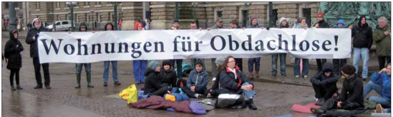
Im April 2015 vor dem Rathaus (M. Joho)

Von Antje Schellner, Mitarbeiterin der Bürgerschaftsfraktion DIE LINKE