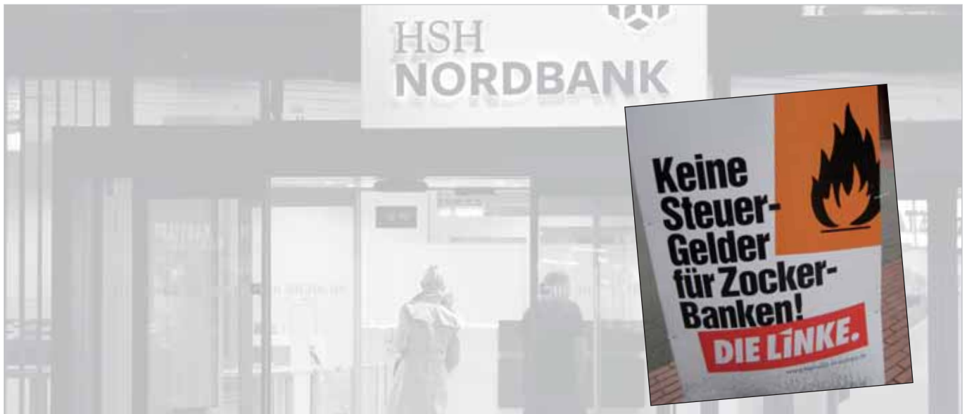
Wohl ein frommer Wunsch im Fall HSH...

Das milliardenteure Drama um die HSH Nordbank neigt sich dem Ende zu. Weder die eigenen Finanzen noch die europäische Bankenaufsicht lassen eine weitere Verlängerung zu.