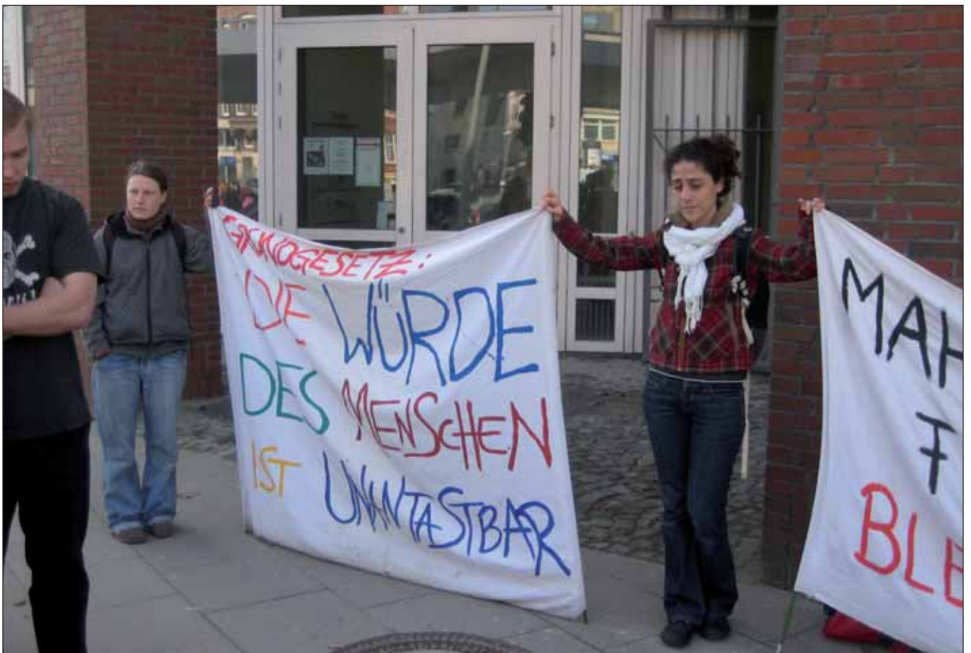
Mahnwache vor der Ausländerbehörde in der Amtsinckstraße

Auf zwei Veranstaltungen in den kommenden Wochen möchten wir besonders aufmerksam machen: auf die auch von der Hamburger LINKEN unterstützte Demonstration des Netzwerks Recht auf Stadt und Never mind the Papers am 28. Mai sowie eine Veranstaltung des Bündnisses Stadt des Ankommens am 10. Juni. Nicht ganz zufällig geht es in beiden Fäl-