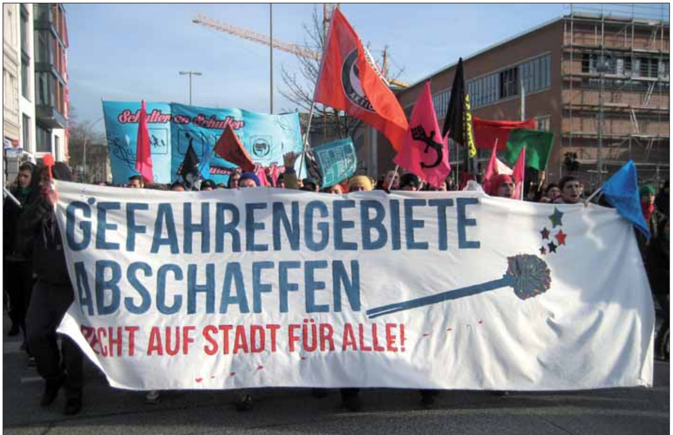
Demo im Januar 2014

»Tatsachen«, schrieb Hannah Arendt in »Wahrheit und Politik«, »sind der Gegenstand von Meinungen, und Meinungen können sehr verschiedenen Interessen und Leidenschaften entstammen, weit voneinander abweichen und doch alle noch legitim sein, solange sie die Integrität der Tatbestände, auf die sie sich beziehen, respektieren«.