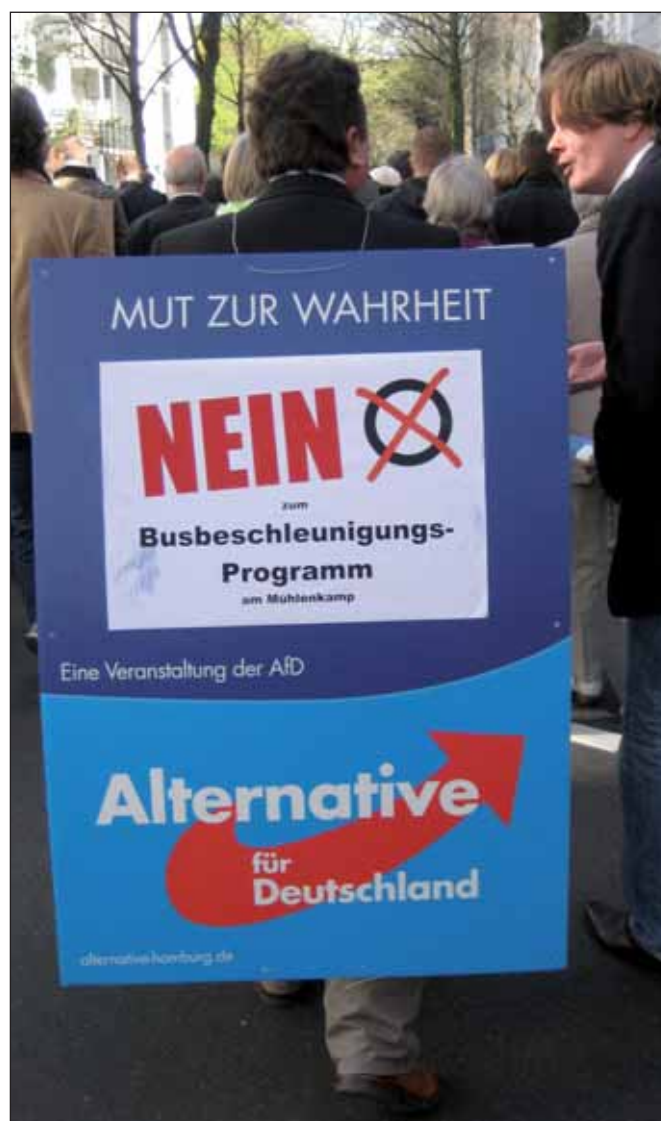
Unwillkommene AfD-Mitwanderung bei Demo in Winterhude 2014

Rechtskonservative, rechtsextreme und rechtspopulistische Parteien stützen sich vor allem auf die unteren sozialen Mittelschichten und verfolgen das Ziel, eine nationalstaatliche Ausrichtung durchzusetzen, wobei das unterliegende Staatsverständnis sich an autoritären Strukturen orientiert. Für rechtspopulistische Parteien ist kennzeichnend, dass sie in ihren Strategien an das »Volk« und an ein »Wir-Gefühl« appellieren, gegen die Eliten protestieren und einfache Erklärungs- und Lösungsmuster für komplexe Sachverhalte verwenden.