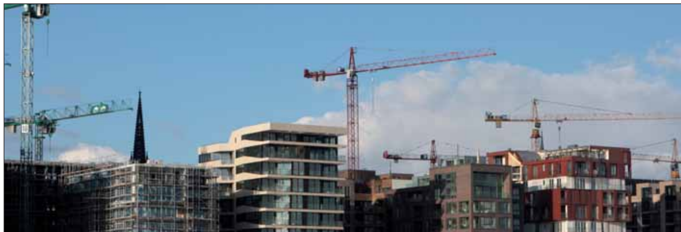
Inzwischen fertig: Hafencity-Bauten 2008

Seit Jahren fordert DIE LINKE, in Hamburg mehr Wohnungen zu bauen. Statt der vom Senat angestrebten Zahl von jährlich 6.000 neuen Wohnungen lautet unsere Zielzahl 8.000. Von der SPD wurde diese Forderung stets als abwegig und nicht zu erfüllen verurteilt. Wo sollen denn diese Wohnungen entstehen, wenn vor Ort die BürgerInnen und oft auch die Linken Wohnungsbau ablehnen würden, waren beliebte (Schein-)Argumente der SozialdemokratInnen und auch der Grünen. Doch das ist anscheinend Schnee von gestern: »Senatorin Stapelfeldt kündigt 10.000 Wohnungen pro Jahr an«, so der Senat in seiner Pressemitteilung vom 26. April. Bevor die ersten LeserInnen meinen, hier einen großen Erfolg der LINKEN sehen zu können, ist es notwendig, sich die Rahmendaten und die bisher bekannten Details anzusehen. Zwei Hauptfragen gibt es: Für wen und wo sollen die Wohnungen gebaut werden?