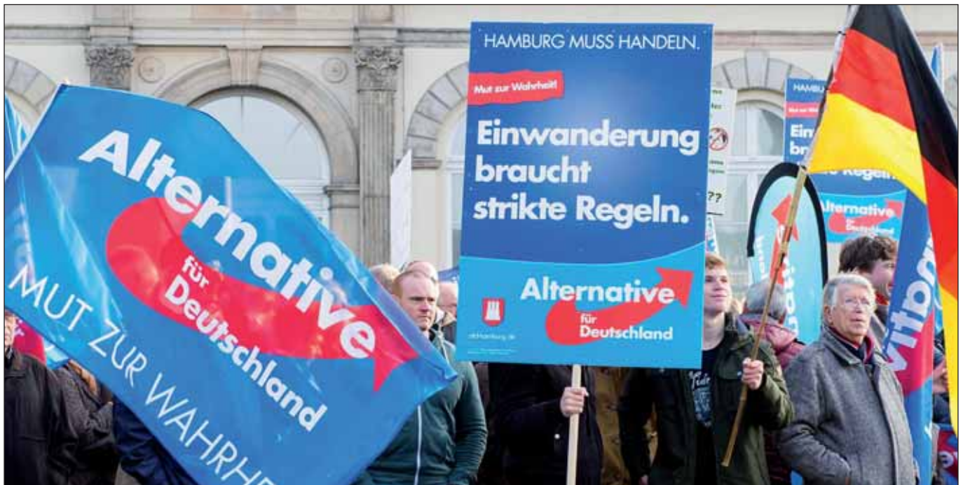
Demo am 31.10.2015 in Hamburg

Seit dem Programmparteitag der AfD in Stuttgart kann es über die Qualität des Rechtspopulismus in Deutschland keinen berechtigten Zweifel mehr geben. Der Ko-Vorsitzende Jörg Meuthen definiert als Ziel der neuen Formation, einen fundamentalen Politikwechsel anzustreben. »Wir sind auf dem Weg in ein anderes Deutschland«, sagt er. Die AfD wolle eine konservative Volkspartei werden und »auf längere Sicht die Geschicke des Landes« lenken. Die Kampfansage lautet: weg von einem »links-grün versifften 68er-Deutschland«.