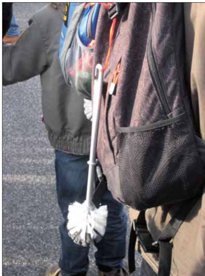
Demoutensil im Januar 2014

Tatsächlich sollen die Vorgaben für die Ausweisung »gefährlicher Orte« klarer gefasst werden. War bis jetzt die »Lagebeurteilung« durch die Polizei ausreichend, sollen nun »Tatsachen, die die Annahme rechtfertigen«, dass es an den Orten gefährlich zugeht, vorliegen. Diese im Prinzip überprüfbaren Fakten sollen zu anlasslosen, verdachtsunabhängigen Kontrollen ermächtigen. Und ob die Tatsachen vorliegen – und