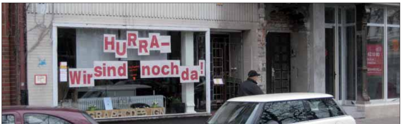
In der Danziger Straße

Noch ganz andere Möglichkeiten würde das Fördersystem in österreichischen Städten eröffnen. Erheblich längere Laufzeiten und das Prinzip »Einmal gefördert, immer gefördert« sind dort Wirklichkeit. Und Salzburg zeigt zudem, dass sozialer Wohnungsbau unter Ausschaltung der Banken und privater Eigentümerinteressen für 4,78 Euro/qm zu haben ist« (taz, 11.11.2012).