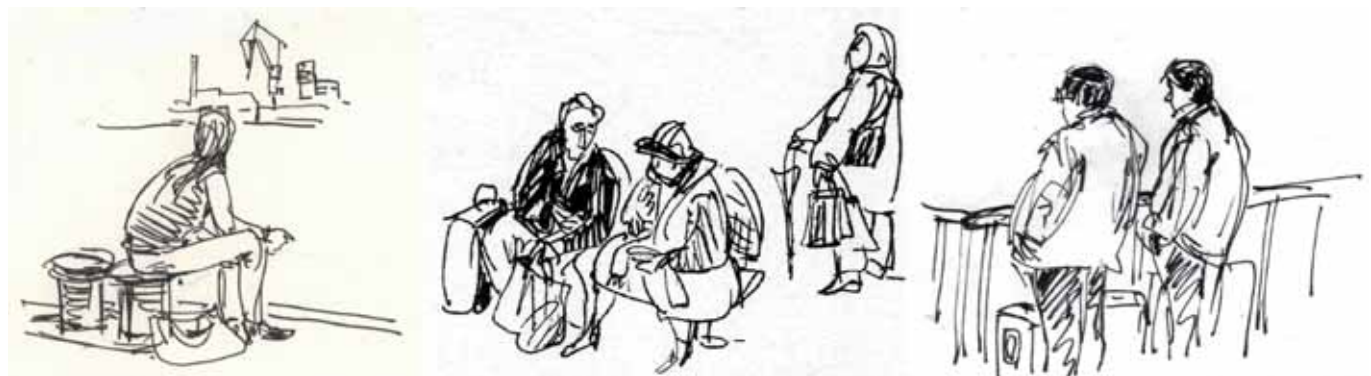
Wartende... (Zeichnung: Birgit Kiupel)

Nachfolgend soll mit einigen Daten und Thesen das Problem der Sozialbindungen im öffentlich geförderten Wohnungsbau betrachtet werden. Dabei steht die Mietpreisbindung im Vordergrund, Belegungsbindungen (das Belegungsrecht seitens der Stadt bzw. des Wohnungsamtes) wird hier vernachlässigt.