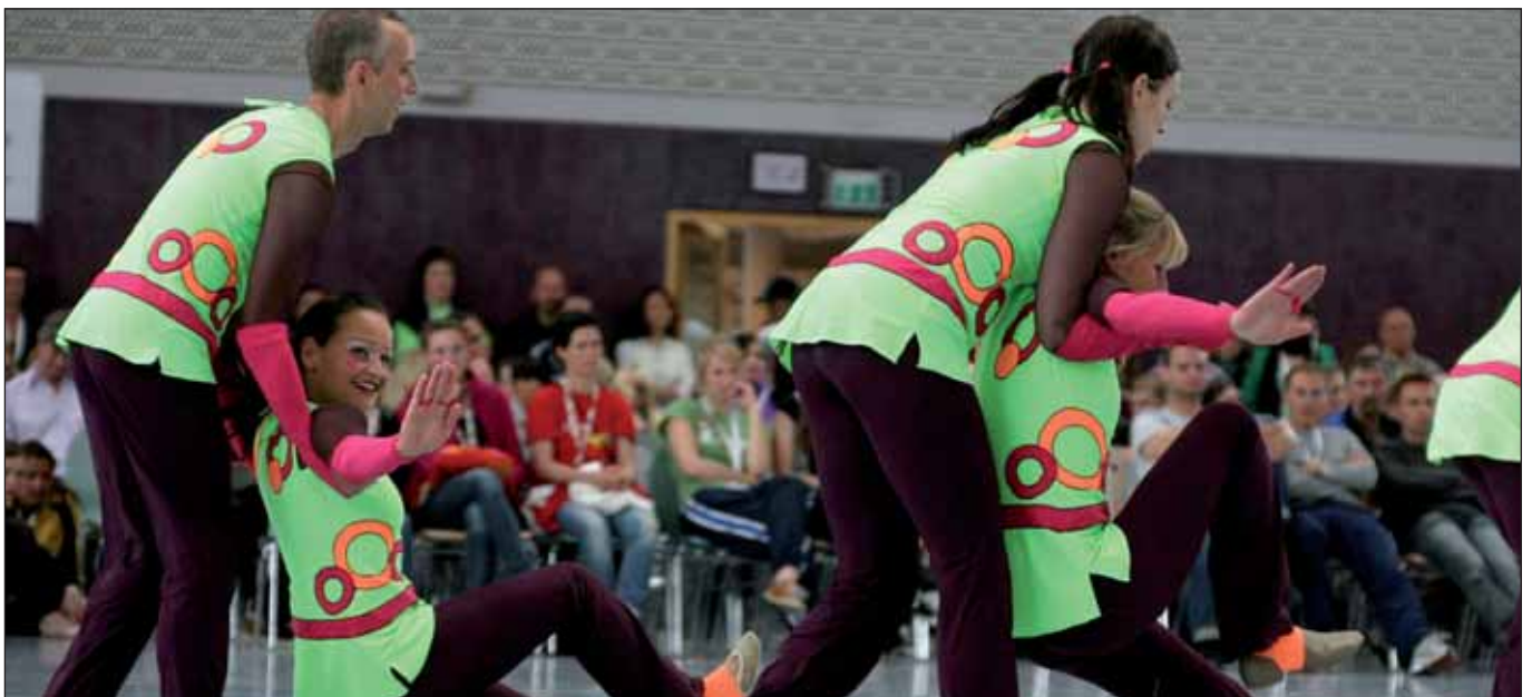
Impressionen vom Turnfest 2009 in Frankfurt a.M.

Bei der Frage von sportlichen Großveranstaltungen geht es mir und der LINKEN vor allem darum, welche Breitensportlichen Akzente (neben Spitzensportdarbietungen) gesetzt werden, und ob das Geld nachhaltig, zum Beispiel für den Neubau und die Instandsetzung von Einrichtungen, eingesetzt wird, die der Hamburger Bevölkerung und ihren Sportvereinen zugute kommt. Der Hamburger Senat verfolgt mit seiner Sport- und Eventpolitik andere Grundsätze. Dazu Alternativen deutlich zu machen, dafür haben die Menschen DIE LINKE auch in die Bürgerschaft gewählt!