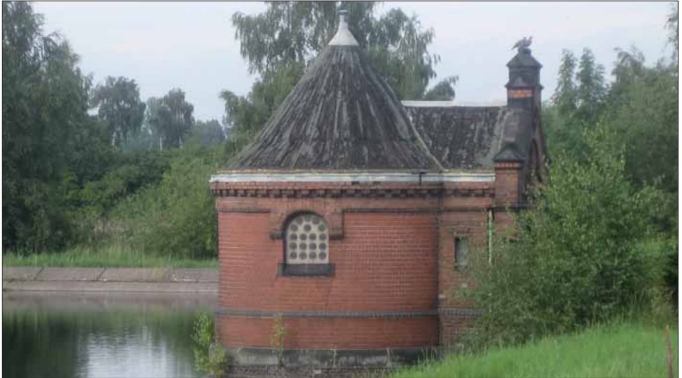
Türmchen des alten Wasserwerk Kaltehofe

Das stadtpolitische Konzept zunächst der CDU, mittlerweile auch der GAL, »Wachsende Stadt« bzw. neuerdings »Wachsen mit Weitsicht«, zielt darauf ab, das Stadtbild nachhaltig und leider immer häufiger negativ zu verändern. Zum einen wird neuer Wohnraum vor allem für einkommensstarke Gruppen geschaffen (darunter leiden vor allem die innerstädtischen BewohnerInnen, deren Wohnungen für eben diese Klientel »freigemacht« werden), zum anderen geht es einigen naturnahen, teilweise recht unbekanntem Flecken an den Kragen.