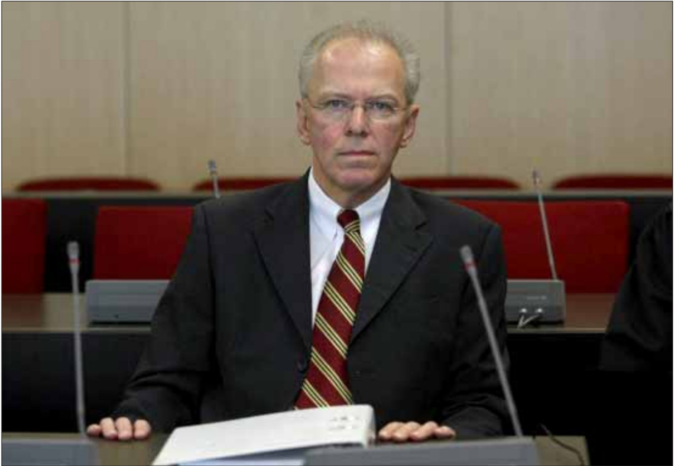
IKB-Banker Stefan Ortseifen vor Gericht

Die Verurteilung des ehemaligen Chefs der IKB-Bank Stefan Ortseifen wirft ein charakteristisches Bild auf die politisch-juristische Aufarbeitung der Finanzkrise in Deutschland. Es gibt etliche parlamentarische Untersuchungsausschüsse, etliche staatsanwaltliche Ermittlungsverfahren und zahlreiche Prüfungen von Banken, ob sie von ihren früheren Führungskräften Schadensersatz für die verzockten Milliarden zivilrechtlich einfordern können.