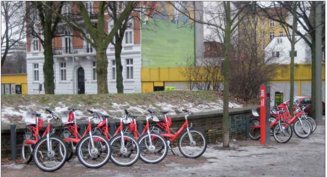
Rote Stadträder zum Ausleihen

Seit einigen Tagen sind in Hamburg Schulferien. Nicht wenige Menschen, vor allem solche, die mit einem geringen Einkommen auskommen müssen, sind auf Angebote angewiesen, die ihnen und ihren Kindern ermöglichen, unbekannte Ecken und Seiten unserer Stadt zu entdecken.