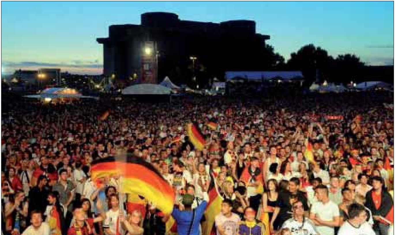
Public Private Viewing auf dem Heiligengeistfeld

Meine Zustimmung zum »Public Viewing« auf dem Heiligengeistfeld stieß nicht nur auf Zuspruch; sicherlich zu Recht hatten Mitglieder der LINKEN auf St. Pauli eingewendet, dass mit diesem wochenlangen Megaereignis erneut große Belastungen (Lärm, Zuparken etc.) der Nachbarschaft einhergehen.