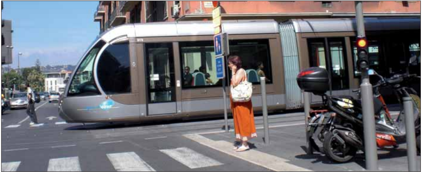
Stadtbahn-Vorbild für die CDU: Nizza

Ende Juli meldete sich der »Bund der Steuerzahler Hamburg e.V.« zu Wort und stellte die erst kürzlich vorgelegte Finanzplanung für die neue Stadtbahn – derzeit wohl das einzige verbliebene Projekt des schwarz-grünen Senats, das vor allem von der GAL vorangetrieben wird – in Frage. Kritisiert wird auch in diesem Fall eine »kreative Buchführung«, die der zurückgetretene Bürgermeister Ole von Beust eingeräumt hatte. Drei Argumente werden vorgebracht: