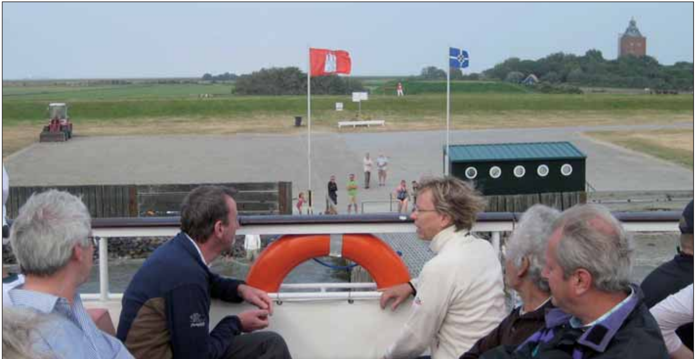
Das älteste Gebäude Hamburgs: der Leuchtturm von Neuwerk

Ziel der politischen Bildung muss sein, »die Regierten von den Regierenden intellektuell unabhängig zu machen«. Mit diesem Satz von Antonio Gramsci auf dem Deckblatt ist soeben das Bildungsprogramm der Hamburger LINKEN für die zweite Jahreshälfte erschienen. Insgesamt 13 Abend- und Wochenendveranstaltungen im Zeitraum August bis Dezember 2010 werden angeboten.