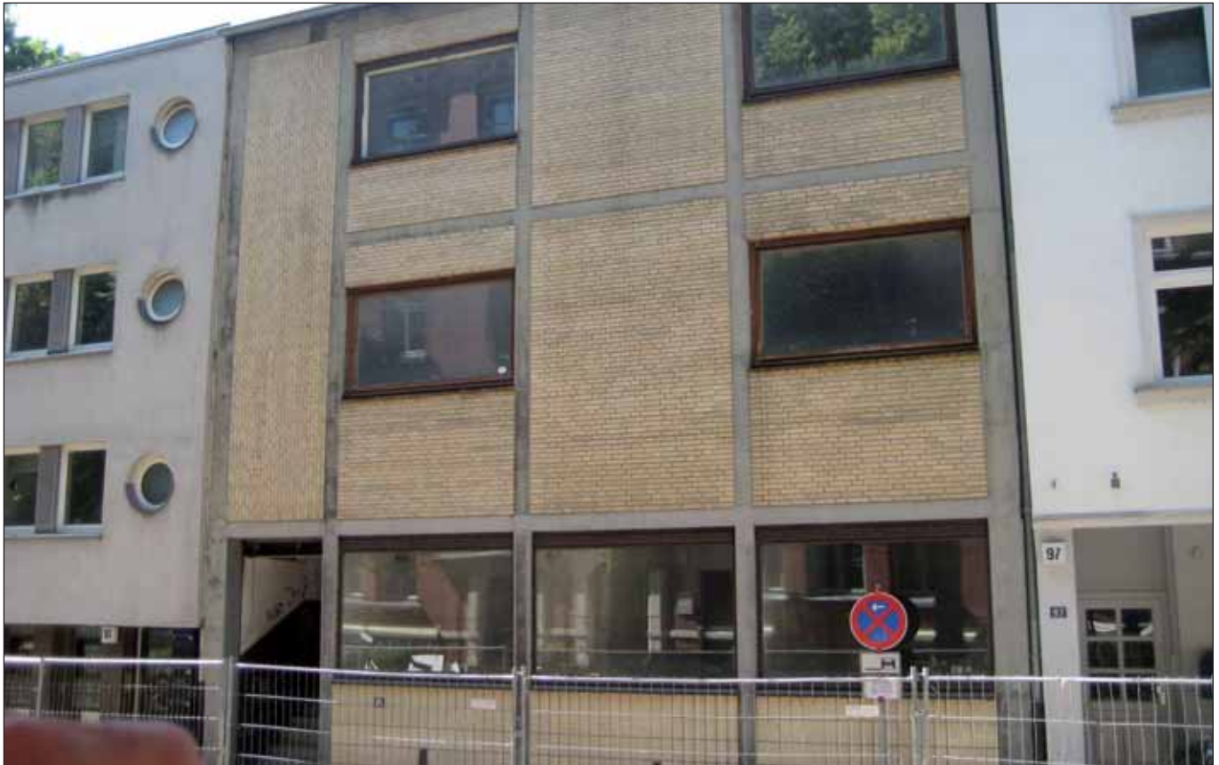
Koppel 95 in St. Georg: Der Senat weiß nichts von Leerstand...