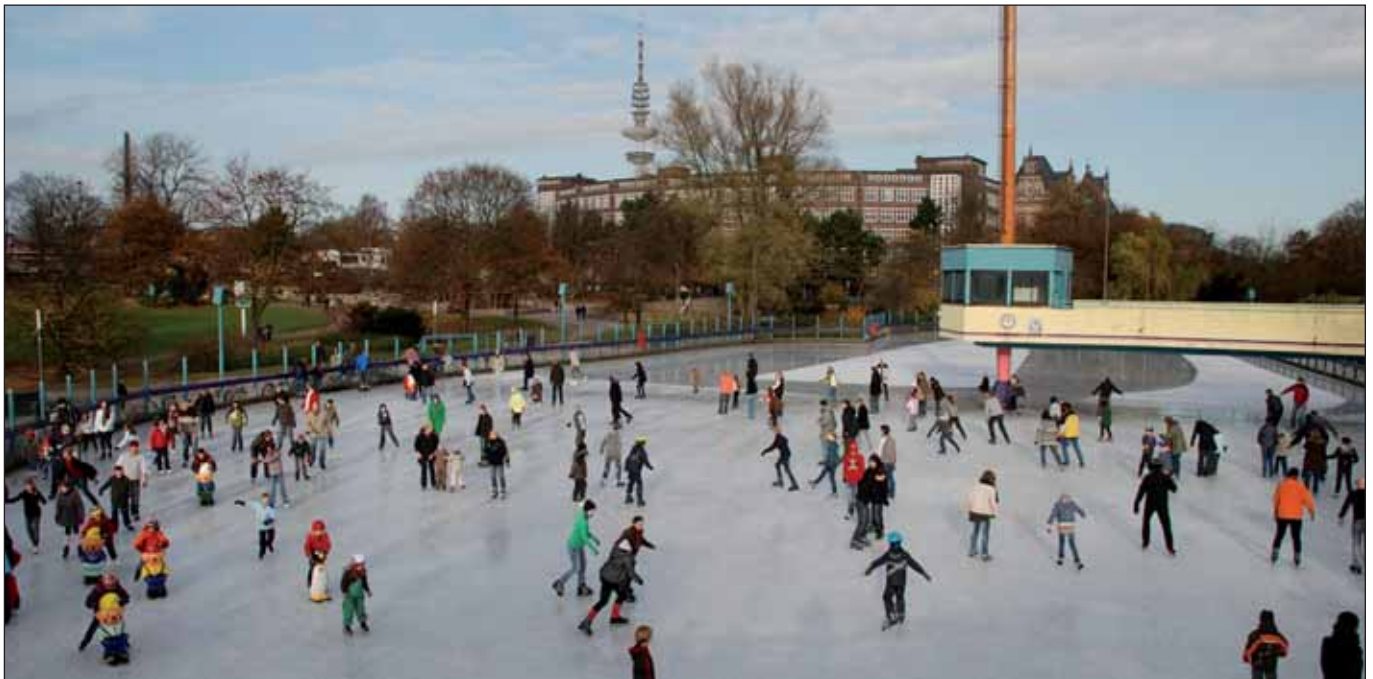
Breitensportaktivitäten werden immer teurer: Eisbahn Wallanlagen

Ich setze die im letzten »BürgerInnenbrief« begonnene exemplarische Darlegung fort, wie mit Kleinen Anfragen für mehr Transparenz gesorgt und dem Senat Antworten, auch wenn diese mitunter bedrückend spärlich ausfallen, entlockt werden können. Mittlerweile sind alle dort angesprochenen Anfragen beantwortet worden.