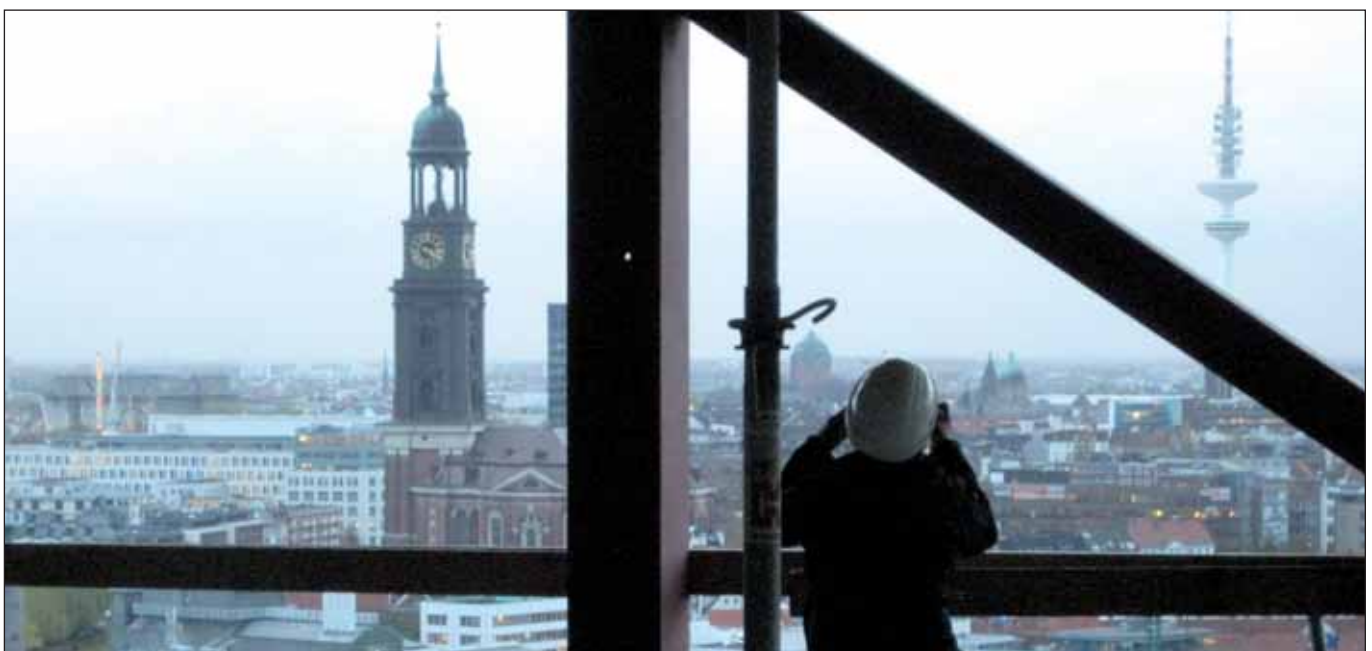
Blick von der Elbphilharmonie-Baustelle auf andere Teile der Stadt