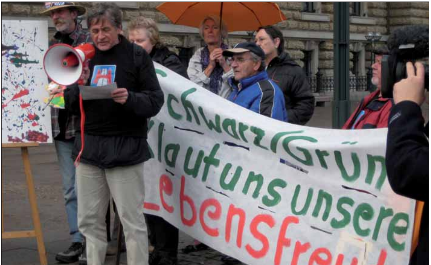
Wilhelmsburger protestierten auf dem Rathausmarkt bereits im Herbst 2010

Die WilhelmsburgerInnen führen ihre Proteste gegen die Verlagerung der Reichsstraße und die Schaffung einer neuen Quasi-Autobahn sowie gegen die »Hafenquerspanne« fort. Am Samstag, den 5. Februar , demonstrieren sie um 12:00 Uhr erneut auf dem Hamburger Rathausmarkt. Dies soll vor allem den Abgeordneten der CDU und der GAL (und nicht zuletzt auch der möglichen neuen Regierungspartei SPD) noch einmal die ablehnende Haltung der ElbinsulanerInnen deutlich machen, steht das Thema Reichsstraßen-Verlagerung doch auf der letzten Bürgerschaftssitzung vor der Neuwahl am 9. Februar erneut zur Debatte. Also trotz noch winterlichen Temperaturen: Raus an die frische Luft und mitdemonstrieren!