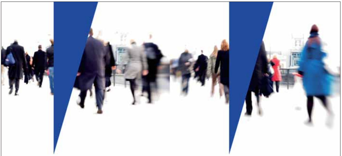
Aus dem Einladungsflyer der Konferenz zur sozialen Spaltung

Am Mittwoch, den 16. Februar , tagt von 8:30 bis 17:00 Uhr in der Hochschule für Angewandte Wissenschaften (HAW, Berliner Tor 5) die »2. Konferenz zur sozialen Spaltung«. Sie trägt den Titel »Wohnen in Hamburg. Marktentwicklung und soziale Folgen« und wird von der Arbeitsgemeinschaft Soziales Hamburg veranstaltet, einem Zusammenschluss aus der Evangelischen Akademie der Nordelbischen Kirche, der La-waetz-Stiftung, dem Diakonischen Werk, dem Hamburger Institut für Sozialforschung, dem Institut für Soziologie der Helmut-Schmidt-Universität (der Bundeswehr), dem HAW-Departement für Soziale Arbeit, der Arbeitsgemeinschaft Gesundheitsförderung am Universitätskrankenhaus Eppendorf und dem Arbeitsgebiet Stadt- und Regionalsoziologie der HAW-Universität.