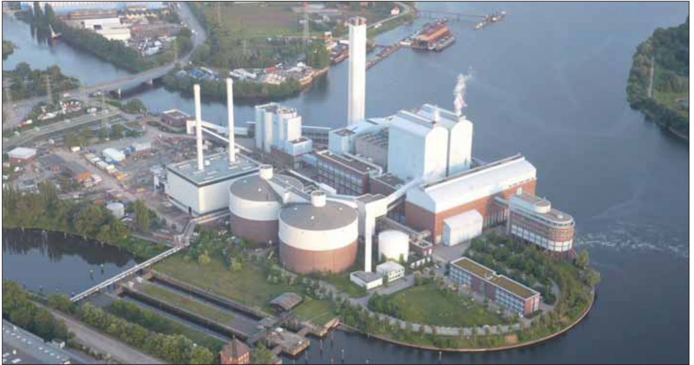
Zurück ins kommunale Netz holen: Kraftwerk Tiefstack

Die in der Initiative »Unser Hamburg – Unser Netz« zusammengeschlossenen Organisationen, unter anderem der BUND und RobinWood, haben insgesamt 17.726 Unterschriften für die Rekommunalisierung der Energienetze gesammelt an den Senat überreicht und damit die erste Stufe auf dem Weg zur Volksabstimmung erreicht.