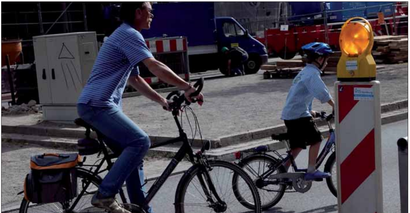
Sehen so Rad-Rambos aus?

Die Debatten mit dem höchsten Unterhaltungswert in der Bürgerschaft werden von der FDP bestritten. Besonders beim Thema Verkehrspolitik offenbart die FDP interessante Weltanschauungen.