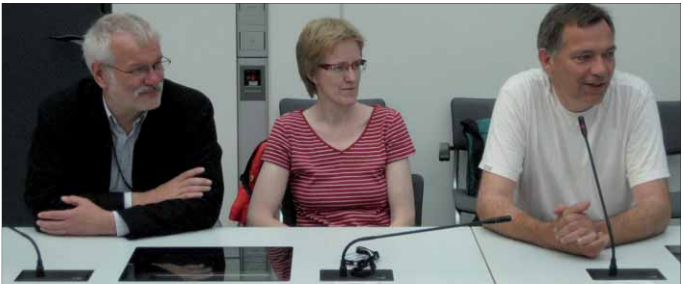
Delegationsleitung im Clara-Zetkin-Saal