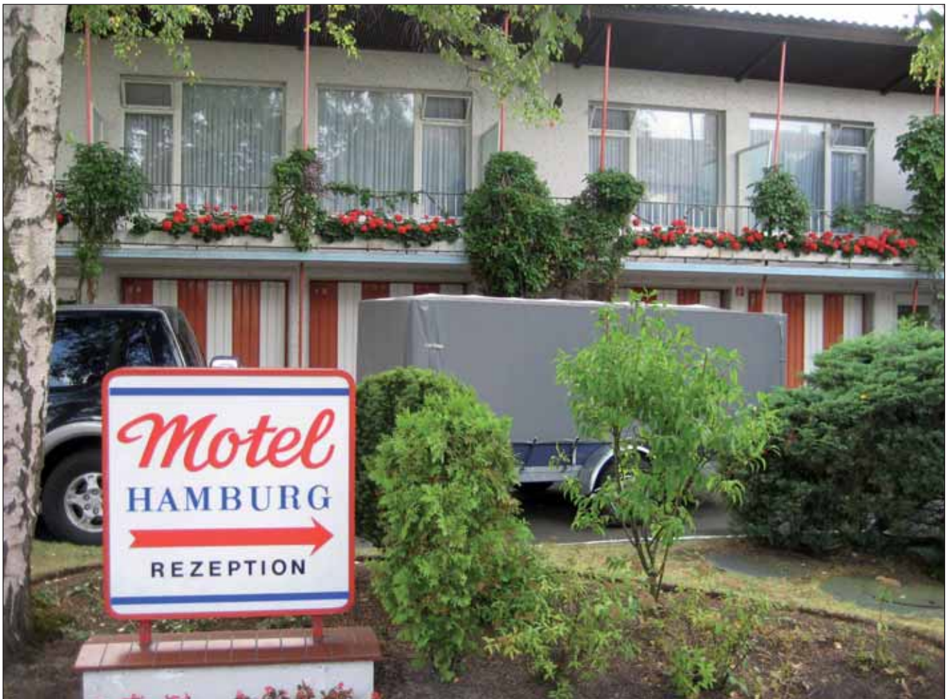
Als Hotels noch Motels und ausgelastet waren

Wie wäre es zum Beispiel, wenn die freien Hotel- und Pensionskapazitäten sofort den Menschen zur Verfügung gestellt würden, die sie bräuchten? Das müsste doch bei 45.800 vorhandenen Hotelbetten und einer Auslastungsquote von zuletzt 54,2% bedeuten, dass immer um die 22.000 Betten im Durchschnitt als Unterkunft zur Verfügung stünden?! Damit könnten wir die Wohnungsnot zumindest der Menschen ohne Obdach lindern und die mit einem Dringlichkeitsschein schon mal von der Straße kriegen. Und für ein wenig sozialen Frieden in der Stadt sorgen. Aber das würde dann doch zu weit führen und – wir antizipieren die Gegenargumente der entsprechenden Institutionen – das Ansehen des Tourismus-Standorts Hamburg schmälern.