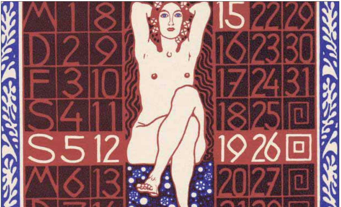
Gebrauchsgrafik im Jugendstil

Im Museum für Kunst und Gewerbe (Brocksesstraße) ist seit kurzem die Ausstellung Grafikdesign im Jugendstil , also aus der Zeit um 1900, zu bewundern. Insgesamt mehr als 350 Grafiken präsentiert das Museum, das weltweit mit seinen ca. 15.000 Blättern aller Art (Plakaten, Kalenderblättern etc.) über eine der größten Sammlungen von Gebrauchsgrafik insgesamt verfügt. Die Präsentation, die noch bis zum 28. August zu besichtigen ist, trägt den Untertitel »Der Aufbruch des Bildes in den Alltag«, mit dem das öffentliche Erscheinungsbild des revolutionierenden Jugendstils in Form von Werbung und Buchillustrationen auf den Punkt gebracht werden soll. Gezeigt werden entscheidende Entwicklungen des Historismus, der Art Nouveau, des Jugendstils, der Wiener Secession, des Expressionismus und der Art Déco in Europa sowie der neuen Werbung in den USA. In der Ankündigung heißt es: »Die Künstler behandelten im Medium Grafik vor allem moderne Themen wie Sport, Mode, Politik, Technik und Alltag und legten den Grundstein für das heute so selbstverständliche Corporate Design, für ein professionalisiertes Grafikdesign und für eine Ästhetik der Werbung. Plakate, Buchtitel,