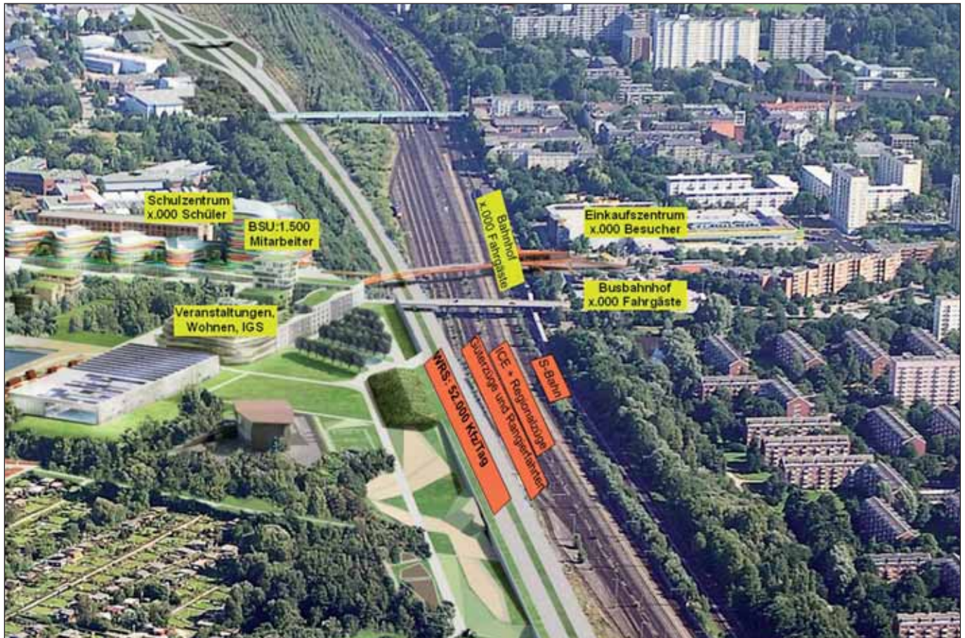
Wilhelmsburger Mitte-Perspektiven, IBA-Luftbild, ergänzende Einträge von M. Rothschild

Schon seit Jahren wehren sich die ElbinsulanerInnen gegen die Verlegung und den Ausbau der Wilhelmsburger Reichsstraße zur Quasi-Autobahn. Was unter Grün-Schwarz begonnen wurde, soll nun offenbar unter dem neuen SPD-Senat realisiert werden. Trotz massiver Bevölkerungsproteste und etwa 150 Einwendungen gegen die Verlegung wird an der Planung festgehalten. Im Spätsommer dürfte das Planfeststellungsverfahren abgeschlossen werden, mit dem Baubeginn wird im Oktober 2011 gerechnet. Doch das ist, wie vor allem der Verein Zukunft Elbinsel seit längerem unterstreicht, ein sicherer Beleg, dass die Fertigstellung erst im Jahre 2014 erwartet werden kann. Zu spät für die »Internationale Bauausstellung« (IBA) und die »internationale Gartenschau« (igs). Schon schiebt die CDU der SPD die rote Karte zu, als wenn sie nicht bis vor kurzem selbst im Verbund mit der GAL für das gescheiterte »Beteiligungsverfahren« und die mangelhaften Planungen verantwortlich gewesen wäre.