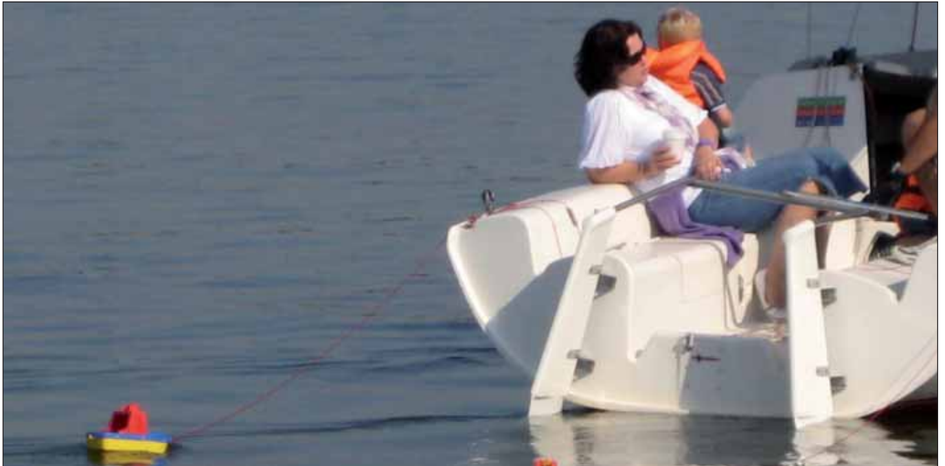
Wenn du arm bist, musst du eher ertrinken?

gemäß angeboten werden muss. Die Hiobsbotschaften von 2009 haben gerade noch dafür gesorgt, dass Hamburgs Lehrschwimmbecken nicht komplett abgeschafft wurden. Nach wie vor ist aber eines von acht nicht in Betrieb und die anderen sind de facto in private, vereinseigene Zuständigkeit übergegangen. Die Stadt Hamburg kümmert sich nicht mehr selbst um die Schwimmbildung. Es wäre erheblich mehr öffentlicher Einsatz nötig gewesen, um vor allem den Kindern von einkommensschwachen Familien, die sich keine privaten Schwimmkurse erlauben können, das Schwimmen beizubringen.