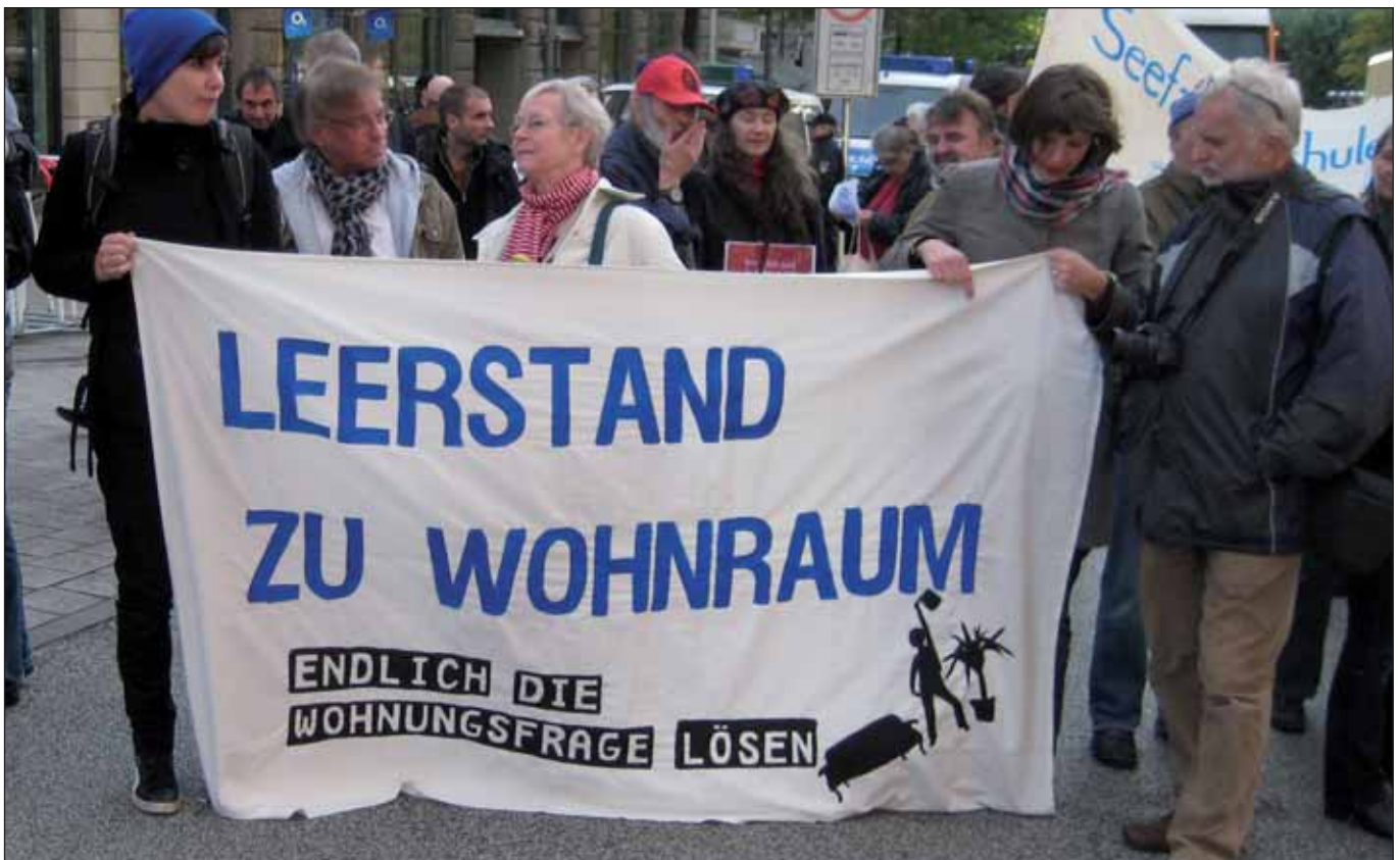
»Endlich die Wohnungsfrage lösen«: Der neue Mietenspiegel wird dabei nicht helfen

Im Schnitt 7% mehr für Neubauwohnungen in Hamburg gegenüber dem Vorjahr mussten EigentümerInnen 2010 hinlegen (siehe Hamburger Abendblatt vom 29.3.2011). »Größte Mietsteigerung seit 1992 in Hamburg« hieß es gleichzeitig für Hunderttausende MieterInnen (ebenda am 21.4.2011). Und als Krönung wurde kürzlich klar, dass auch noch die Mietnebenkosten in Hamburg überproportional stark angestiegen sind: Sie erhöhten sich von 2007 bis 2009 um 10% und betragen im Durchschnitt mittlerweile über drei Euro je Quadratmeter (ebenda am 9.6.2011). Angesichts eines rückläufigen oder bestenfalls stagnierenden Realeinkommens bedeuten