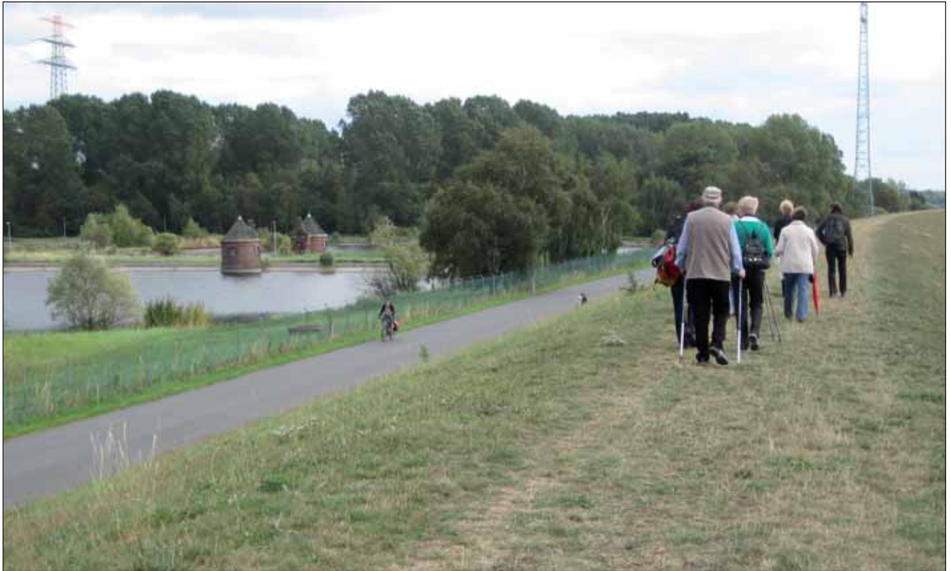
Raus in die Stadt! Zum Beispiel zu einem Spaziergang durchs wunderschönen Kalkhofe

Wer in den jetzt begonnenen Sommerferien in Hamburg bleibt, wird in den kommenden Wochen zahlreiche Open-Air-Angebote nutzen können: Eigentlich gibt es in Hamburg kein schlechtes Wetter, nur falsche Kleidung.