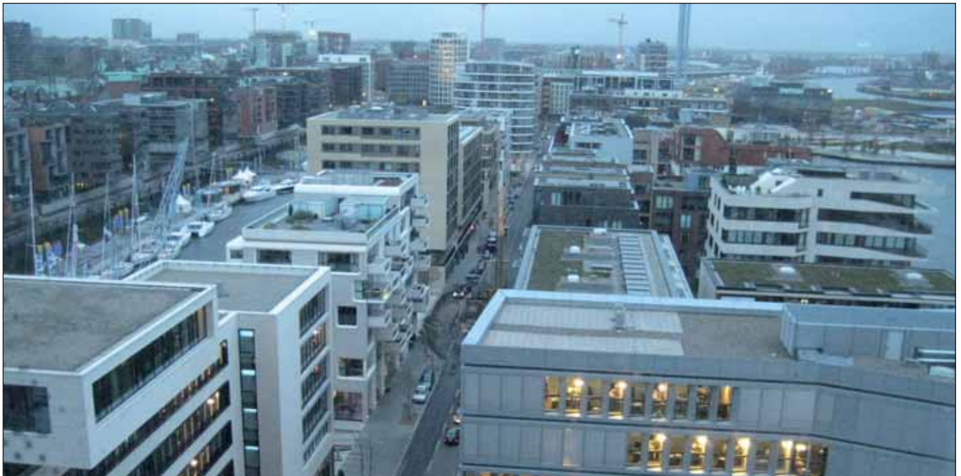
»Investorenteil«: Blick von der Elbphilharmonie in die HafenCity

Seit den 1990er Jahren ist Büroleerstand ein bekanntes Phänomen. Kritischen Stimmen, die die Flächenverschwendung und die gleichzeitig fehlenden Aktivitäten für Wohnungsbau angeprangert haben, wurde stets von allen Senaten entgegengehalten, dass ein Überhang an Flächen notwendig für einen gesunden Markt sei. Diese irrierte These hat jedoch den CDU-Senat im Jahr 2005 nicht an der Unterzeichnung eines Vertrages gehindert, beim Verkauf von Flächen in der HafenCity das Risiko für die BüroinvestorInnen zu vergesellschaften und bei entsprechendem Leerstand Bürokapazitäten anzumieten.