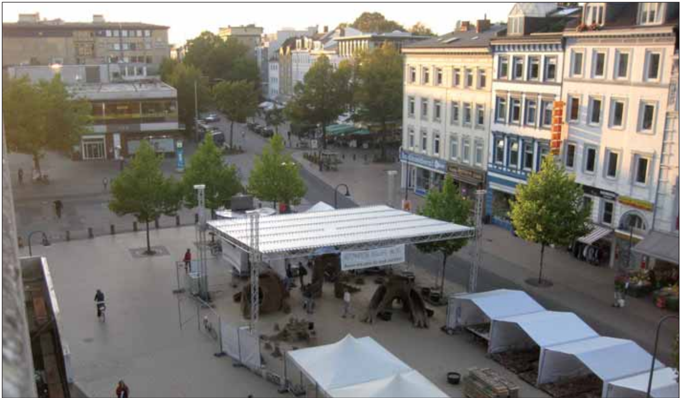
Vor dem Umbau: Blick vom ehemaligen Frappant-Gebäude in die Große Bergstraße

Von einer wirklichen Stadtplanung und -entwicklung kann meines Erachtens heutzutage nicht mehr die Rede sein. Anstelle eines umfassenden Konzepts, in das sich nach und nach die einzelnen Bauvorhaben einpassen, werden die Bebauungspläne den Investoreninteressen angepasst. Auch das so genannte Konzept der innerstädtischen Verdichtung durch Aufstockungen, Innenhofbebauungen und Baulückenschließungen dient allein dem ständig wachsenden Renditehunger nimmersatter ImmobilienbesitzerInnen.