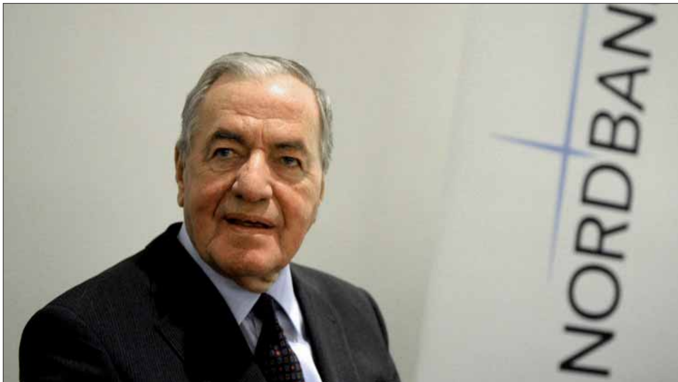
HSH Nordbank Aufsichtsratsvorsitzender Kopper: »Wenn' so kommt, wirds so kommen.«

Die Banken-Krise in den kapitalistischen Metropolen ist noch keineswegs ausgestanden. Die Dramatik zeigt sich nicht nur in den möglichen Konsequenzen einer größeren Umschuldung Griechenlands. Auch die deutschen Landesbanken schreiben noch immer rote Zahlen. Unter den größten von ihnen schaffen es die WestLB, die BayernLB, die Landesbank Baden Württemberg (LBBW) sowie auch die HSH Nordbank bislang nicht, aus eigener Kraft und ohne staatliche Hilfe wieder auf die Beine zu kommen. Sie sind außerstande, ausgeglichene Ergebnisse vorzulegen. Bei all diesen Banken gibt es eine ähnliche Konstellation: knappes Eigenkapital, kein tragfähiges Geschäftsmodell, dünne Margen.