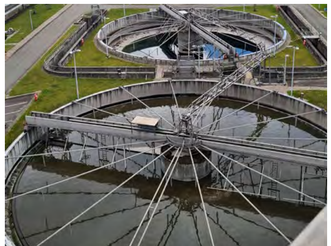
Klärwerk vor Ort oder: Was, wenn die nicht alle Schadstoffe und Gifte rauskriegen?