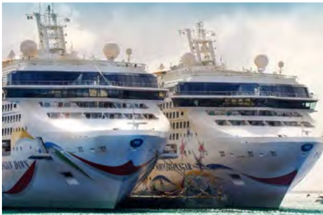
Stromfressende Meeressäuger mit jeweils tausenden Passagieren und Besatzungsmitgliedern

Anfang des Monats konnten wir im Rahmen einer Führung bei der Landstromanlage in Altona selbst einen Einblick gewinnen, wie die Landstromanlage funktioniert und auch welche Herausforderungen bei der Landstromversorgung der Schiffe noch bestehen. Nicht alle Schiffe sind in der Lage, Landstrom beziehen zu können. Der Bau der Infrastruktur und der Landstromanlagen kostet viel Geld. Seitens des Bundes wurden von 2020 bis 2024 über 46,5 Mio. Euro für die Errichtung der Landstromanlagen an den Container- und Kreuzfahrtterminals gezahlt, während der Kostenanteil für Hamburg über 34,6 Mio. Euro betrug (s. Schriftliche Kleine Anfrage vom 6.1.2025, Drs. 22/17426 ).