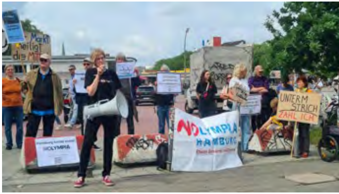
Erste NOlympia-Kundgebung der Neuzeit in Hamburg am 31. Mai 2025