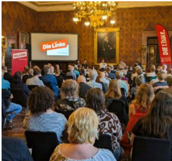
Kaisersaal am 15. Juli

Mit einem Bündnis aus 100 Initiativen und Organisationen haben viele Aktivist*innen gut ein Jahr vor den Pariser Spielen die »andere Seite der Medaille« zum Thema gemacht: Vertreibungen und Ausgrenzungen von tausenden von Menschen, die nicht in die heile schöne Bilderwelt passen, die Frankreich, Paris und das IOC der Welt vorführen wollten. Darüber berichtete Paul vor den über einhundert Zuhörer*innen.