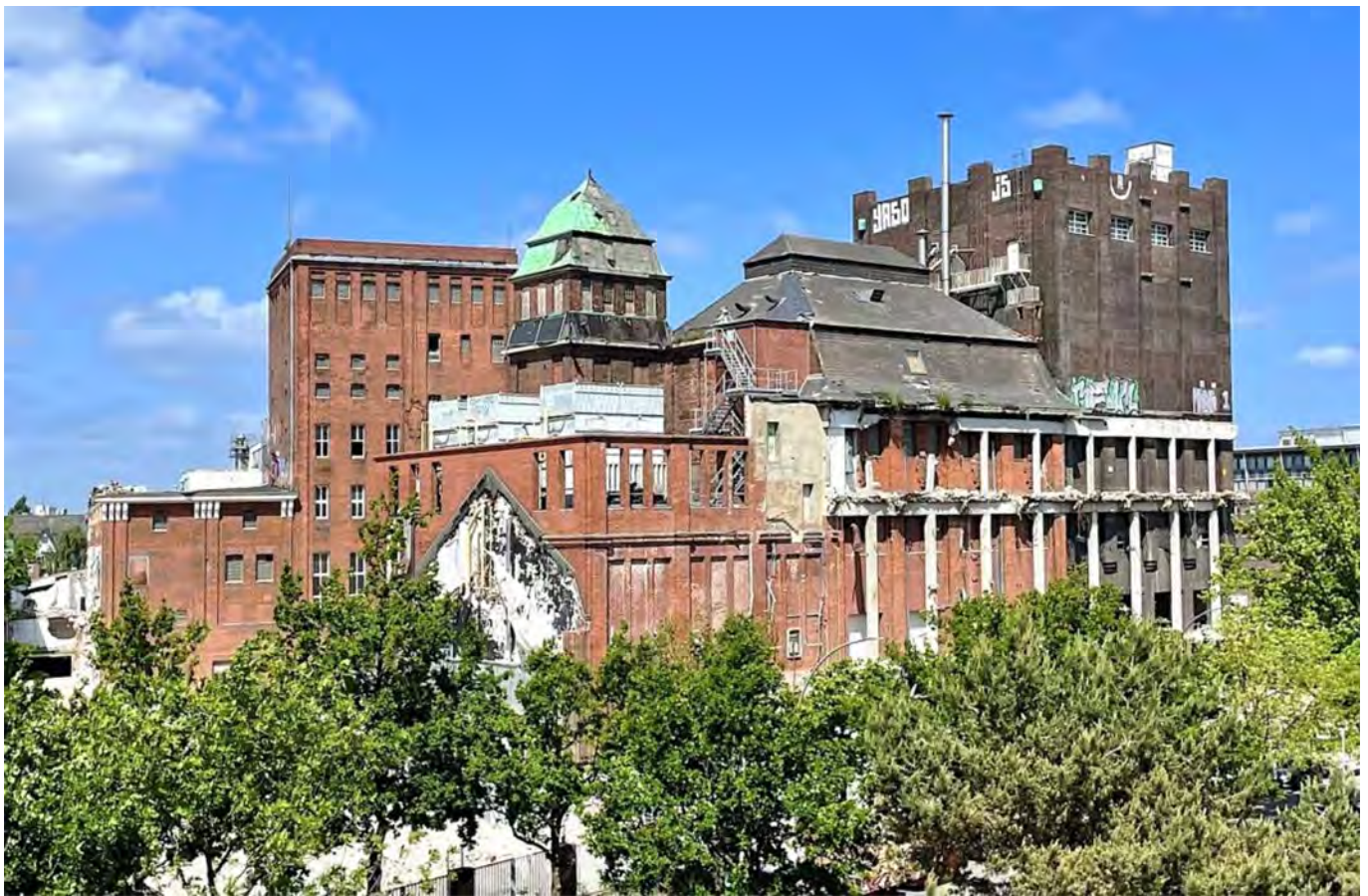
Historisch bedeutsame Altbauten auf dem Holstenareal