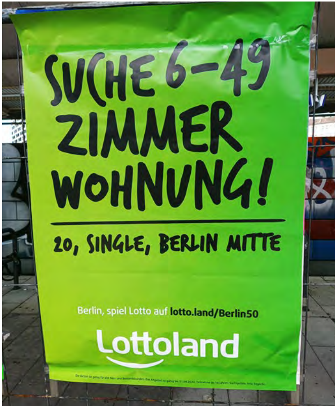
Wohnen darf nicht zum Lotteriespiel werden

Instrumenten auf. Die Vorlage des Konzepts für einen Mietendeckel erfüllte ein weiteres Versprechen des 100-Tage-Programms. Die Linksfraktion bereitet nun einen Antrag im Bundestag für einen bundesweiten Mietendeckel vor.