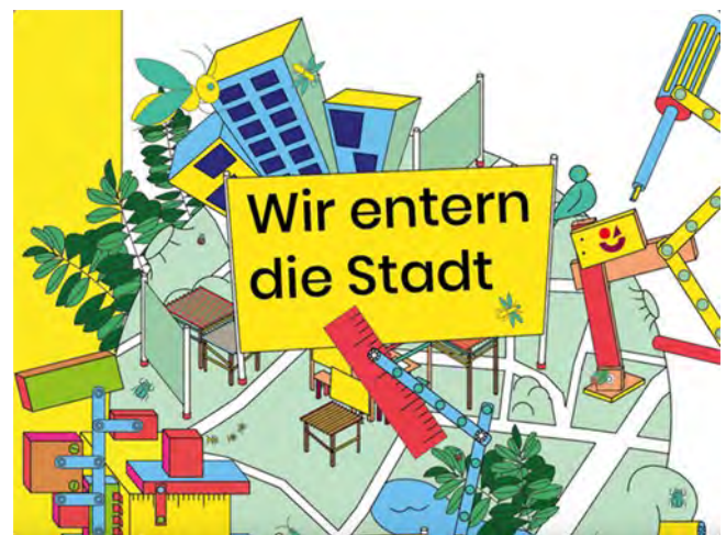
Kreative Assoziationen der Mini-Pop-up Kinderstadt

Und zuvorletzt sei noch auf die Kinderstadt Hamburg hingewiesen, die unter dem schönen Motto Wir entern die Stadt vom 26. Juli bis zum 1. August auf dem Platz 11 Bei der Alten Börse vor dem Haus der Patriotischen Gesellschaft stattfindet. Eine interaktive, täglich von 10 bis 20 Uhr geöffnete Ausstellung lädt ein, daneben auch fünf Workshops für jeweils bis zu 20 Kinder und Jugendliche zwischen 9 und 15 Jahren. Programm und Anmeldung unter https://t1p.de/fk03w .