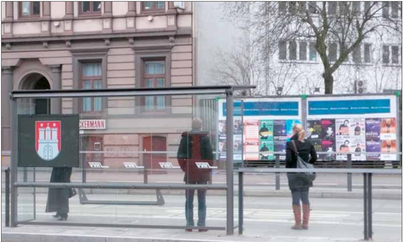
Gründelallee: Warten auf den schnellen Bus

Nicht nur vor Ort und in den Medien, sondern auch in den Bürgerschaftsdebatten ist das Busbeschleunigungsprogramm ein Aufreger.