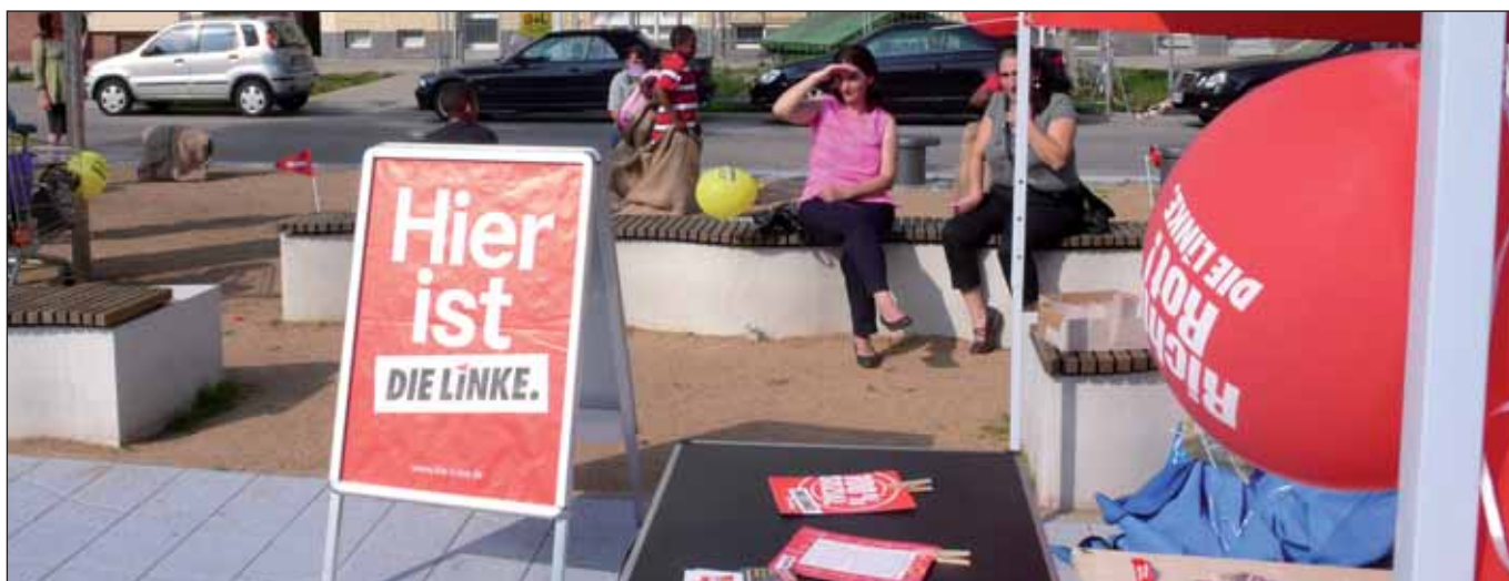
Osterbrookplatz, 18.8.

Gleich zwei richtungsentscheidende Abstimmungen stehen uns am kommenden Sonntag, den 22. September, bevor. Zum einen die Abstimmung über die Rekommunalisierung der Netze, ein Thema, bei dem zurzeit insbesondere die SPD und die Wirtschaft einen Sturm der Verunsicherung und Verfälschung der Argumente betreiben.