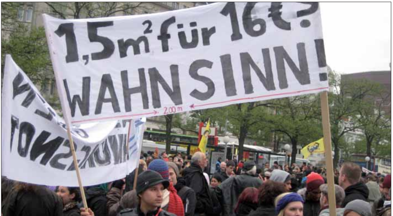
Demo gegen Mietenwahnsinn in Hamburg, 2012

»Keine Profite mit der Miete! Die Stadt gehört allen!« Unter diesem Motto findet auch in diesem Herbst wieder eine große Demonstration gegen den Mietenwahnsinn und die völlig unzureichende Wohnungspolitik statt. In diesem Jahr wird der Aktionstag am 28. September bundesweit umgesetzt. Demonstrationen soll es geben in Berlin, Düsseldorf, Frankfurt, Freiburg, Hanau, Köln, Maintal und eben in Hamburg. Hier haben mittlerweile rund 50 Organisationen und Initiativen zur Beteiligung an den Aktivitäten aufgerufen, auch DIE LINKE und