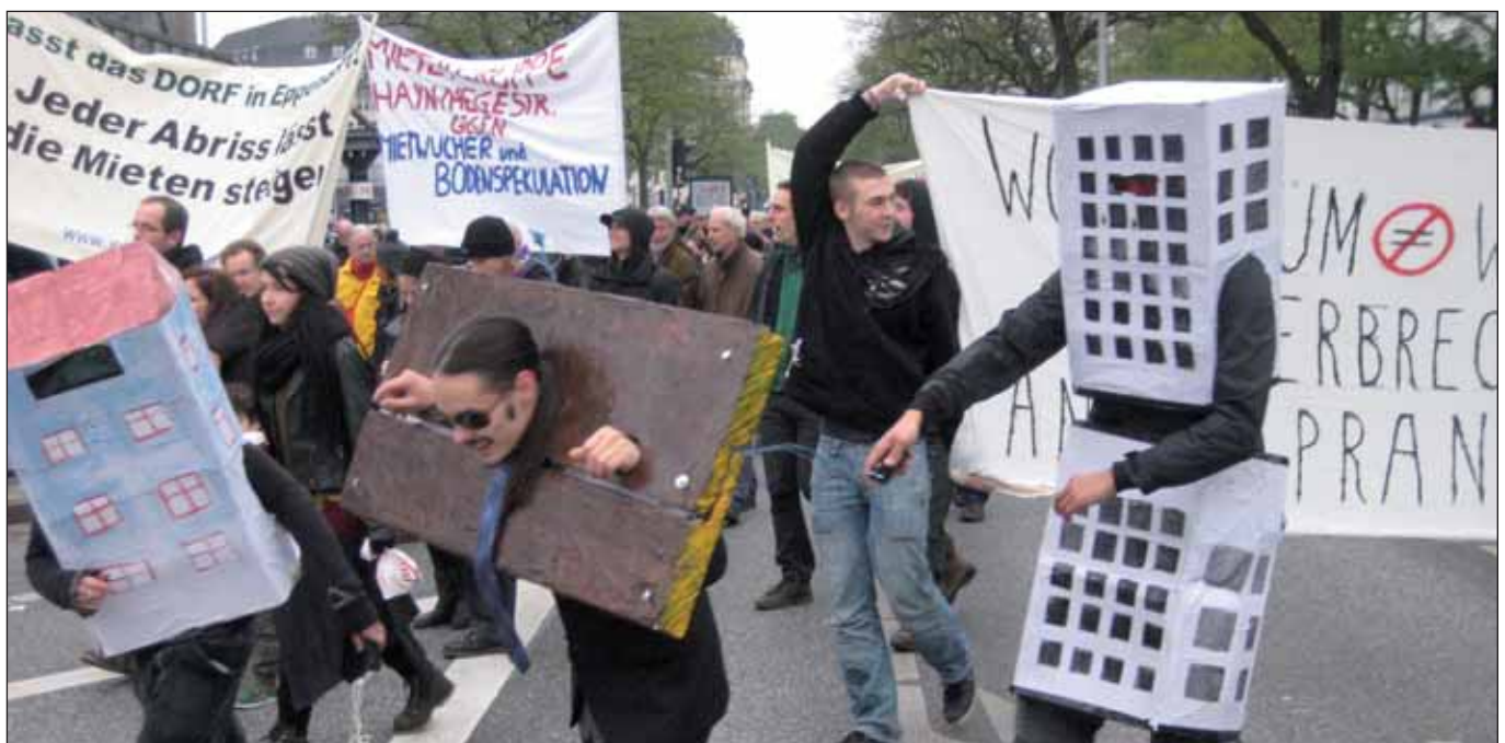
Demo gegen Mietensinn in Hamburg, 2012

Hamburg ist Spitze – leider auch bei den Mieten. Nirgendwo anders sind die Mieten in der jüngsten Vergangenheit so schnell gestiegen wie an der Elbe: Ende 2012 fielen die Neuvertragsmieten um 21% höher aus als noch vor fünf Jahren. Heute haben 400.000 Haushalte in der Hansestadt Anspruch auf eine Sozialwohnung. Deren Zahl hat sich aber von 155.000 im Jahre 2000 auf aktuell 97.000 verringert.