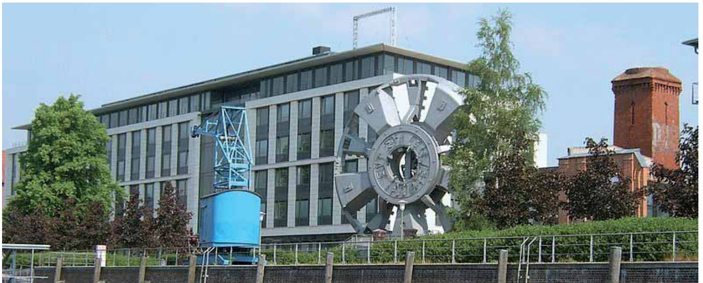
Zentrale der SAGA GWG in Barmbek-Nord

Der Titelbericht im »Hamburger Abendblatt« am 21. November machte auf einen Umstand aufmerksam, der einer wieder mal die Haare zu Berge stehen ließ: So war zu lesen, dass die SAGA GWG bereits auf reinen Informationsveranstaltungen zu neuen Bauprojekten (in diesem Fall zum »Wohnen am Suttnerpark«) verlangt, dass etwaige Wohnungssuchende umfangreiche persönliche Daten und Unterlagen vorlegen müssen, um überhaupt auf einer InteressentInnenliste Berücksichtigung zu finden. Lange vor einem Mietvertragsabschluss hat sich Hamburgs öffentliches Wohnungsunternehmen damit rechts- und sittenwidrig Zugang zu Daten einer unbekannteren Zahl von Menschen verschafft. Nicht zuletzt ließ sich