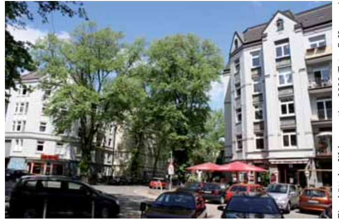
Eimsbütteler Wohnquartier, 2009

Ein besonders gravierendes Problem in Eimsbüttel ist das Thema öffentlich geförderter Wohnungsbau. So wurden 2011 in diesem Bezirk lediglich 27 (!) Wohnungen genehmigt, 2012 waren es 105. Stellt man den wachsenden Bedarf an geförderten Wohnungen (1. Förderweg!) den auslaufenden Bindungen im sozialen Wohnungsbau gegenüber, so ist das nur ein Tropfen auf den heißen Stein. Die Zahl der öffentlich geförderten Wohnungen in Eimsbüttel betrug im Jahr 2012 nur noch 7.188.