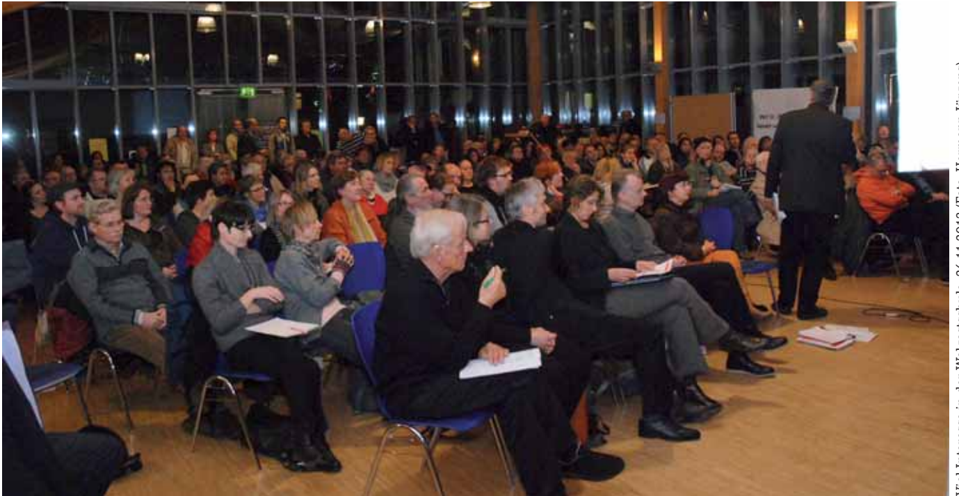
Viel Interesse in der Volkshochschule, 26.11.2013

Mehr als 180 BesucherInnen hatten sich am 26. November auf einer »Bilanz- und Protestveranstaltung« des Stadtteilbeirats St. Georg eingefunden, um über seine Zukunft zu beraten. Denn die sieht nach den Maßgaben des SPD-dominierten Bezirks Hamburg-Mitte wie auch des Senats schlecht aus.