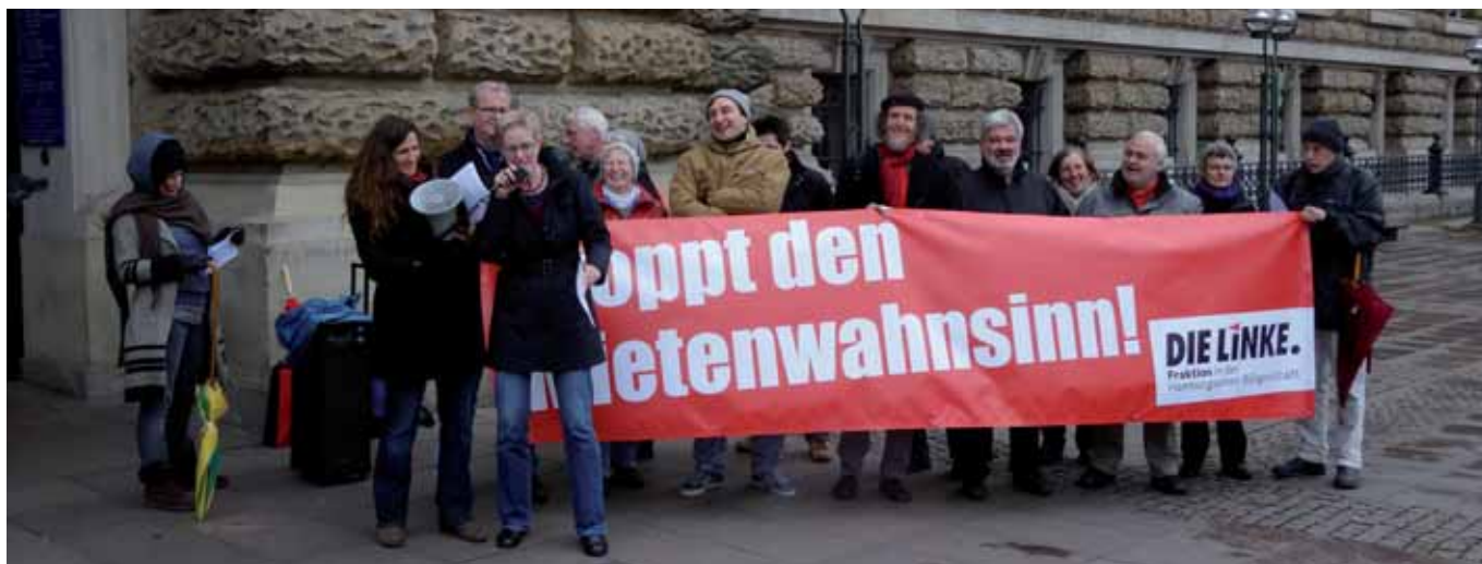
MietenWahnsinsChor, 12.11.2013