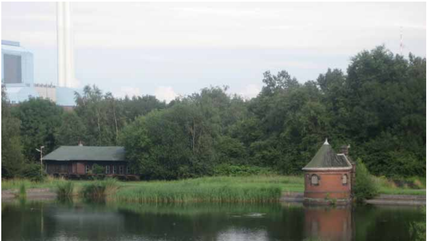
Idylle auf Kaltehofe?