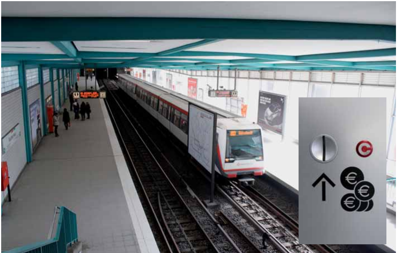
Falsche Preis-Richtung: an der U-Bahn-Station Rauhes Haus

Verlässlich wie Weihnachten »erfreut« der Senat zum Jahresende die HVV-KundInnen mit einer Erhöhung der Fahrpreise. Während mensch Weihnachtsgeschenke zurückgeben kann und Geld oder einen Gutschein dafür erhält, muss der/die HVV-NutzerIn das ganze nächste Jahr über für dieses Geschenk bezahlen. Besonders ärgerlich ist, dass die Fahrpreiserhöhungen nicht notwendig sind. Doch der Reihe nach.