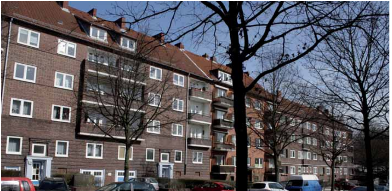
Auch Wohnen in Hamm wird immer teurer