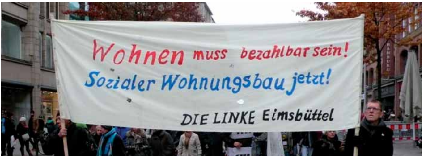
Mietendemo, 10.11.2013

Eimsbüttel – fangen wir damit an, wie »Wikipedia« es beschreibt: »Der Bezirk Eimsbüttel ist einer der sieben Verwaltungsbezirke in Hamburg. Er beherbergt die Universität Hamburg sowie im Stadtteil Rotherbaum das Universitätsviertel. Eimsbüttel gilt als bedeutender Standort der deutschen Medien- und Kreativwirtschaft. Gleichzeitig sind im Bezirk bedeutende deut-