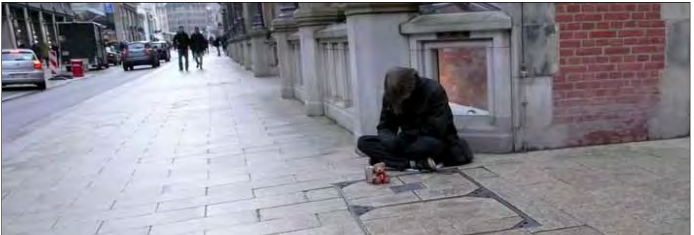
Hamburger City, Dezember 2013

Die Behörde für Arbeit, Soziales, Familie und Integration (BASFI) hat zum Jahresende 2013 einen Bericht vorgelegt, der die Lebenslagen insbesondere der Hamburger Familien und SeniorInnen darstellt. Aufgezeigt werden soll, in welchen Feldern Sozialpolitik die Hamburgerinnen und Hamburger unterstützt und fördert. Solche Berichte markieren in Hamburg stets auch politische Grenzziehungen und Grabenkämpfe. Etwa zur selben Zeit hatte auch der Paritätische Wohlfahrtsverband seinen Jahresbericht vorgelegt. Tenor des Berichts: Deutschland war noch nie so gespalten wie heute. Die Kluft zwischen reichen und armen Bundesländern öffnet sich: »Ganze Regionen befinden sich in einer Abwärtsspirale.«