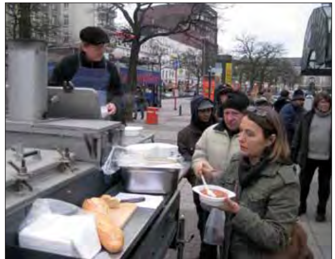
Suppenküche auf dem Hachmannplatz 2013 (M. Joho)

Die These von der rückläufigen Armutsgefährdung ist ziemlicher Quatsch. In Hamburg hat sich die Politik die Ver-