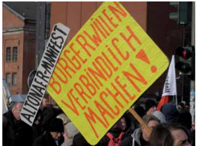
BürgerInnen wollen mitbestimmen (M. Joho)

Sanierungs-, Quartiers- und Stadtteilbeiräte blicken in Hamburg auf eine inzwischen langjährige Geschichte zurück. Der erste Sanierungsbeirat entstand 1979 in St. Georg (es gibt ihn noch heute – als Stadtteilbeirat), viele weitere Gremien dieser Art folgten (und arbeiten größtenteils auch noch gegenwärtig). Zurzeit gibt es gut 50 Gremien dieser Art. Sie sind allerdings sämtlich bedroht, das eine heute, das andere morgen, weil die Gremien in die Logik des Rahmenprogramms Integrierte Stadtteilentwicklung (RISE) eingebunden sind und die finanzielle Absicherung der BürgerInnenbeteiligung sowie der Gremienbetreuung nach einem mehr oder weniger langen Förderzeitraum auch wieder ausläuft. Was in den letzten Jahren klaglos hingenommen wurde – besten-