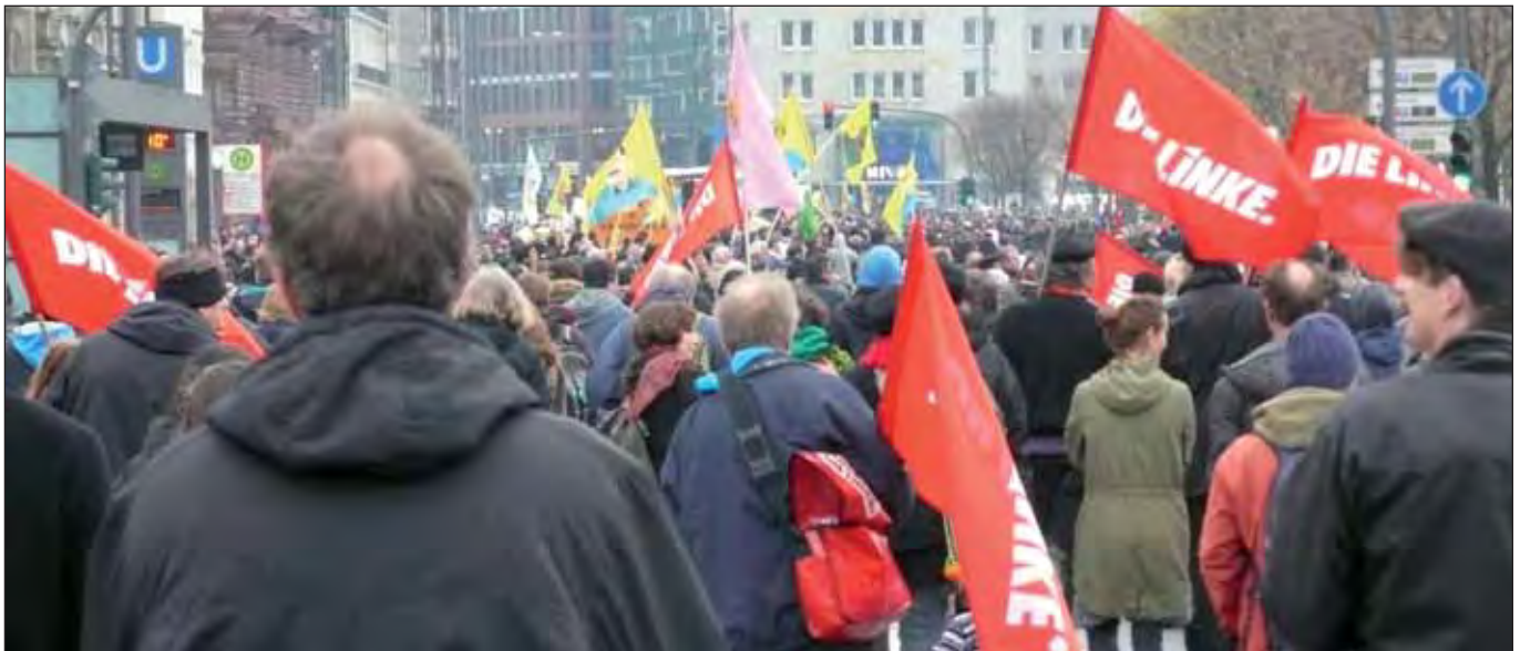
Demo gegen Wohnungsnot, 10.11.2012