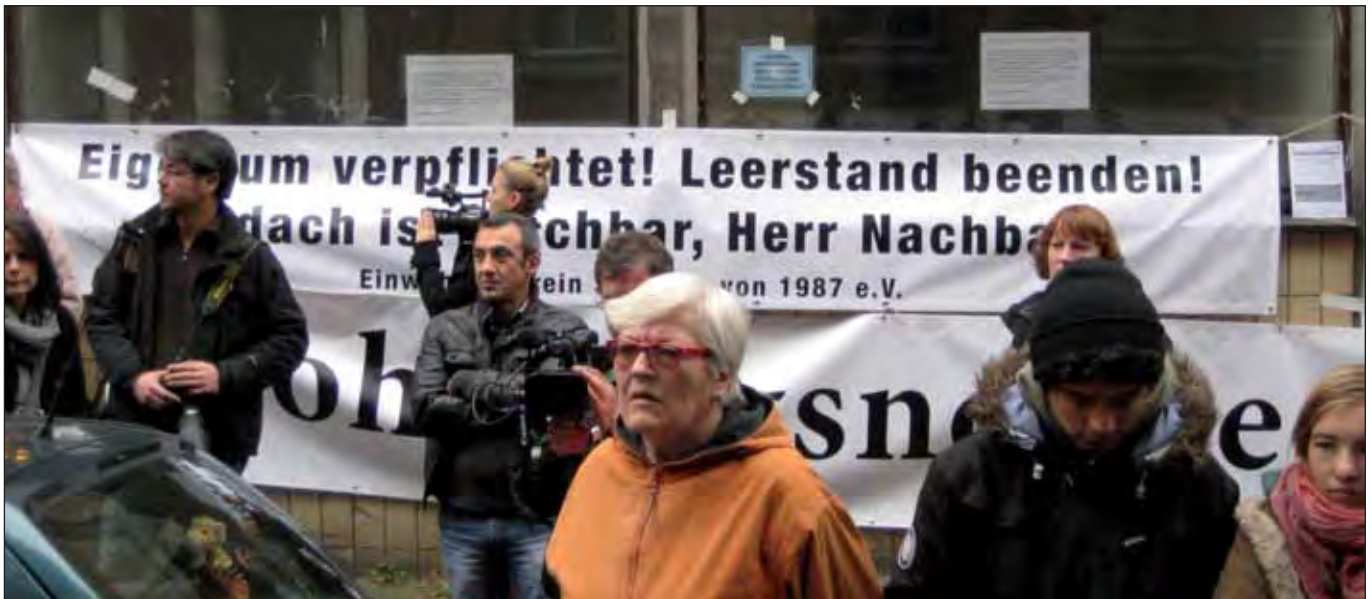
»Obdach ist machbar«, St. Georg, 17.10.2013

Anteil öffentlich geförderter Wohnungen bei Liegenschaftsflächen.