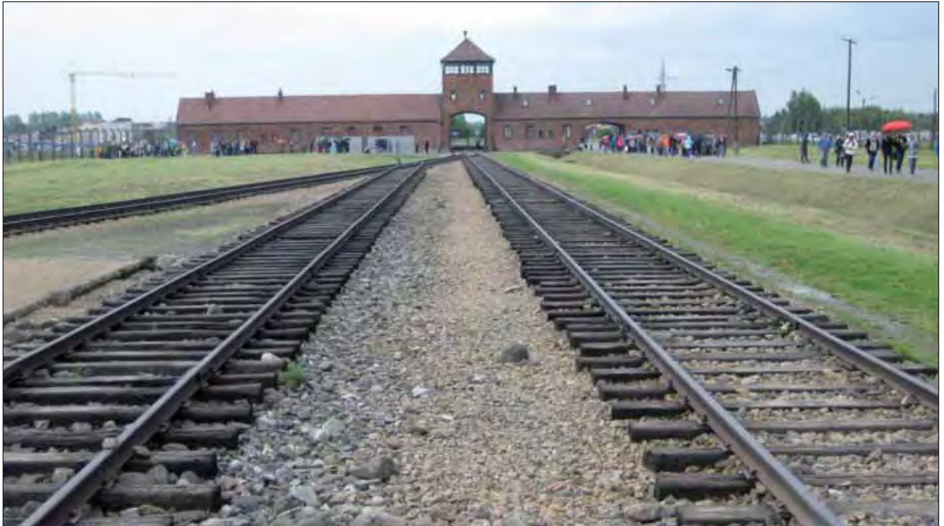
Auschwitz – Ort des Verbrechens gegen die Menschlichkeit, 2013

Der Jahrestag der Befreiung des Konzentrations- und Vernichtungslagers Auschwitz durch die Rote Armee am 27. Januar 1945 wird weltweit und auch in Hamburg seit langem mit Veranstaltungen in Erinnerung gehalten. Gegen das Vergessen ist auch die Veranstaltung des Auschwitz-Komitees am Sonntag, den 26. Januar, um 13 Uhr im »Polittbüro« (Steindamm 45) gerichtet. »Wir haben überlebt!«, darüber berichten ZeitzeugInnen und legen Zeugnis ab über Leben, Tod und Solidarität in den Zeiten rassistischer und politischer Verfolgung im Faschismus.