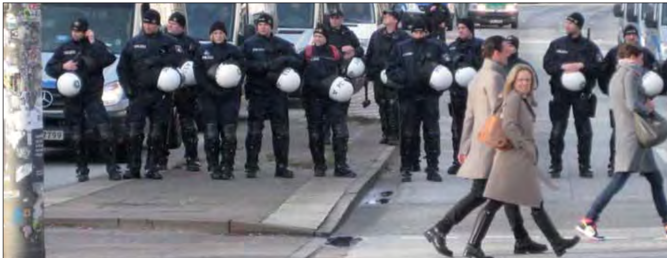
Dauerpräsenz der Polizei (M. Joho)

die Kontrolle der Verwaltung durch die Öffentlichkeit enorm erleichtert. Doch die (gescheiterte) Demonstration mit ihren drei zentralen Anliegen – »Die Stadt gehört allen! Refugees, Esso-Häuser und Rote Flora bleiben« – lenkt den Blick auf ein grundlegendes Problem.