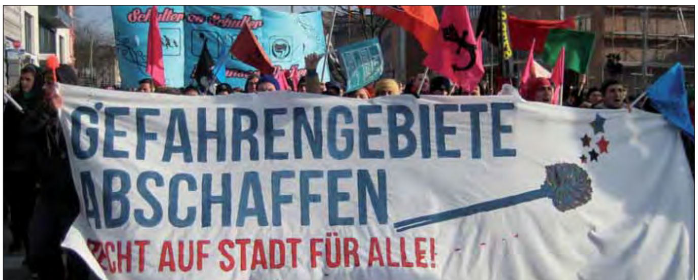
Demonstration am 18.1.2014

Im Ranking von »Mehr Demokratie« nimmt Hamburg in Sachen direkter Demokratie mit zahlreichen Volksentscheiden die Spitzenposition ein. Tatsächlich gibt es ein recht fortschrittliches Volksgesetzgebungsverfahren und ein Transparenzgesetz, das