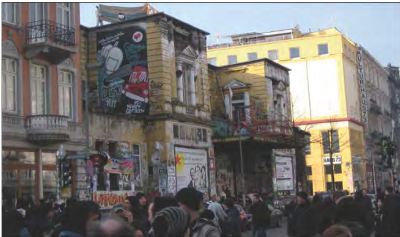
Kulturzentrum Rote Flora am Schulterblatt