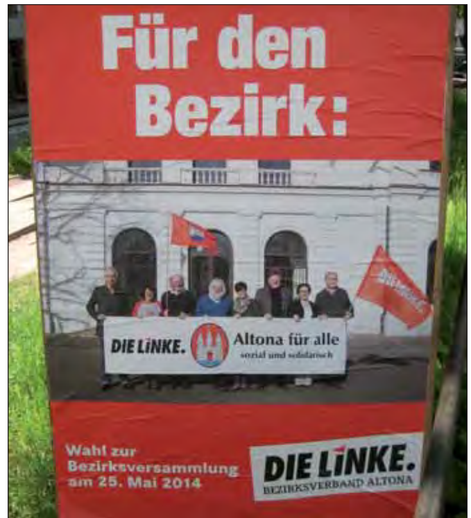
Weiter einmischen in Altona!

Darauf wurde eine Ausweich-Unterbringung der jungen Leute in dem ehemaligen Clubhaus des Polizei-Schießvereins neben dem Altonaer Volkspark angeboten, allerdings zu sehr merkwürdigen Bedingungen. Während Obdachlose im Rahmen des Winternothilfeprogramms des Senats kostenlos – z.B. in der Spaldingstraße – versorgt werden, gibt es Miet- bzw. Pachtverträge mit den bestehenden Bauwagenplätzen wie Gaußstraße, Rondenburg oder Zomia, wo die BewohnerInnen ca. 100 bis 130 Euro monatlich selber aufbringen müssen, dafür dann aber auch eine Bauwagen-kompatible Fläche zur Verfügung gestellt bekommen. Den Stresemannstraßen-Punks wird auf diesem ehemaligen Schießplatz eine gerade mal 3 qm große Fläche pro Person angeboten, zwar beheizt und mit Toiletten und Duschen, aber zusammen mit ihren Hunden eigentlich nicht nutzbar, zumal man einen engen Zaun um