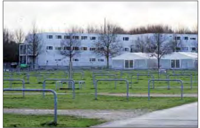
HSV-Parkplatz Braun (K. Desmarowitz)

Im Dezember 2012 kam nun Innensenator Neumann in den Hauptausschuss des Bezirks Altona und stellte fest, dass die dreimonatige Erstaufnahme überlastet sei. Da sei doch der im Winter von den Roma und Cinti eh nicht genutzte Parkplatz Braun ideal. Es handele sich ohnehin nur um eine vorübergehende Maßnahme und auch nur um 150 Flüchtlinge. Wenig