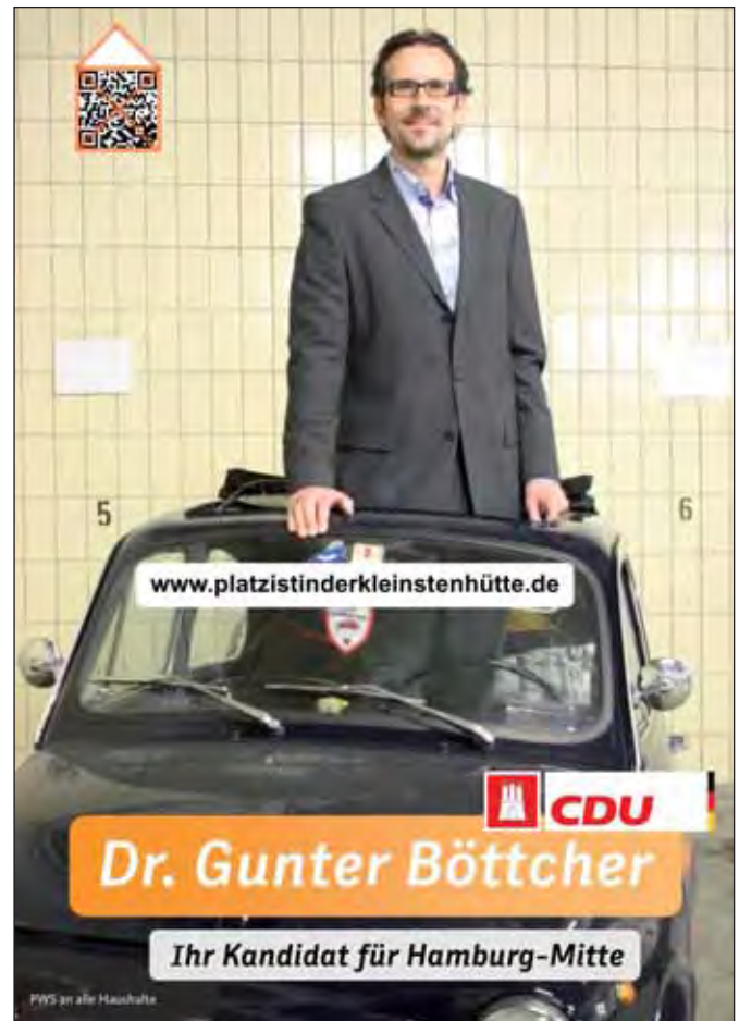
Neue Bescheidenheit: CDU-Plakat und -Flyer in Hamburg-Mitte

In Hamburg-Mitte ist dieses »Unter-sich-bleiben« sehr ausgeprägt. Und wie stößt man in einem solchen Quartier die Sozialdemokratie mit ihrer Arroganz der Macht vom politischen