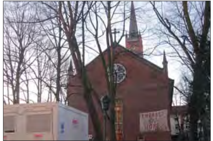
St. Pauli-Kirche