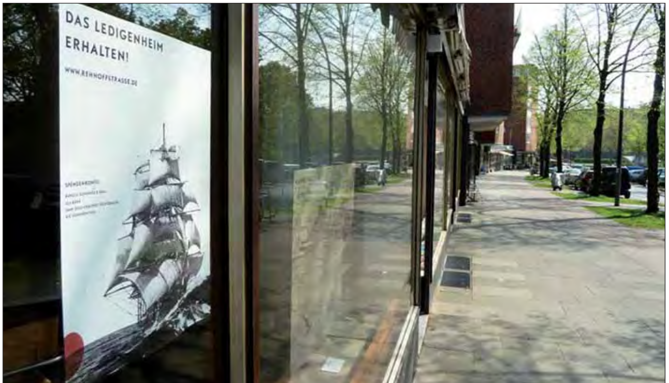
AG Rehhoffstraße: Plakataktion

Die Initiative und die Stiftung sind im Internet zu finden unter www.rehhoffstrasse.de . Dort gibt es alle Einzelheiten, die Interessierte und potenzielle SpenderInnen wissen müssen. Bei Interesse kann über die Mailadresse post@rehhoffstrasse.de persönlich Kontakt aufgenommen werden.