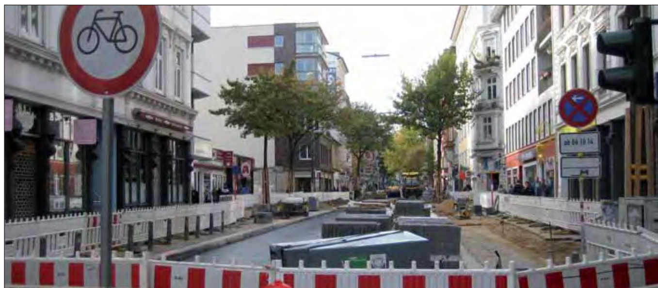
Baumaßnahme Lange Reihe, Ende Oktober 2014

Das Busbeschleunigungsprogramm des Senats stand von Anfang unter einem schlechten Stern, war es doch aus der Not heraus geboren, die Ablehnung einer Stadtbahn für Hamburg durch den Bürgermeister Olaf Scholz und seine SPD »irgendwie« zu kompensieren. Der Senat hätte aus der Not eine Tugend machen können: mit sinnvollen Maßnahmen, die eindeutig dem Busverkehr zu Gute gekommen, die später vielleicht sogar für eine Stadtbahn zu nutzen gewesen wären (Stichwort: Busspuren). Doch aus welchen Gründen auch immer hat die SPD sich für die Methode mit der Brechstange entschieden: Planungen vom Behördentisch wurden der Öffentlichkeit als alternativlos vorgesetzt. Eine Beteiligung der Bür-