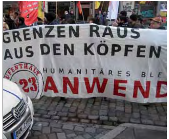
Demo für (Lampedusa-) Flüchtlinge, 18.1.2014

Angesichts der Dynamik bei EU-interner Zuwanderung und Flüchtlingsbewegung gehört wenig Phantasie dazu, von einer massiven Unterversorgung in Hamburg zu sprechen. Die Gesamtausgaben für Wohnungslose und registrierte