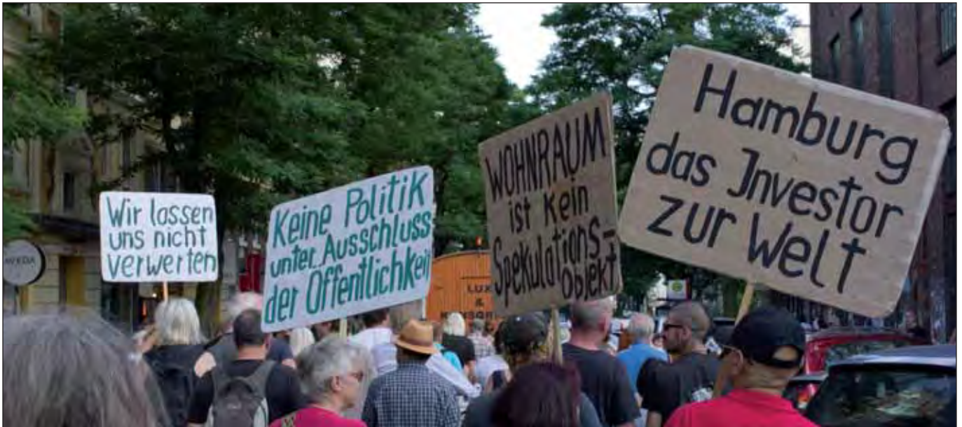
Demo der Initiative »Altonaer Manifest«

Auch wenn der Bürgerentscheid am vergangenen Wochenende bereits entschieden wurde, nehmen wir hier einen eigenen für den »BürgerInnenbrief« verfassten Beitrag auf, der beispielhaft veranschaulicht, wie es mit der BürgerInnenbeteiligung in Hamburg konkret ausschaut und mit welchen Tricks versucht wird, demokratische Abstimmungen zu unterlaufen.