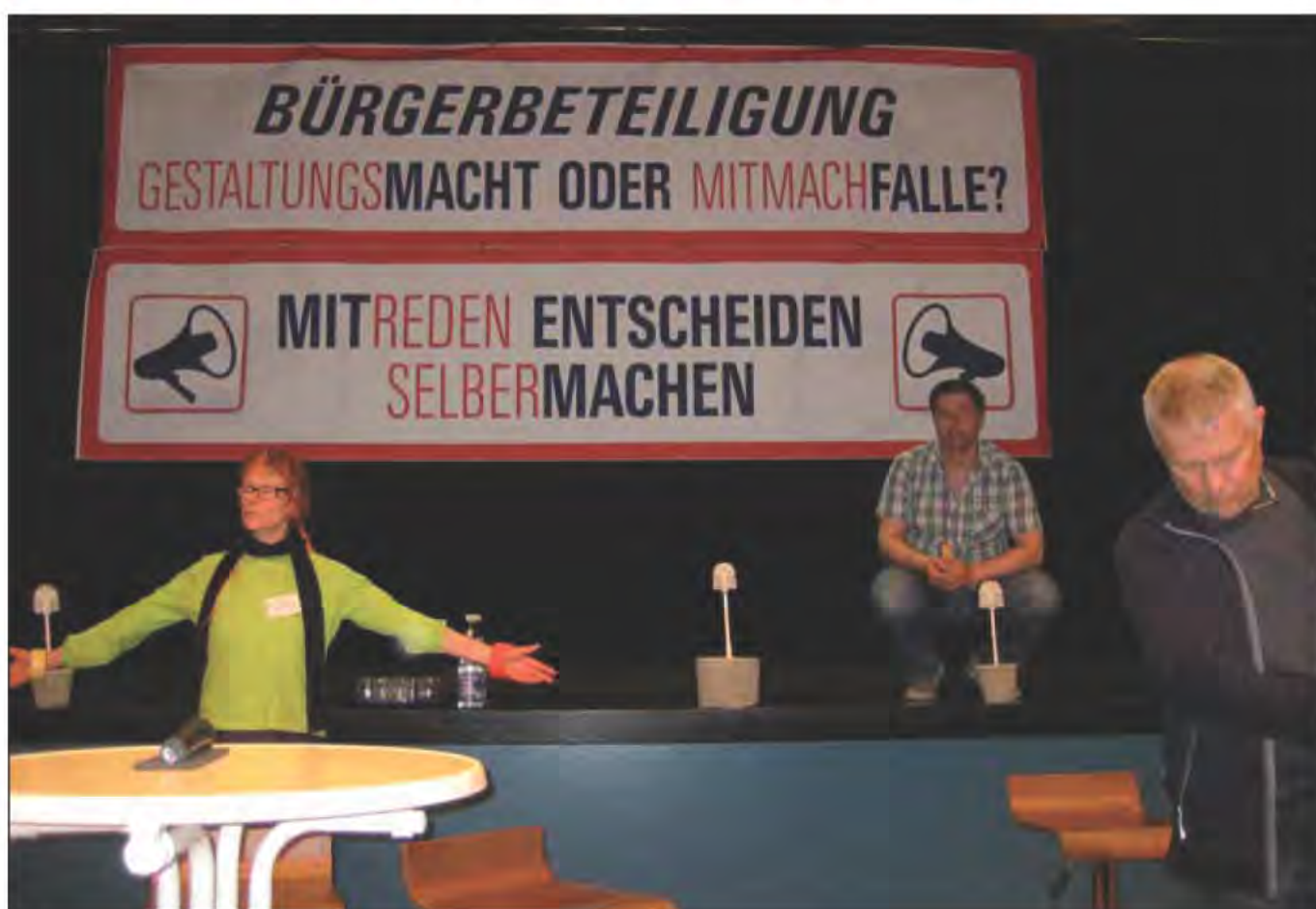
1. Beteiligungsforum am 9. Mai 2014 im Bürgerhaus Wilhelmsburg (M. Joho)

In den letzten Jahren ist der Ruf nach mehr und vor allem echter BürgerInnenbeteiligung sehr viel lauter geworden. Die Menschen geben sich längst nicht mehr zufrieden mit der rein repräsentativen Demokratie, die sich im Kern darin erschöpft, alle vier oder neuerdings nur noch fünf Jahre wählen zu gehen, das heißt »seine Stimme abzugeben«. Vielmehr geht es um die nachhaltige Stärkung von partizipativen und plebiszitären Elementen in der politischen Alltagsrealität, aber auch in Verordnungen, Gesetzen und sogar in der Verfassung. Bei der plebiszitären Ebene sind wir – wenn auch noch nicht