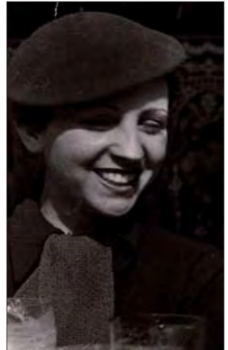
V.l.n.r.: Museum für Kunst und Gewerbe; Fabrik der Künste; Gerda Taro

Wir empfehlen diesmal drei höchst unterschiedliche Ausstellungen. Wie schon im letzten »BürgerInnenbrief« berichtet, wohnen 18 von insgesamt 123 superreichen Milliardären in Hamburg. Bei den Millionären sind es geringfügig mehr, nämlich 42.000 alleine in der Elbmetropole, so war es im »Hamburger Abendblatt« am 24. September zu lesen. Das sind schon beeindruckende Zahlen. Wer Reiche in ihrer ganzen Obszönität begutachten möchte, dem/der sei ein Besuch des Museums für Kunst und Gewerbe (Steintorplatz 1) empfohlen. Dort wird noch bis zum 11. Januar 2015 die Ausstellung Fette Beute. Reichtum zeigen präsentiert. Zu sehen sind rund 150 Fotografien, aber auch Kurzdokumentationen und Videos von internationalen KünstlerInnen, die einen unverstellten Blick auf »die oberen Zehntausend« ermöglichen. »Geld macht nicht glücklich. Aber reich«, titelt selbst das »Abendblatt« (17.10.). Die »Morgenpost« steht dem mit ihrer Headline nicht nach: »So protzen und prahlen die Reichen« (17.10.). Auch wenn die »junge welt« einen Verriss der Ausstellung liefert – »Effekt: null« (23.10.) – und kritisiert, dass die Darstellungen »keine ernsthafte soziologische Deutung« des Phänomens Reichtum eröffnen, lässt sich das doch mit ein wenig Phantasie nachhaken. Mehr unter www.mkg-hamburg.de .