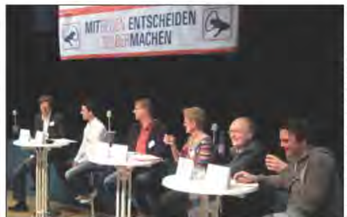
Podiumsdiskussion am 9. 5.2014

von Partizipationsforderungen, auch im Hinblick auf die im Februar anstehenden Bürgerschaftswahlen. Auch wir unterstützen dieses 2. Beteiligungsforum und rufen auf zur Beteiligung. Mehr dazu ist dem auf der folgenden Seite abgedruckten aktualisierten Aufruf und auch der Website www.beteiligungsforumhamburg.wordpress.com zu entnehmen.