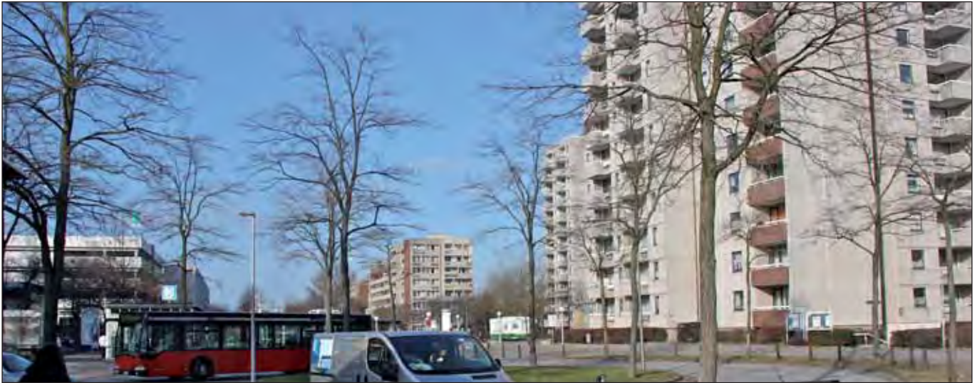
Genug billige Wohnungen? Mümmelmannsberg (wikipedia)

Eine Kostensenkungsaufforderung ist eine Information des Grundsicherungsträgers, meist also des Jobcenters, an den Leistungsberechtigte/n über die Unangemessenheit seiner Aufwendungen für Unterkunft und Heizung. Übersteigen diese Aufwendungen den »angemessenen« Umfang, sind sie als Bedarf so lange anzuerkennen, wie es dem alleinstehenden Leistungsberechtigten oder der Bedarfsgemeinschaft nicht möglich oder nicht zuzumuten ist, durch einen Wohnungswechsel, durch Untervermieten oder auf andere Weise die Aufwendungen zu senken. In der Regel, so das Gesetz, erfolgt die Anerkennung der nicht angemessenen Aufwendungen für längstens sechs Monate. Ist eine Absenkung der unangemessenen Aufwendungen auf einen angemessenen Betrag zumutbar und möglich, trifft den Leistungsberechtigten die Obliegenheit hierzu. Kommt er dieser nicht nach, so berücksichtigt der Grundsicherungsträger nach Ablauf der zu einer möglichen Absenkung notwendigen Zeit die Aufwendungen für Unterkunft und Heizung nur noch in besagter angemessener Höhe.