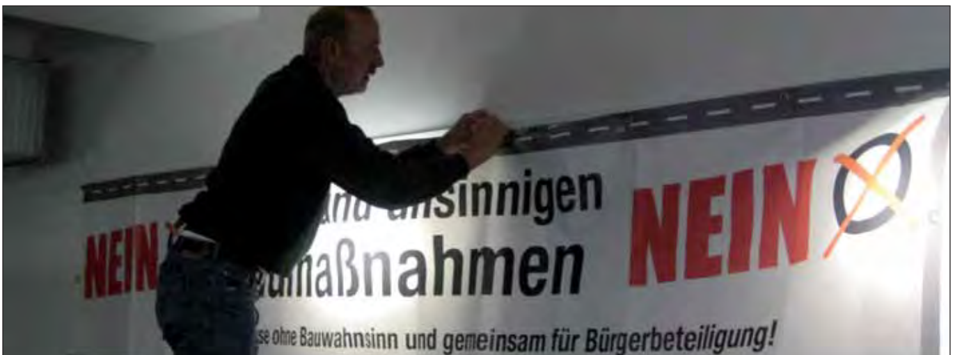
Auf dem 2. Beteiligungsforum, 14.11.2015

Die Anhörung brachte auch einen klassischen Konflikt wieder ans Licht. Verbal unterstützen alle den Öffentlichen Personennahverkehr (ÖPNV) und auch den Radverkehr. Droht jedoch z.B. ein Wegfall von Parkplätzen zugunsten von Busspuren oder Fahrradstreifen, kommen einige AutofahrerInnen ins Schwanken mit ihrer Unterstützung. Deshalb wird es wichtig sein, den ÖPNV so zu gestalten, dass ein Verzicht auf das eigene (auch Zweit-)Auto machbar und vertretbar ist. Neben dem ÖPNV ist ein gutes Radverkehrs- und Fußwegenetz eine Voraussetzung hierfür.