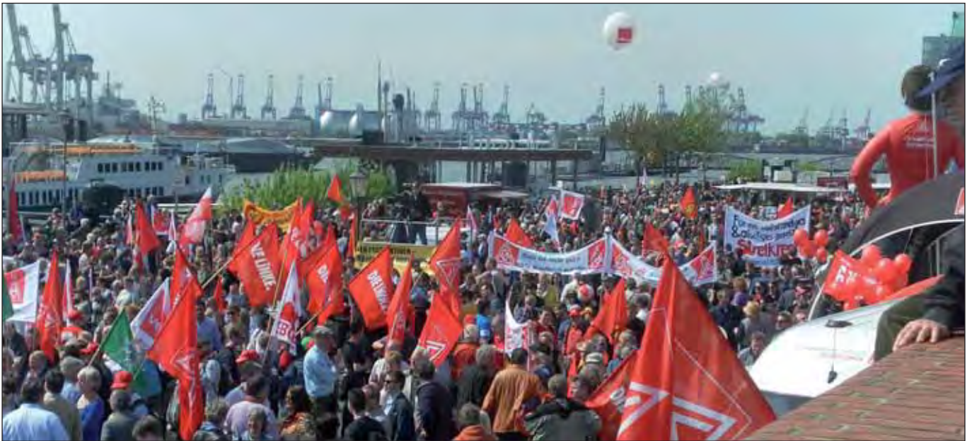
1. Mai 2012 auf dem Fischmarkt

Welche Partei auch immer den künftigen Hamburger Senat führt, welche Koalition auch immer den neuen Senat bildet: Ohne eine starke Linksfraktion in der Bürgerschaft wird die soziale Gerechtigkeit auf der Strecke bleiben.