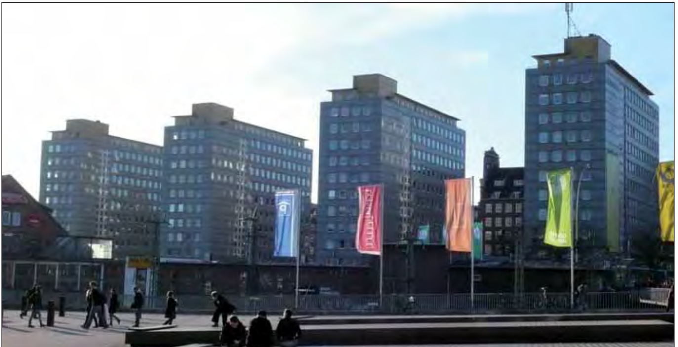
Die Cityhochhäuser, 21.11.2013

»100% Demokratie« – so ist das 18. Kapitel der Langfassung des Programms der Hamburger LINKEN zur Bürgerschaftswahl am 15. Februar 2015 überschrieben ( www.die-linke-hamburg.de/fileadmin/Wahlen_2015/Dokumente/WPrg_141115_raw.pdf ). Zitieren wir daraus nur einmal die ersten Absätze: