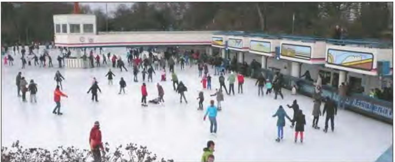
Guten Rutsch, Eislaufarena Wallanlagen

Der letzte BürgerInnenbrief vor dem Jahreswechsel und der danach folgenden heißen Phase des Wahlkampfes lässt uns noch einmal kurz innehalten und auf das Jahr zurückblicken. Schließlich war viel los, in dieser Woche noch einmal ganz besonders, quälen sich doch die Abgeordneten der Bürgerschaft durch den dreitägigen Haushaltsmarathon.