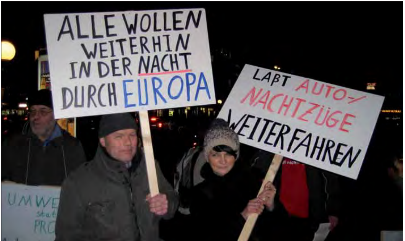
Demo am 11.12.2014 in Hamburg-Altona

Mit einer Aktion vor dem Bahnhof Altona protestierte die Linksfraktion am 11. Dezember gegen die Abschaffung der Hamburger Nachtzug- und Autozugverbindungen. Konkreter Anlass war der an diesem Abend – um 19.57 Uhr – hier abfahrende letzte Nachtzug nach Paris.