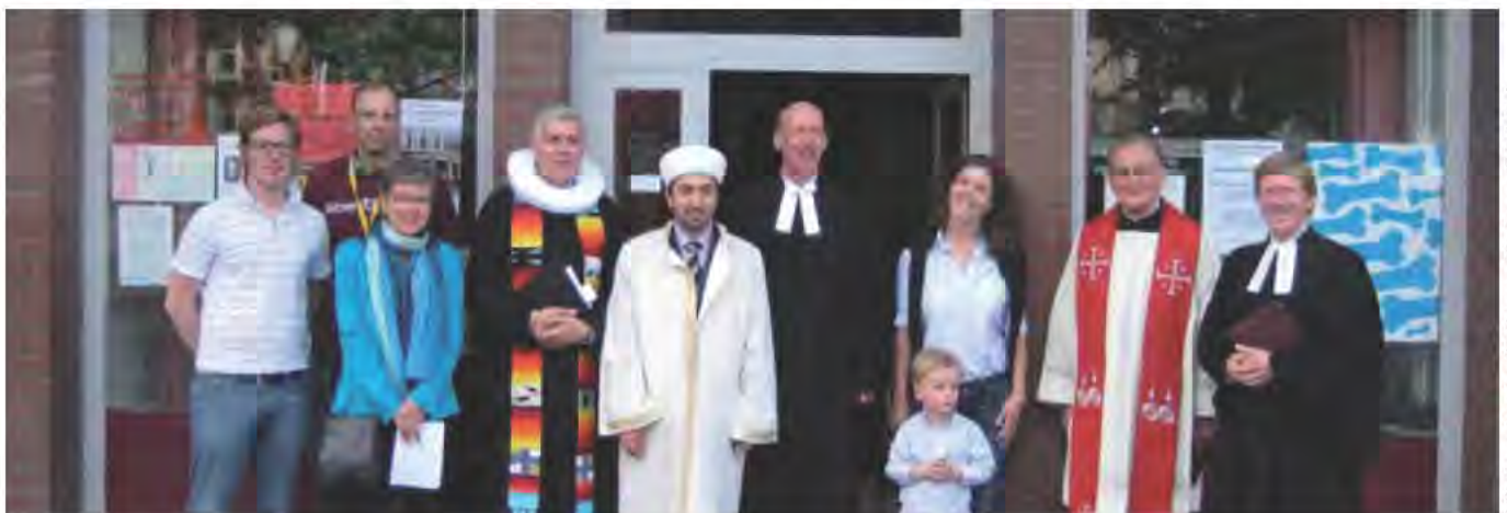
Miteinander der Kulturen, St. Georg (M. Joho)

Angesichts der oberflächlichen Auseinandersetzung mit den unterliegenden gesellschaftlichen Problemen trifft Renate Köcher in der FAZ eine etwas waghalsige Prognose: »Die AfD erfüllt mehrere Voraussetzungen für einen zumindest mittelfristig andauernden Erfolg: ein klares Zielprofil, in dem Themen von Gewicht dominieren; eine Positionierung, die von vielen und insbesondere den eigenen Anhängern als deutlich abweichend von anderen Parteien wahrgenommen wird; eine