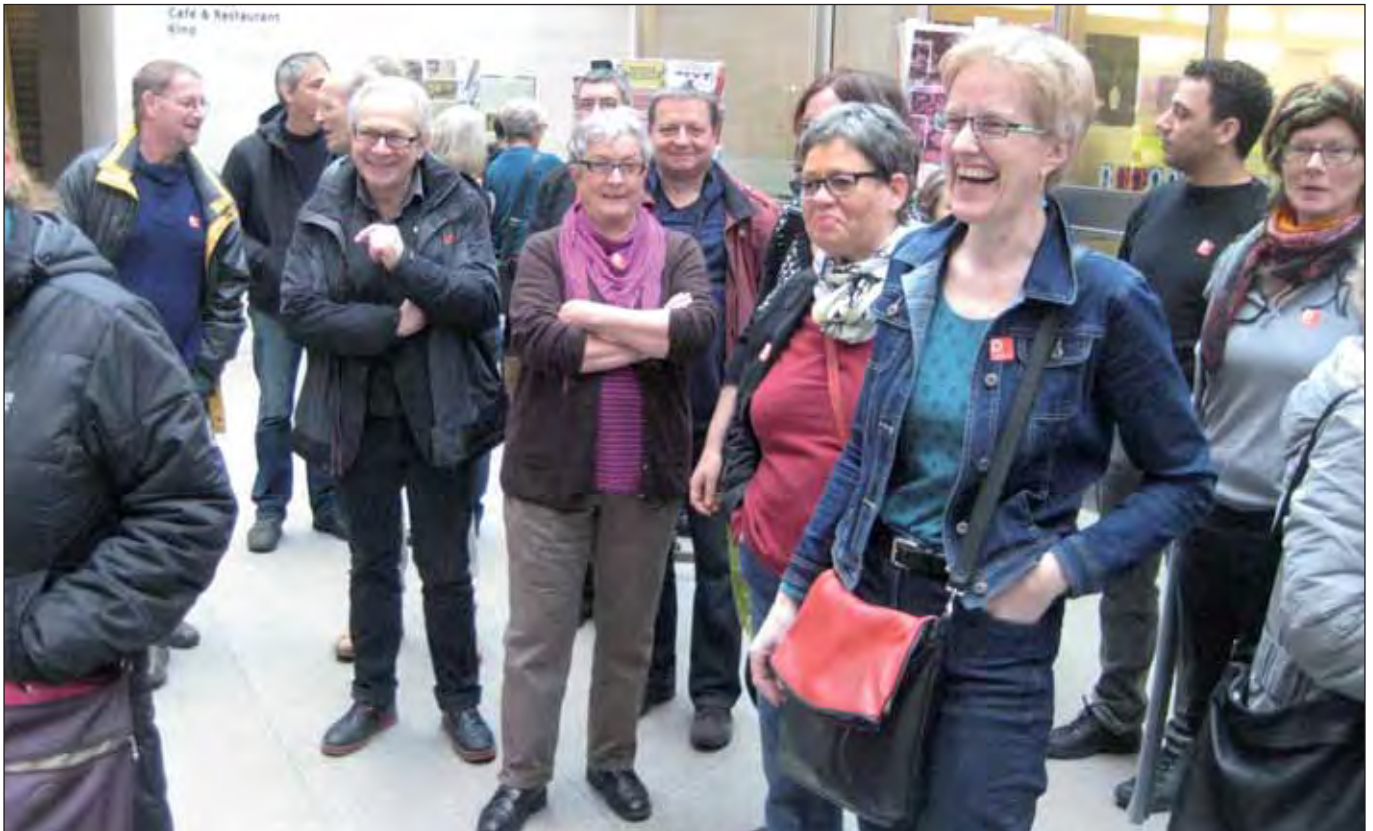
Mit der LINKEN nach Berlin: Vor dem Besuch der Ausstellung zum Ersten Weltkrieg