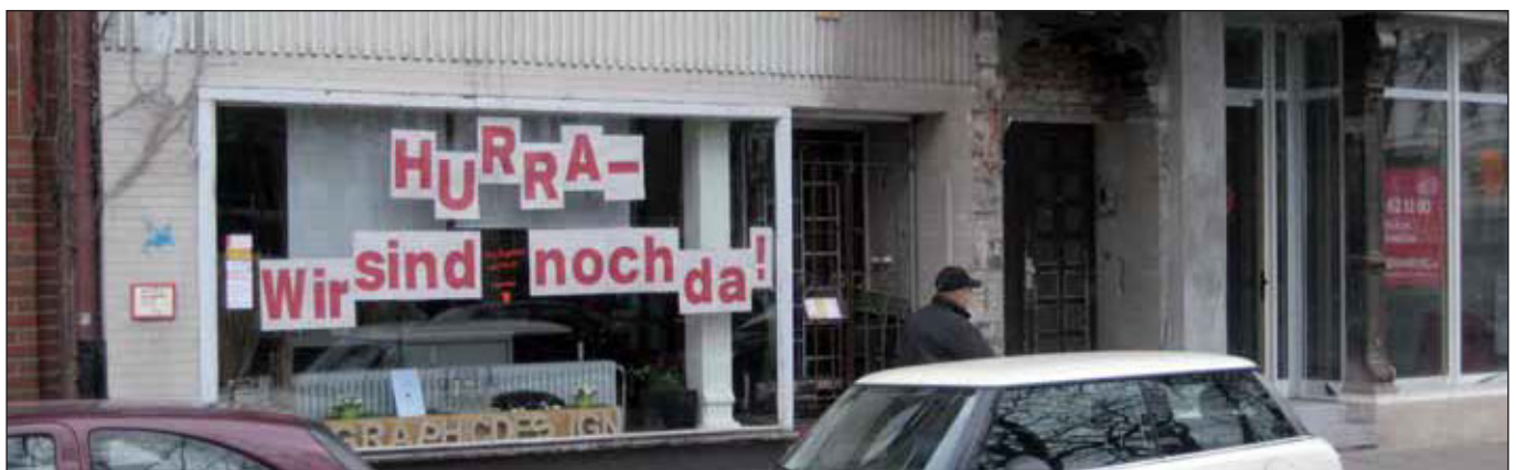
In der Danziger Straße

Noch ganz andere Möglichkeiten würde das Fördersystem in österreichischen Städten eröffnen. Erheblich längere Laufzeiten und das Prinzip »Einmal gefördert, immer gefördert« sind dort Wirklichkeit. Und Salzburg zeigt zudem, dass sozialer Wohnungsbau unter Ausschaltung der Banken und privater Eigentümerinteressen für 4,78 Euro/qm zu haben ist« (taz, 11.11.2012).