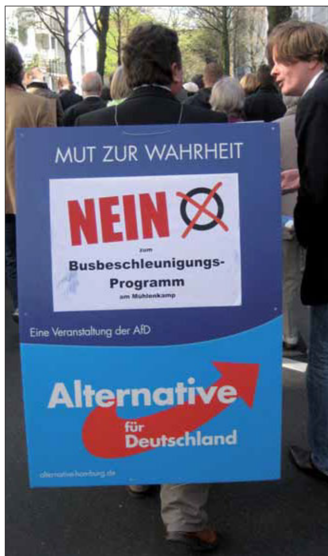
Unwillkommene AfD-Mitwanderung bei Demo in Winterhude 2014

Rechtskonservative, rechtsextreme und rechtspopulistische Parteien stützen sich vor allem auf die unteren sozialen Mittelschichten und verfolgen das Ziel, eine nationalstaatliche Ausrichtung durchzusetzen, wobei das unterliegende Staatsverständnis sich an autoritären Strukturen orientiert. Für rechtspopulistische Parteien ist kennzeichnend, dass sie in ihren Strategien an das »Volk« und an ein »Wir-Gefühl« appellieren, gegen die Eliten protestieren und einfache Erklärungs- und Lösungsmuster für komplexe Sachverhalte verwenden.