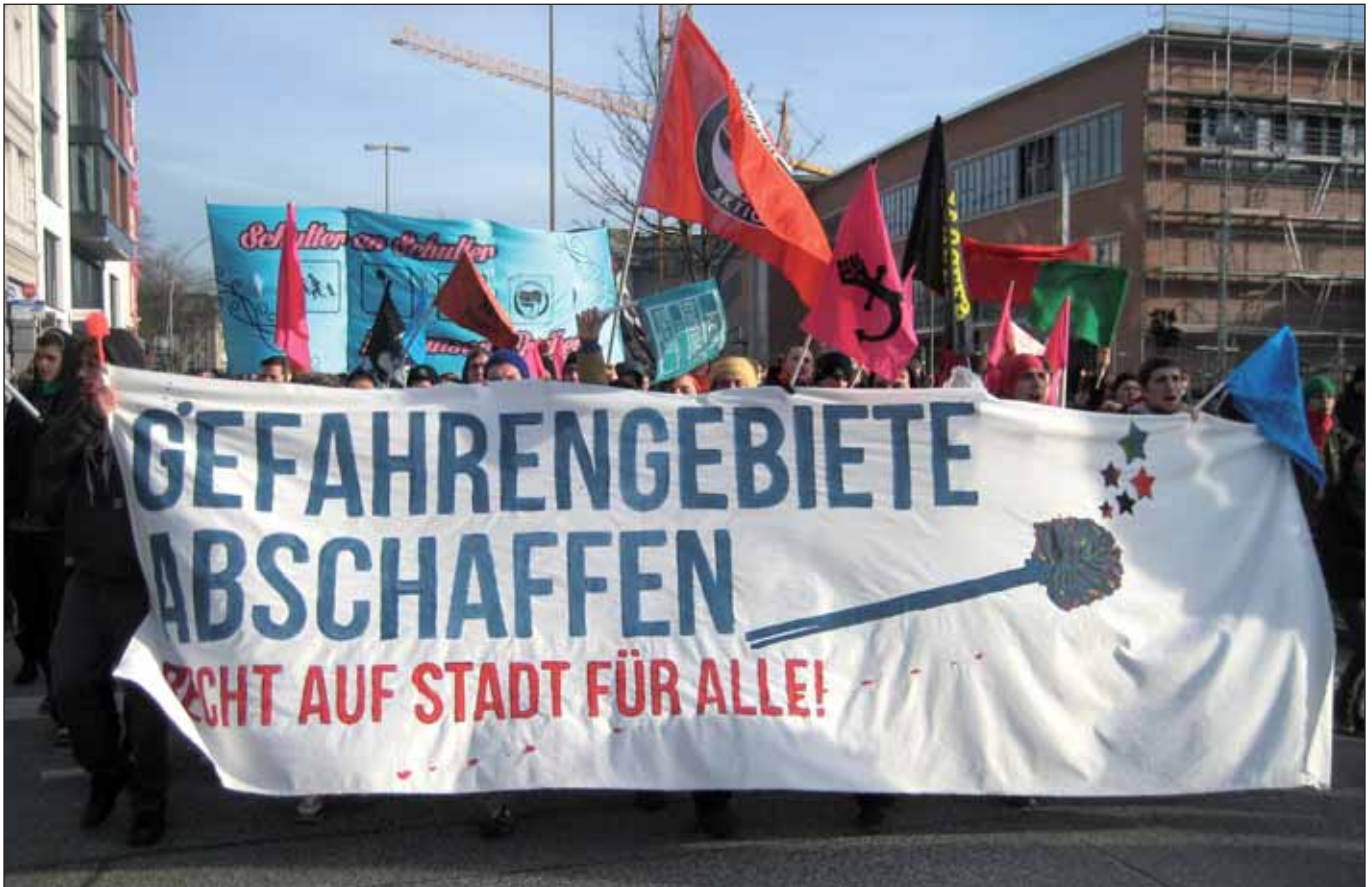
Demo im Januar 2014

»Tatsachen«, schrieb Hannah Arendt in »Wahrheit und Politik«, »sind der Gegenstand von Meinungen, und Meinungen können sehr verschiedenen Interessen und Leidenschaften entstammen, weit voneinander abweichen und doch alle noch legitim sein, solange sie die Integrität der Tatbestände, auf die sie sich beziehen, respektieren«.