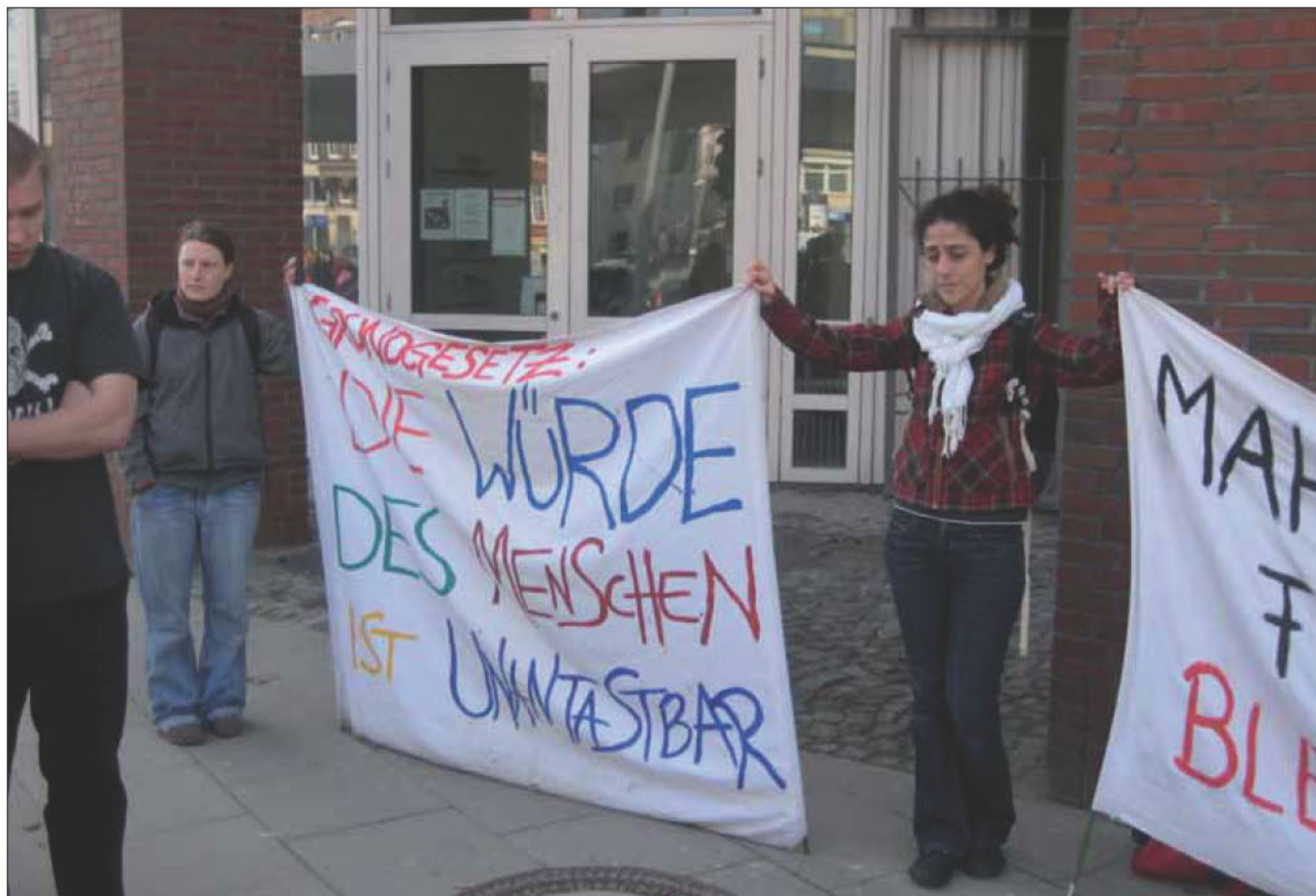
Mahnwache vor der Ausländerbehörde in der Amsinckstraße

Auf zwei Veranstaltungen in den kommenden Wochen möchten wir besonders aufmerksam machen: auf die auch von der Hamburger LINKEN unterstützte Demonstration des Netzwerks Recht auf Stadt und Never mind the Papers am 28. Mai sowie eine Veranstaltung des Bündnisses Stadt des Ankommens am 10. Juni. Nicht ganz zufällig geht es in beiden Fäl-