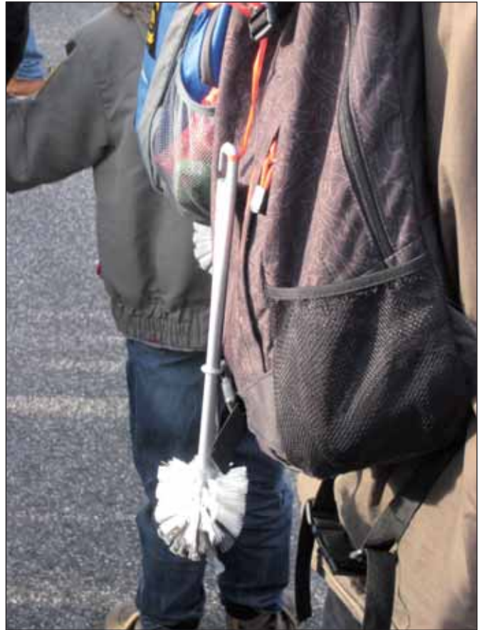
Demoutensil im Januar 2014

Tatsächlich sollen die Vorgaben für die Ausweisung »gefährlicher Orte« klarer gefasst werden. War bis jetzt die »Lagebeurteilung« durch die Polizei ausreichend, sollen nun »Tatsachen, die die Annahme rechtfertigen«, dass es an den Orten gefährlich zugeht, vorliegen. Diese im Prinzip überprüfbaren Fakten sollen zu anlasslosen, verdachtsunabhängigen Kontrollen ermächtigen. Und ob die Tatsachen vorliegen – und