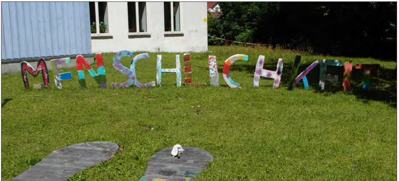
Dringend gebraucht