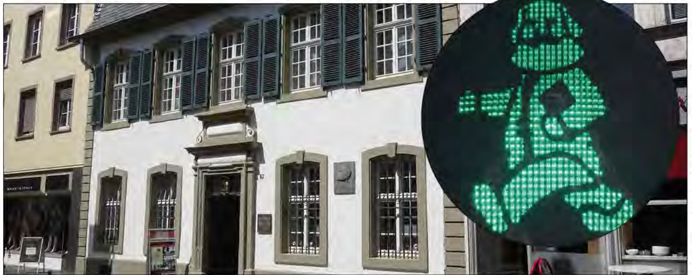
Hintergrund: Trier, Brückenstraße 10, Marx' Geburtshaus (Foto: Lutz Hartmann/Wikipedia; davor das Ampelmännchen)

Joachim Bischoff über die kapitalistische Warengesellschaft und das Marx-Jubiläum