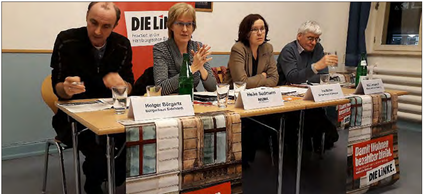
Wohnen in Eidelstedt – gut und günstig?, 21.2.2018