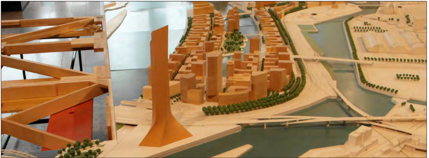
Noch analog: Ausschnitt aus dem Stadtmodell (M. Joho)

Heike Sudmann über Chancen und Risiken der »Smart City«