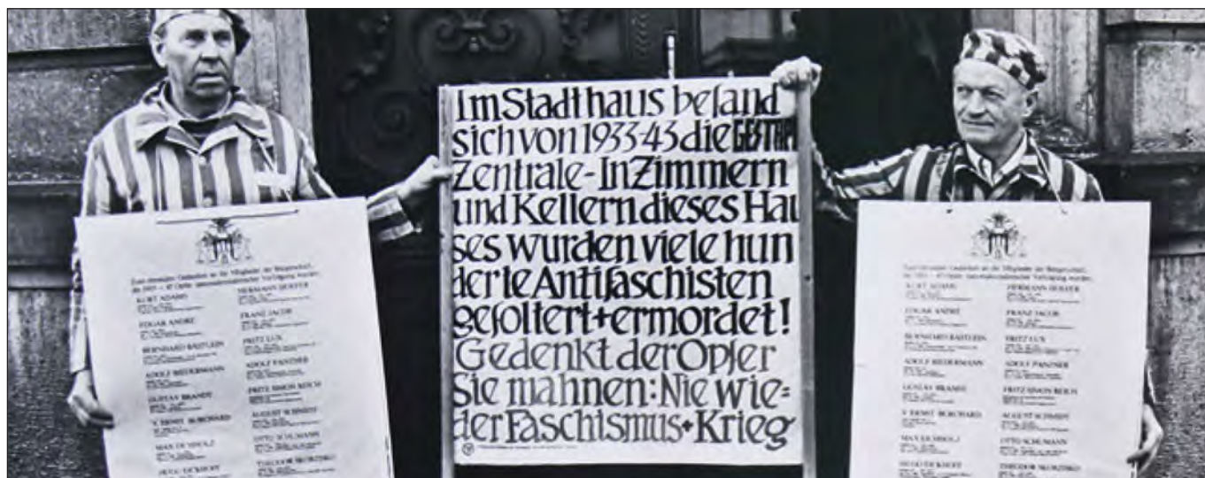
Aus dem Flyer der Initiative Gedenkort Stadthaus